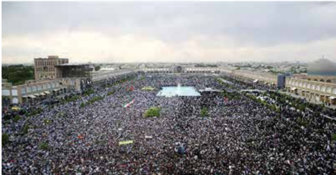
شکل ۲۴-۲- انبوهی جمعیت در میدان امام (نقش جهان) اصفهان