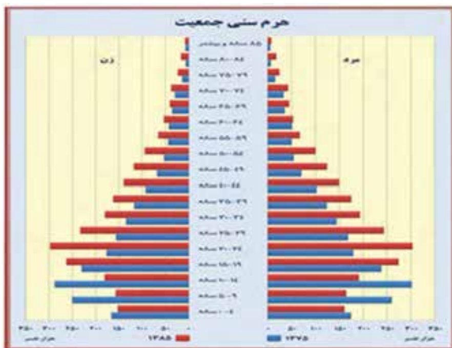
شکل ۲-۲۳- هرم سنی جمعیت استان اصفهان (مقایسه سال‌های ۱۳۸۵ - ۱۳۷۵)