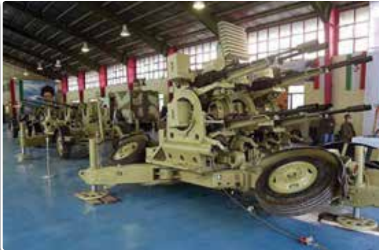
تصویر ۱-۸- سامانه دفاع هوایی مصباح

در یک تعریف ساده اقتدار به معنی آن است که فرد یا حکومت از چنان مقبولیتی برخوردار باشد که نظر او در موضوع یا مسائلی که پیش می‌آید، حرف آخر باشد و دیگران از آن اطاعت کنند.