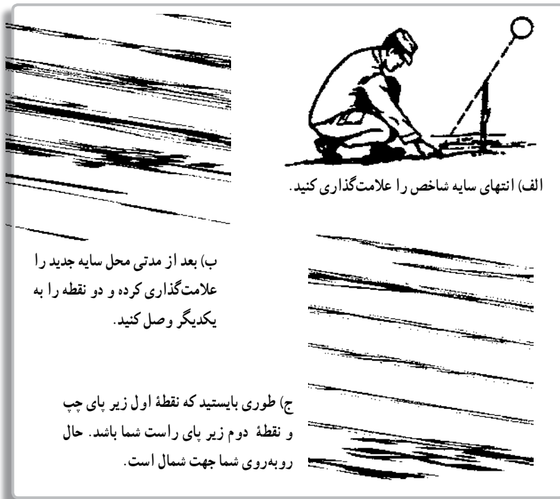
تصویر ۵-۹- روش جهت یابی به کمک سایه شاخص

۲- جهت یابی به کمک سایه شاخص : شاخص، چوب، میله یا هر شیء نسبتاً صاف و به طول تقریبی یک متر است که به صورت عمودی در زمینی مسطح نصب می‌شود. در این روش، پس از نصب شاخص، انتهای سایه آن را روی زمین با یک سنگ علامت گذاری می‌کنیم. پس از حدود پانزده تا بیست دقیقه محل جدید سایه شاخص را دوباره علامت گذاری می‌کنیم. حال اگر این دو نقطه را به یکدیگر وصل کنیم و طوری بایستیم که پای چپ روی نقطه اول و پای راست روی نقطه دوم باشد، روبه‌روی ما شمال و پشت سرمان نیز جنوب خواهد بود.