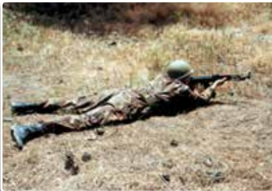
تصویر ۹-۱۴- حالت درازکش