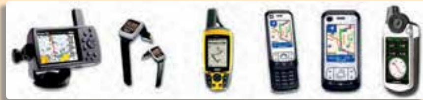
تصویر ۴-۹- انواع دستگاه‌های سامانه تعیین موقعیت جغرافیایی GPS

GPS مخفف سه کلمه Geographic Positioning Systems به معنی سامانه تعیین موقعیت جغرافیایی است. این سامانه از مجموعه ماهواره‌های موقعیت‌یاب جغرافیایی تشکیل شده که موقعیت پدیده‌های مختلف را بر روی کره زمین شناسایی و به کاربران مخابره می‌کند. کاربران با در اختیار داشتن گیرنده‌های قوی آنتن‌دار یا گیرنده‌های دستی موسوم به GPS در هر نقطه‌ای از کره زمین، حتی در حال حرکت می‌توانند موقعیت دقیق خود را دریافت کنند. گیرنده‌ها پس از برقراری ارتباط با ماهواره‌ها در فضا، مشخص می‌کنند که اکنون گیرنده در چه طول و عرض جغرافیایی و در چه ارتفاعی از سطح دریا قرار دارد و یا در چه سمتی و با چه سرعتی در حال حرکت است. این سامانه برای ردیابی یا راهبری کشتی‌ها، هواپیماها، خودروها کمک مؤثری می‌کند.