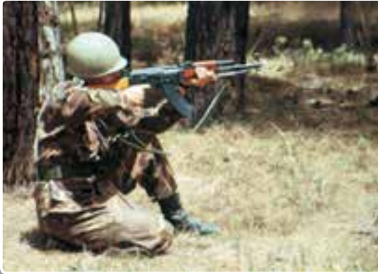
تصویر ۹-۱۳- حالت نشسته