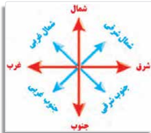
تصویر ۳-۹- جهت‌های اصلی و فرعی

۲- جهت‌های فرعی ۲ : به جهت‌هایی گفته می‌شود که در بین چهار جهت اصلی واقع شده‌اند. در تصویر زیر جهات اصلی و فرعی نمایش داده شده‌اند.