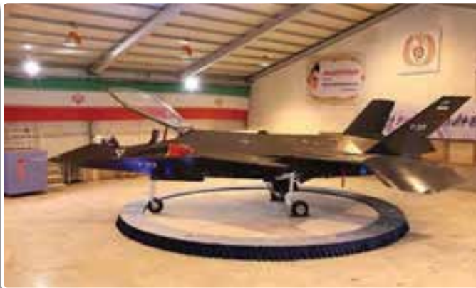
تصویر ۳-۸- هواپیمای جنگنده قاهر ساخت جمهوری اسلامی ایران