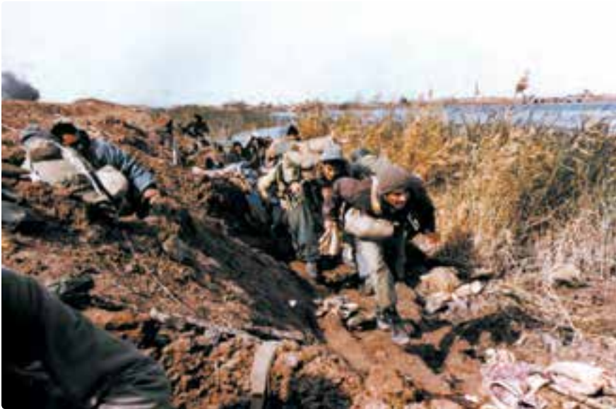
تصویر ۱-۹- دفاع رزمندگان در پشت یک خاکریز

۳- خاکریز: در مناطق باز و دشت‌ها، جهت درامان ماندن نفرات از دید و تیر دشمن، به وسیله ماشین‌آلات راه‌سازی، خاک را به ارتفاع حداقل ۲ متر در جلوی نیروهای خودی جمع می‌کنند که به آن خاکریز می‌گویند.