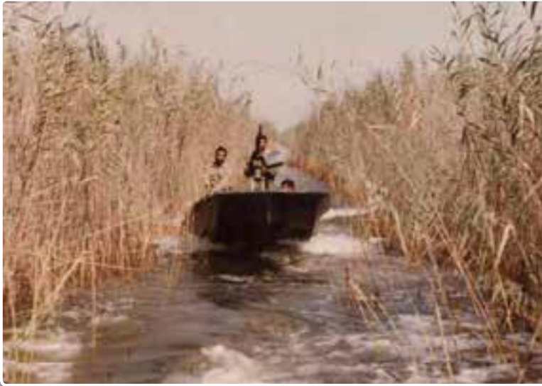
تصویر ۲-۹- رزمندگان در یکی از هورهای منطقه عملیاتی دوران دفاع مقدس

۴- هور: ماندن آب روی زمین را هور یا ماندآب می‌گویند. علت ماندن آب در این محیط نفوذناپذیری لایه‌های زیرین خاک است. معمولاً در هور علف و نی می‌روید و اطراف آن زیستگاه برخی جانوران و پرندگان می‌باشد؛ مانند هورالعظیم در خوزستان.