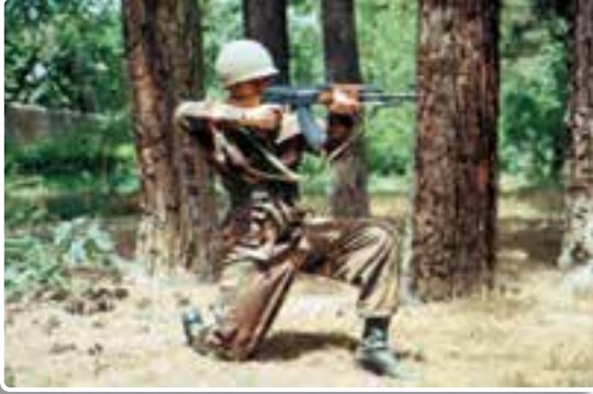
تصویر ۹-۱۲- حالت به زانو