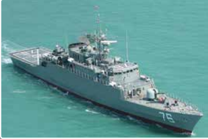
تصویر ۴-۸- ناوشکن جماران مظهر اقتدار نیروی دریایی ارتش جمهوری اسلامی ایران