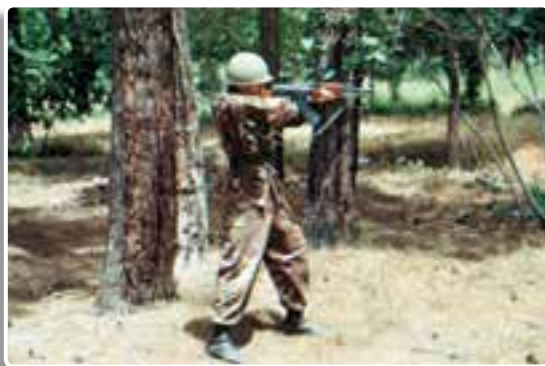
تصویر ۱۱-۹- حالت ایستاده