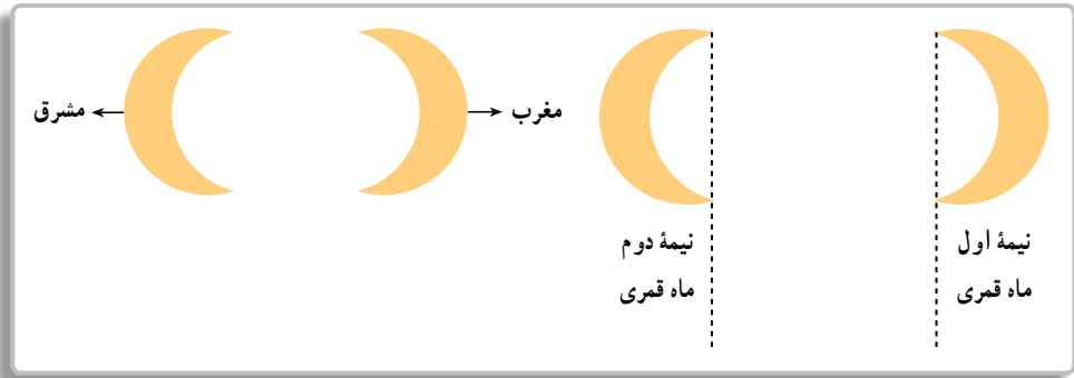
تصویر ۷-۹- روش جهت یابی به کمک ماه