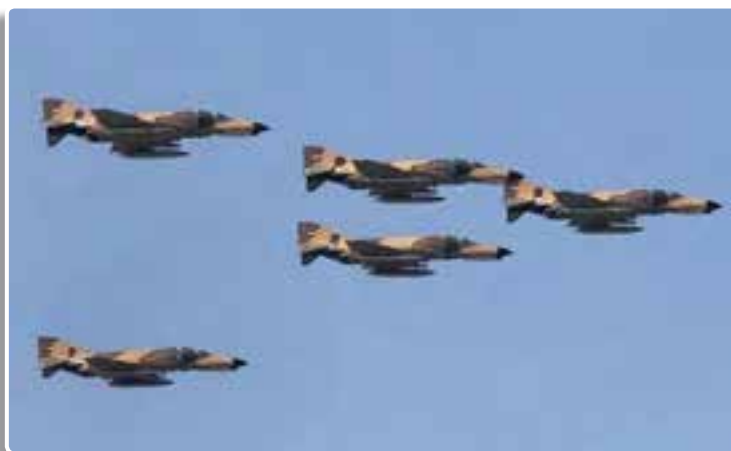
تصویر ۲-۸- رزمایش هوایی ارتش جمهوری اسلامی ایران مظهر اقتدار دفاعی ایران

خارجی در استان‌های مختلف کشور و نقاط حساس مرزی با حمایت بیگانگان و مزدورانی چون صدام (رئیس جمهور معدوم عراق) علیه این حکومت نوپا شورش کردند تا بلکه مانع به ثمر رسیدن انقلاب اسلامی شوند. ترور، کودتا، ادعاهای خودمختاری، بمب‌گذاری و سرانجام تهاجم گسترده صدام در خط مرزی بیش از ۱۲۰۰ کیلومتر، ارتش تازه استقلال یافته و سپاه پاسداران تازه تأسیس ما را با آزمونی بسیار بزرگ مواجه کرد. دشمنان ایران و اسلام از این نکته غافل بودند که ارتش و سپاه پشتوانه‌ای بزرگ و مردمی دارند که مصداق عینی آن بسیج مستضعفین بود. مردم چون انقلاب اسلامی را از خودشان می‌دانستند، تحت رهبری و فرماندهی امام خمینی (ره) به میدان آمدند و با یاری نیروهای مسلح درس‌هایی بزرگ به تاریخ و جنایتکاران و متجاوزان دادند.