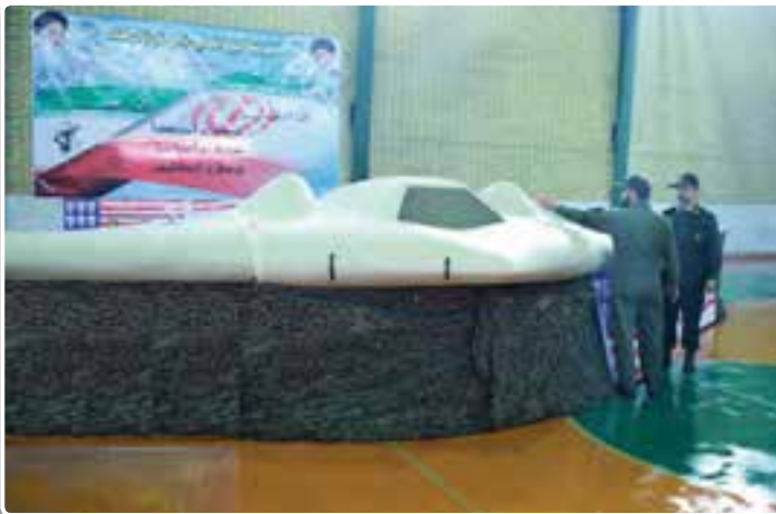
تصویر ۵-۸- هواپیمای بدون سرنشین (بهباد) فوق پیشرفته جاسوسی آمریکا

شکار هواپیمای فوق پیشرفته جاسوسی آمریکا (RQ ۱۷۰) در سال ۱۳۹۰ توسط یگان سایبری سپاه پاسداران با همکاری ارتش جمهوری اسلامی ایران را به عنوان یکی از نمونه‌های اقتدار دفاعی کشور بررسی کنید.