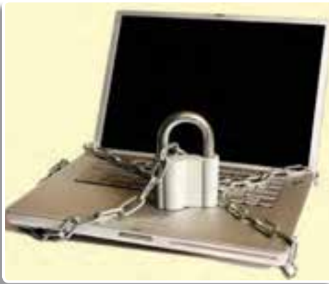
تصویر ۳-۵ - حفاظت از اطلاعات در مقابله با جنگ نرم یک اصل مهم است.

۱- جنگ نرم در پی تغییر هویت و شخصیت جامعه هدف است: در این جنگ، اعتقادات، باورها و ارزش‌های اساسی یک جامعه مورد هجوم قرار می‌گیرد. با تغییر باورهای اساسی جامعه، قالب‌های تفکر و اندیشه دگرگون می‌شود و مدل‌های رفتاری