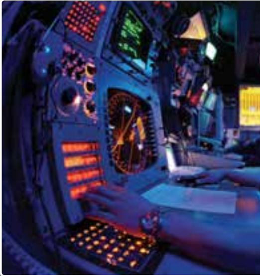
تصویر ۱-۶- یک نمونه از تجهیزات فرماندهی جنگ الکترونیک