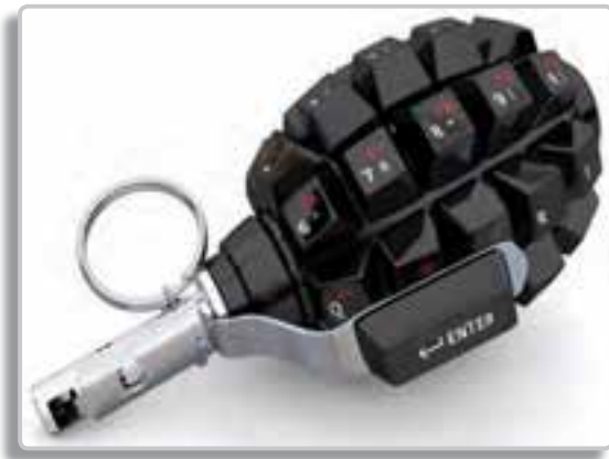
تصویر ۲-۶- فضای سایبر به بازیگران کوچک قدرت غیر واقعی می‌دهد.

در این بخش از درس با فضای سایبر و جنگ سایبری آشنا می‌شویم. به مجموعه‌ای از ارتباطات که از طریق رایانه و وسایل مخابراتی و بدون در نظر گرفتن مکان جغرافیایی برقرار می‌شوند، فضای سایبر گفته می‌شود.