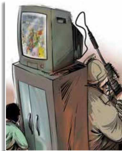
تصویر ۱-۵ - رسانه‌های جمعی یکی از ابزارهای مهم جنگ نرم

جنگ نرم عبارت است از هرگونه اقدام نرم، روانی و تبلیغات رسانه‌ای که جامعه هدف را نشانه گرفته و قصد دارد بدون استفاده از زور و اجبار اهداف خود را محقق کند. جنگ روانی، جنگ سفید، جنگ رسانه‌ای، براندازی نرم، انقلاب مخملی، انقلاب رنگی و... از اشکال مختلف جنگ نرم هستند. جنگ نرم به روحیه، به عنوان یکی از عوامل قدرت ملی