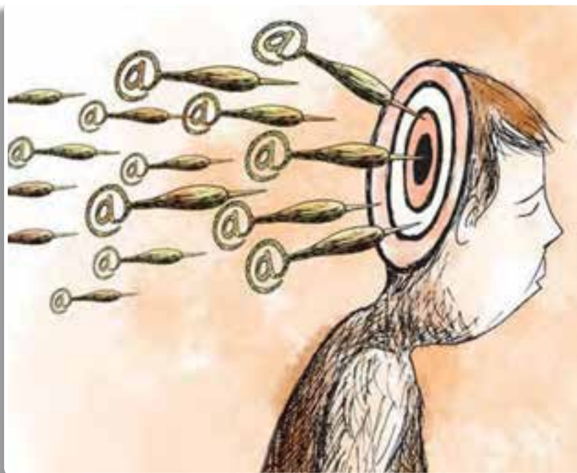
تصویر ۲-۵ - هدف جنگ نرم فکر، مغز و اراده ملت‌هاست.

امروزه با استفاده از فناوری‌های ارتباطاتی مانند شبکه‌های ماهواره‌ای، شبکه‌های اجتماعی مجازی، سایت‌ها، وبلاگ‌ها، تلفن‌های همراه و ... این تأثیرگذاری از سوی آنها راحت‌تر اعمال می‌شود. شیوه عمده این تأثیرگذاری نیز به این صورت است که ابتدا مواردی از اخبار و اطلاعات صحیح را مطرح می‌کنند تا زمینه جلب اعتماد مخاطبان فراهم گردد و آنگاه این اطلاعات صحیح را به عنوان پوشش و چتری به کار می‌گیرند تا در دل آن، چند موضوع خلاف واقع و نادرست را با تفسیرهای موردنظر خود به عنوان کالا و خدمات فکری و فرهنگی به کام مخاطب بریزند.