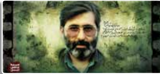
تصویر ۳-۴- شهید سید مرتضی آوینی

شلمچه: منطقه‌ای مرزی در غرب خرمشهر و نزدیک‌ترین نقطه مرزی به شهر بصره در عراق است. شلمچه یکی از مهم‌ترین مناطق عملیاتی در طول هشت سال دفاع مقدس است که عملیات‌های بیت المقدس، رمضان، کربلای ۴، ۵، ۸ و بیت المقدس ۷ در این محور صورت گرفته است. عملیات کربلای ۵ از سخت‌ترین عملیات‌های دفاع مقدس است که طی آن مردان بزرگی چون شهیدان حسین خرازی، یدالله کلهر، اسماعیل دقایقی و حجت الاسلام عبدالله میثمی و ... از این منطقه آسمانی شدند. در یادمان زیبای این محور که توسط آستان قدس رضوی احداث شده ۸ شهید گلگون کفن مدفون هستند.