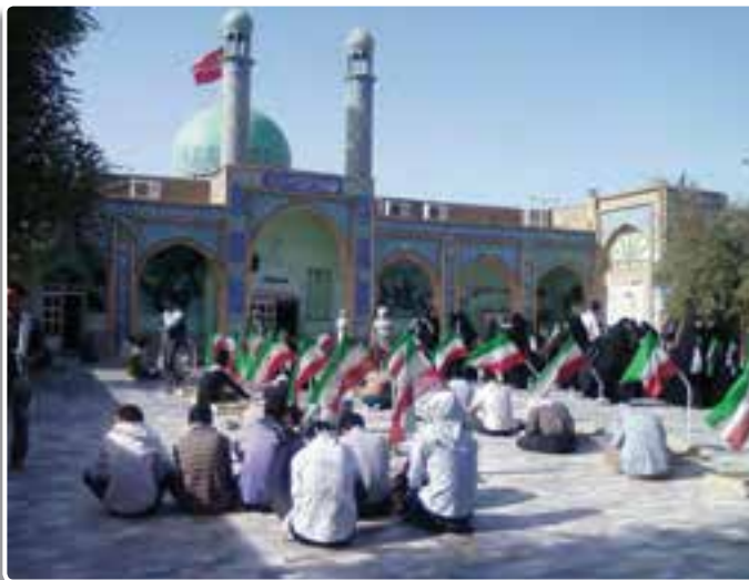
تصویر ۲-۴- حضور دانش‌آموزان در اردوی راهیان نور - یادمان شهدای هویزه