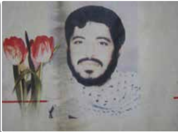
تصویر ۶-۴- شهید سید حسین علم‌الهدی

طلائیه: این منطقه در جنوب غربی دشت آزادگان و روبه‌روی جزایر مجنون قرار دارد. منطقه طلائیه از روزهای اول جنگ مورد تاخت و تاز متجاوزان بعثی عراق قرار گرفت. سه راه شهادت به دلیل فرود بیش از ۸۰۰ هزار گلوله توپ، خمپاره، بمب و تانک دشمن بر سر فرزندان ایران توسط رزمندگان نام‌گذاری شد. عملیات خیبر و بدر در این محور عملیاتی متجاوزان را با شکست سختی مواجه کرد. این منطقه شاهد شهادت مردان بزرگی چون شهیدان محمد ابراهیم همت و حمید باکری است. هوئیزه: این شهر در شمال غربی خوزستان و جنوب غربی سوسنگرد قرار دارد. در زمان اشغال این شهر در اوایل جنگ (مهرماه ۱۳۵۹)، مقاومت دانش‌آموز شهیده سهام خیام، دختر نوجوان اهل هوئیزه در برابر بعثی‌ها باعث خروش مردم شهر و ایستادگی آنها در برابر دشمن شد. در همان زمان عده‌ای از دانشجویان پیرو خط امام به فرماندهی شهید سید حسین علم‌الهدی در کنار مردم این شهر حماسه مقاومت را معنی بخشیدند.