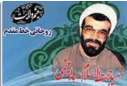
تصویر ۴-۴- شهید حجت الاسلام عبدالله میثمی

شلمچه: منطقه‌ای مرزی در غرب خرمشهر و نزدیک‌ترین نقطه مرزی به شهر بصره در عراق است. شلمچه یکی از مهم‌ترین مناطق عملیاتی در طول هشت سال دفاع مقدس است که عملیات‌های بیت المقدس، رمضان، کربلای ۴، ۵، ۸ و بیت المقدس ۷ در این محور صورت گرفته است. عملیات کربلای ۵ از سخت‌ترین عملیات‌های دفاع مقدس است که طی آن مردان بزرگی چون شهیدان حسین خرازی، یدالله کلهر، اسماعیل دقایقی و حجت الاسلام عبدالله میثمی و ... از این منطقه آسمانی شدند. در یادمان زیبای این محور که توسط آستان قدس رضوی احداث شده ۸ شهید گلگون کفن مدفون هستند.