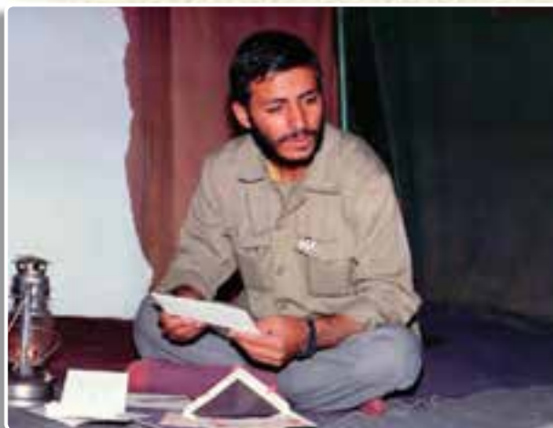
تصویر ۷-۴- شهید همت فرمانده لشکر ۲۷ محمد رسول الله (ص)

«یکی از هم‌زمان سردار شهید حاج محمد ابراهیم همت»