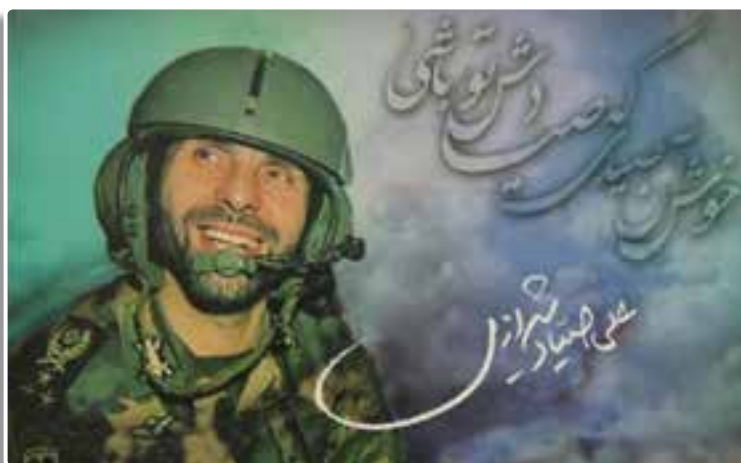
تصویر ۸-۴- شهید علی صیاد شیرازی