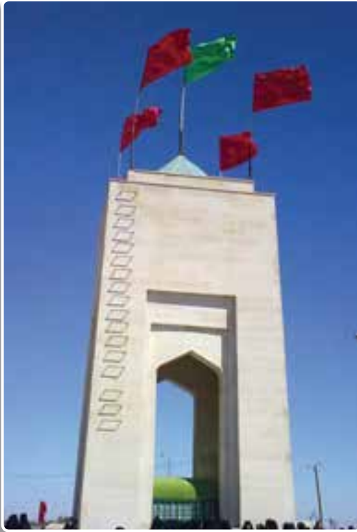
تصویر ۵-۴- یادمان شهدای اروند در منطقه عملیاتی والفجر ۸

از سخنرانی مقام معظم رهبری در شلمچه ۱۳۷۸/۷/۸