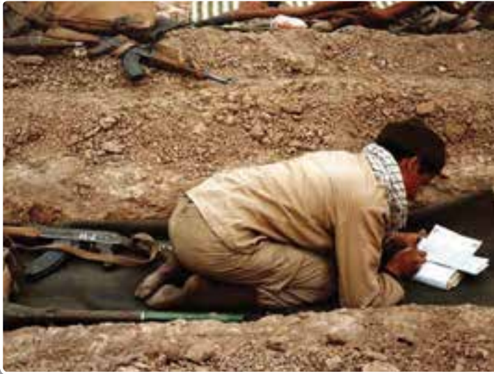
تصویر ۹-۴- یک رزمنده بسیجی در حال نوشتن نامه