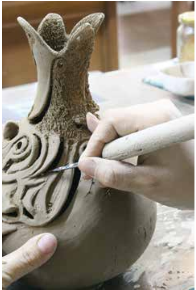
شکل ۱۰-۴ الف - تزئین بدنه‌ی سفالی به روش نقش‌کنده