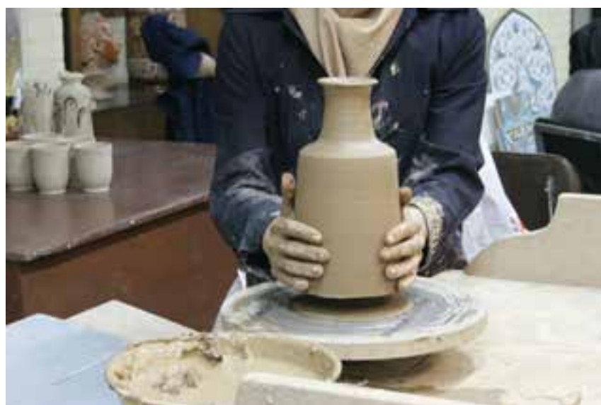
شکل ۸-۴-ی — برداشتن شیء گلی ساخته شده از روی چرخ