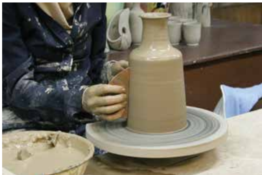
شکل ۸-۴ ح - پرداخت و شکل دادن با ابزار