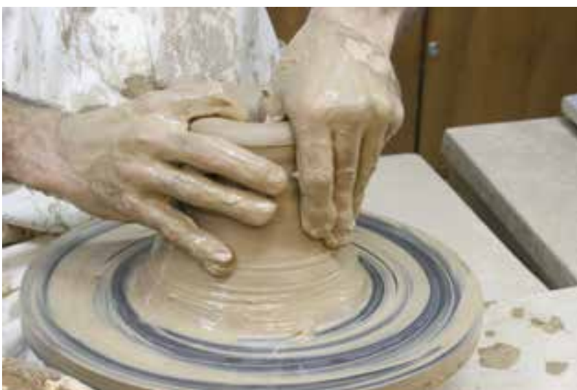
شکل ۸-۴-هـ - بزرگ کردن حفره