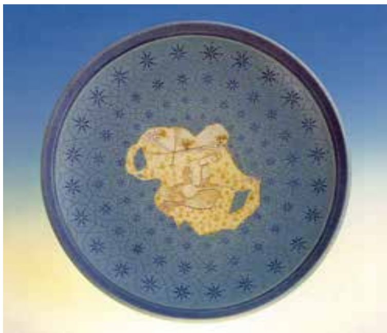
شکل ۱۱-۴-الف - تزئین به روش رو رنگی و زیر رنگی