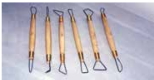
شکل ۴-۶ - برخی از ابزار تزئین بدنه ی گلی - ابزار بردارنده (کاهنده)

۳- ابزار و وسایل تزئین: در مرحله ی تزئین بدنه ها از ابزارهایی مانند صفحه گردان رومیزی، ابزار بردارنده (کاهنده)، تراش دهنده، برش دهنده، کاسه، اسفنج، رنگ پاش، قلم مو، تخته شستی، خط کش، مداد و پرگار، استفاده می شود (شکل ۴-۶).