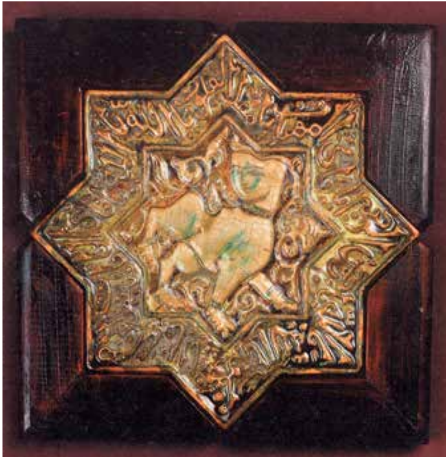
شکل ۹-۴- خشت شکل داده شده به روش فشاری در قالب

یادآوری: برای ساخت برخی از اشیای سفالی می‌توان از یک یا چند روش شکل‌دهی استفاده کرد که به آن «شکل‌دهی ترکیبی» می‌گویند.