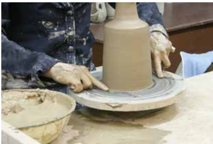
شکل ۸-۴-ط — بریدن ظرف ساخته شده با سیم یا نخ از روی صفحه