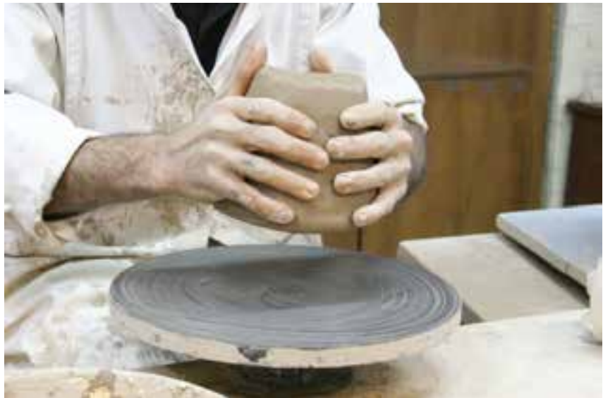
شکل ۸-۴- الف- قرار دادن چانه بر مرکز صفحه‌ی چرخ

۲-۹- شیء را به تدریج خشک می‌کنند و سپس در کوره می‌پزند (شکل ۸-۴).