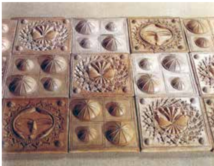
شکل ۴-۲ الف - خشت‌های نقش برجسته سفالی قالبی

هدف و کاربرد: گروهی از آثار سفالینه همواره ظروف مناسبی برای نگهداری مواد خوراکی بوده‌اند و گروهی دیگر به