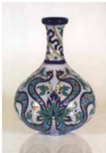
شکل ۱۲-۴- تزیین به روش هفت رنگ

– اگر اطراف طرح و نقش‌ها را بر روی بدنه‌ی سفال با رنگ سیاه قلم‌گیری کنند و سپس با لعاب‌های متفاوت داخل آن‌ها را رنگ‌آمیزی کرده و در کوره بپزند به این روش تزیین «هفت‌رنگی» می‌گویند (شکل ۱۲-۴).