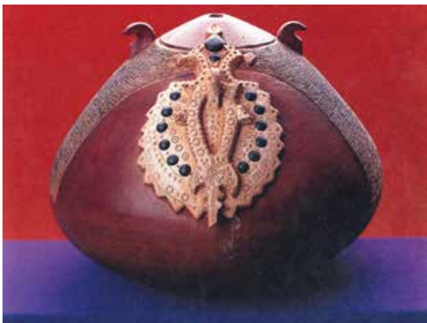
شکل ۳-۴-ج- شیء سفالی با نقوش برجسته