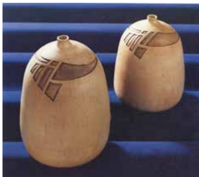
شکل ۴-۲ ج - ظروف سفالی