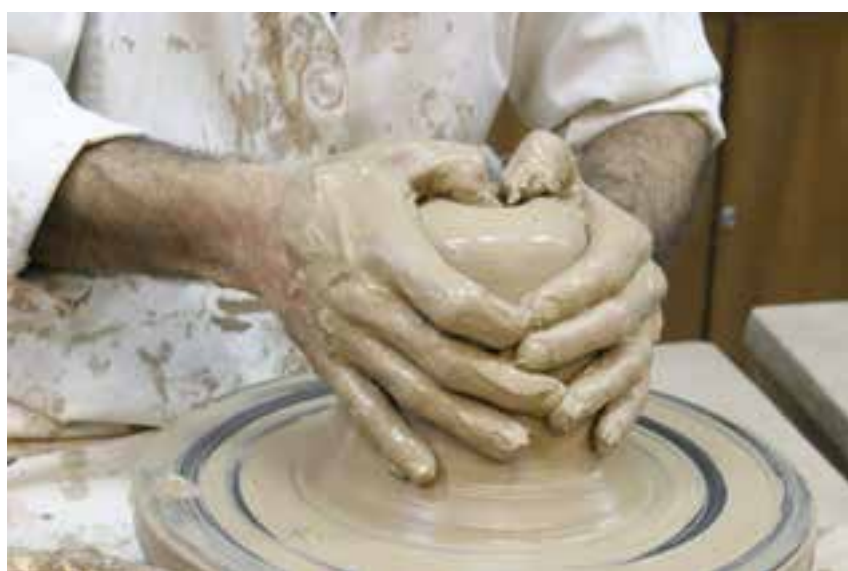
شکل ۸-۴-د - ایجاد حفره اولیه