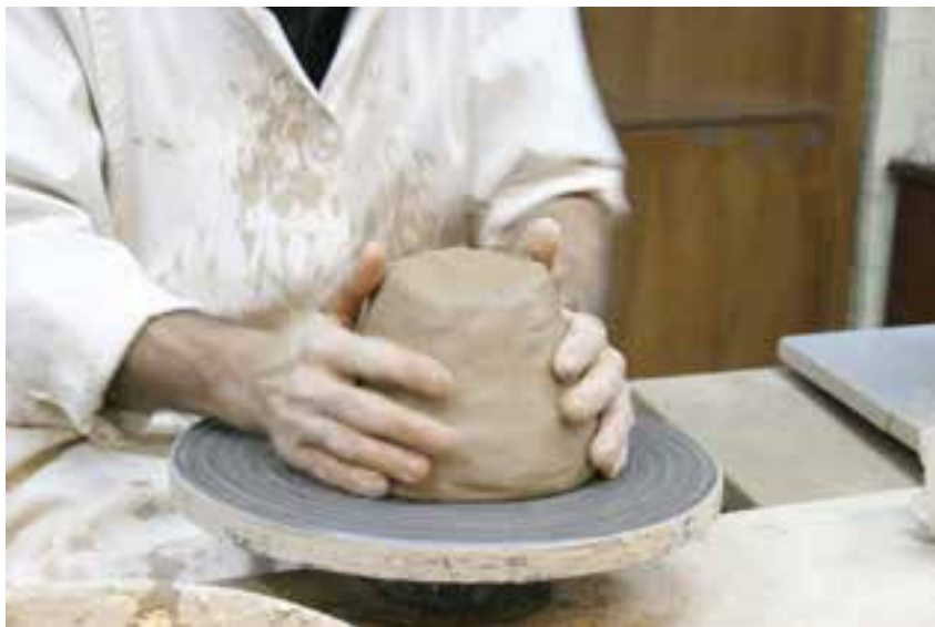
شکل ۸-۴- ب- محکم کردن چانه بر مرکز صفحه