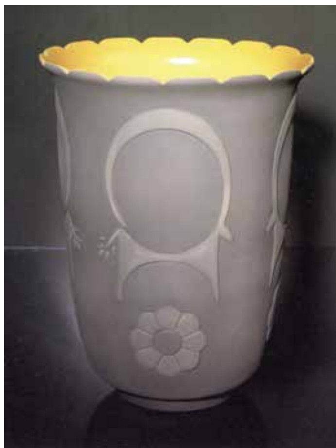
شکل ۱۱-۴-ب - تزئین به روش یک رنگ