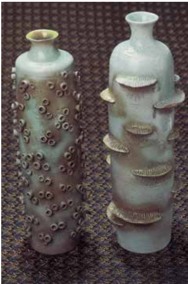
شکل ۱۰-۴ ب - تزئین بدنه‌ی سفالی به روش نقش افزوده

۱-۲- شیوه‌ی نقش‌افزوده: قطعه‌ای از خمیر گل را مطابق طرح روی بدنه‌ی خام (پیش از خشک شدن) می‌افزایند (شکل ۱۰-۴-ب).