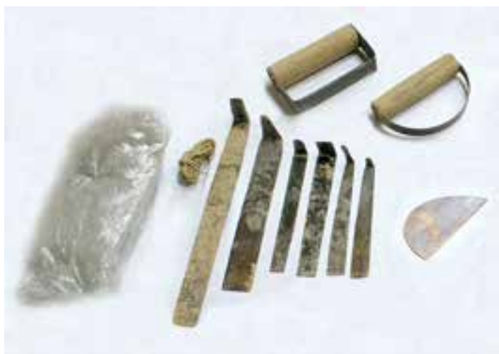
شکل ۴-۵ - ابزار و وسایل شکل دهی بدنه ی گلی

۲- ابزار و وسایل شکل دهی بدنه: چرخ سفالگری (پایی یا برقی)، میز کار، ورقه های فلزی شکل دهنده، تراش دهنده و سایر ابزار جانبی مانند کاردک، اسفنج، سوزن (یا درفش)، مفتول سیمی، وردنه و ورقه یا کیسه ی نایلون از جمله ابزار و وسایل شکل دهی بدنه سفال می باشند (شکل ۴-۵).