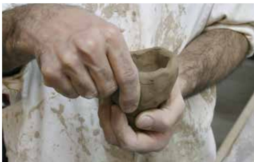
شکل ۷-۴-ب - شکل دادن گل با کمک دست به روش فشاری