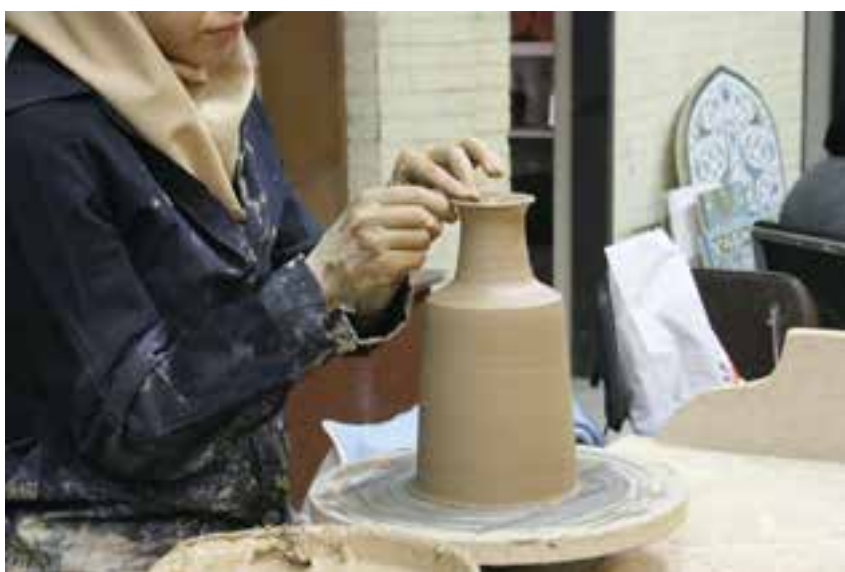
شکل ۸-۴ ز - شکل دادن لبه