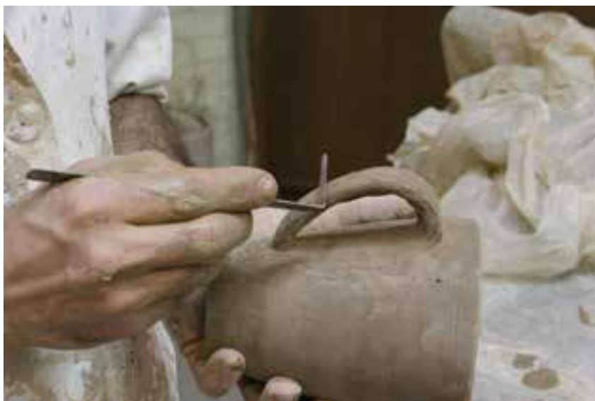
شکل ۸-۴-ک — اضافه کردن اجزای دیگر (لوله، دسته و ...)