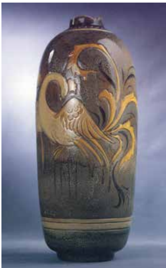
شکل ۱۱-۴ ج- تزیین به روش زیر رنگی

– اگر اطراف طرح و نقش‌ها را بر روی بدنه‌ی سفال با رنگ سیاه قلم‌گیری کنند و سپس با لعاب‌های متفاوت داخل آن‌ها را رنگ‌آمیزی کرده و در کوره بپزند به این روش تزیین «هفت‌رنگی» می‌گویند (شکل ۱۲-۴).