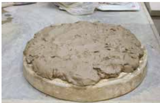
شکل ۴-۴ - صفحه ی چوبی و کاربرد آن در آماده سازی گل

آماده سازی خاک و گل نیاز به ابزار و وسایلی مانند : سطل، بیلچه، کاردک، گونی، پتک، صفحه ی چوبی، میز کار، لیسه، ظروف پلاستیکی، الک و ورقه نایلونی است (شکل ۴-۴).