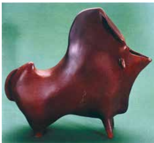
شکل ۴-۲ ب - پیکره سفالی