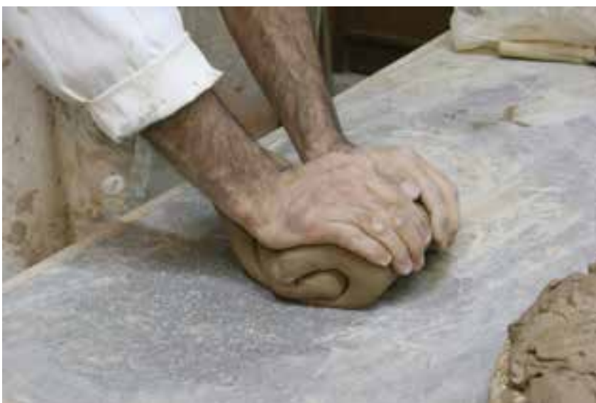
شکل ۷-۴-الف - ورز دادن گل