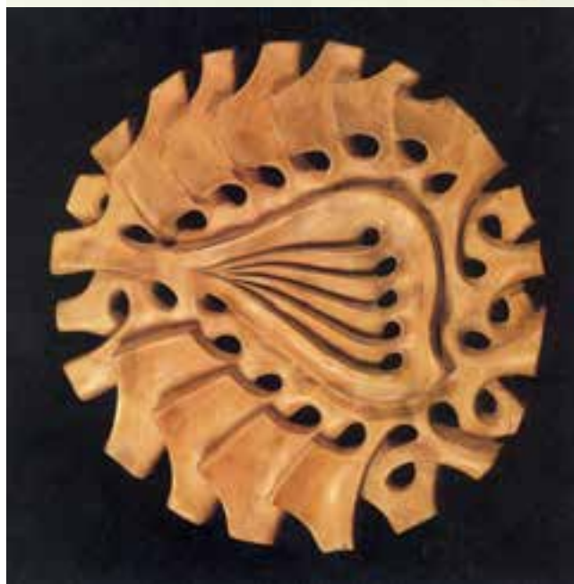
شکل ۳-۴- ب - اشیای سفالی دست‌ساز