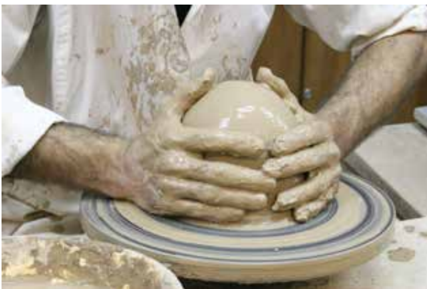
شکل ۸-۴-ج - هم مرکز کردن چانه با صفحه‌ی چرخ