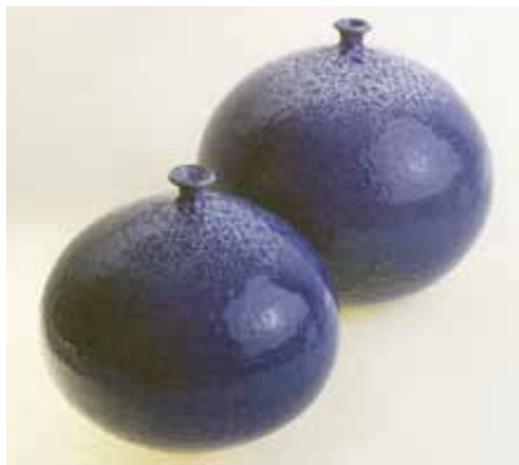
شکل ۳-۴- الف - اشیای سفالی مدور و قرینه (چرخ ساز)

بدنه‌های سفالی به صورت خام و یا پخته، هر کدام دارای ویژگی خاصی برای تزیین هستند. نقوش برجسته (سه بعدی)