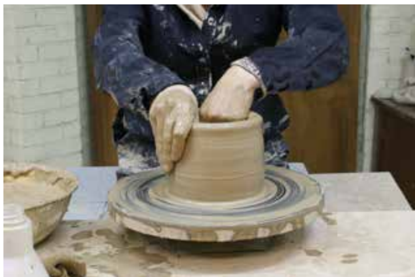
شکل ۸-۴ و - شکل دادن دیواره