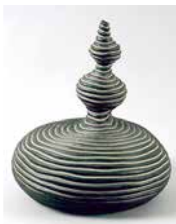
شکل ۷-۴-ج - شیء دست ساز به روش فتیله ای