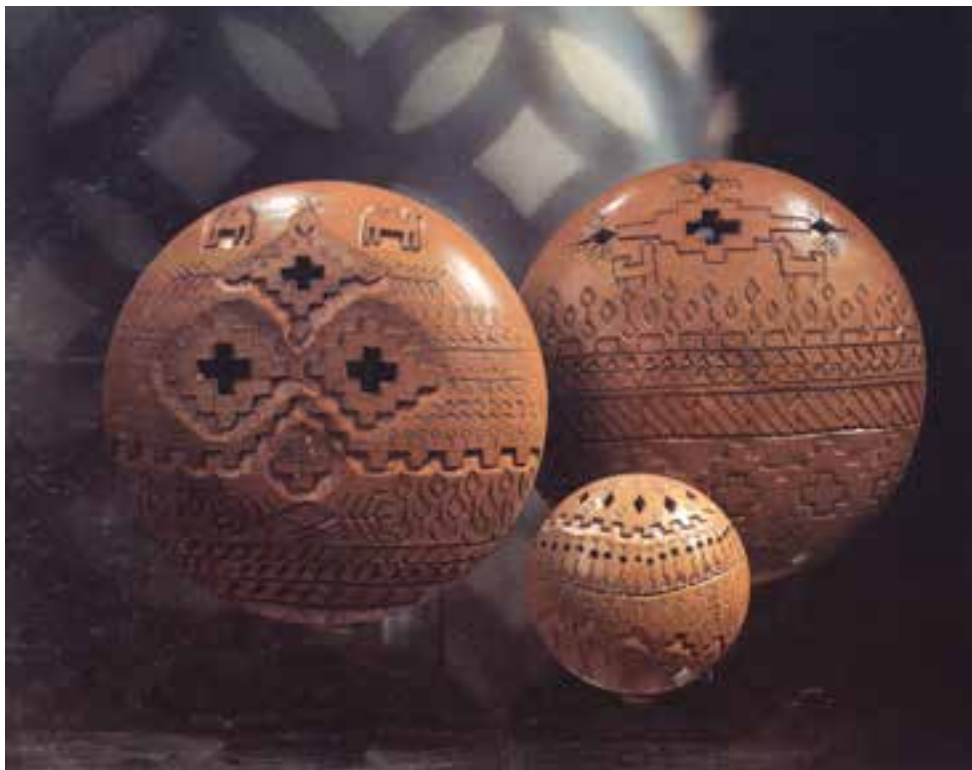
شکل ۱۰-۴-ج - تزئین بدنه ی سفالی به روش نقش بریده

۱-۳ - شیوهی نقش بریده: پیش از خشک شدن بدنه (چرمینه) قسمتی از بدنه را مطابق طرح بریده و جدا می کنند به گونه ای که زمینه ی شیء مشبک شود (شکل ۱۰-۴-ج).