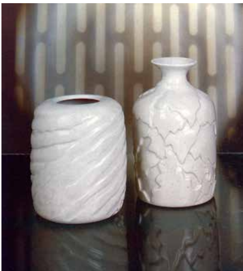
شکل ۳-۴-د- ظروف با نقش کنده و لعاب یکرنگ