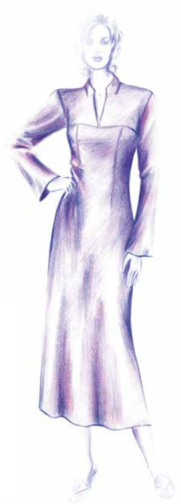
تصویر ۸-۴ - رنگ آمیزی به طریق پوشش دادن یک رنگ با رنگ همجوارش