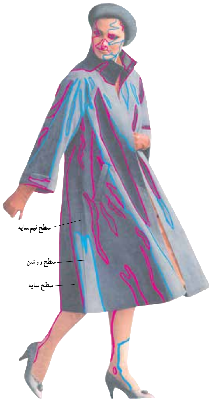
تصویر ۳-۴ - در تصویر محدوده‌ی نیم‌سایه با رنگ آبی و محدوده‌ی سایه با رنگ قرمز مشخص شده است.

○ پس از فراگیری مطالب تمرین ۱ را انجام دهید.