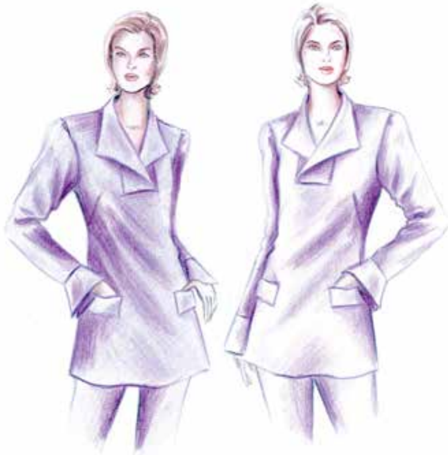
تصویر ۱-۴ — معرفی سطوح روشن با در نظر گرفتن سفیدی کاغذ در تصویر سمت راست و لایه‌ی رنگی روشن در تصویر سمت چپ

در طراحی از طبیعت و اجسام بی‌جان، نور در ایجاد سایه‌ها و پیدایش حجم اجسام، نقش اساسی دارد. طراحان و نقاشان، برای به تصویر کشیدن فضاهایی کاملاً طبیعی و واقعی، با قرار دادن سوژه در مقابل نور و نورپردازی مؤثر شرایط محیطی مناسبی را فراهم می‌سازند که موجب حضور فیزیکی و قابل لمس اجسام شده، طرح را به شکل طبیعی و واقعی نشان می‌دهد. در این میان، طراحان لباس نیز با به کارگیری عنصر نور و سایه، در ساخت تکنیک‌های متفاوت طراحی لباس توانسته‌اند شیوه‌های بسیار جالبی را به نمایش بگذارند. اما آنچه که بیش از هر چیزی، برای طراحان لباس اهمیت دارد استفاده از نور در ایجاد حجم صحیحی از بدن و نمایش انعطاف پارچه و لباس است.