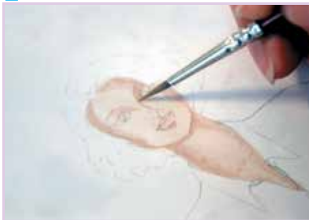
تیره نمودن محدوده‌ی نیم سایه با درجه‌ی تیره‌تری از رنگ پوست و قلم‌موی نمره‌ی ۳