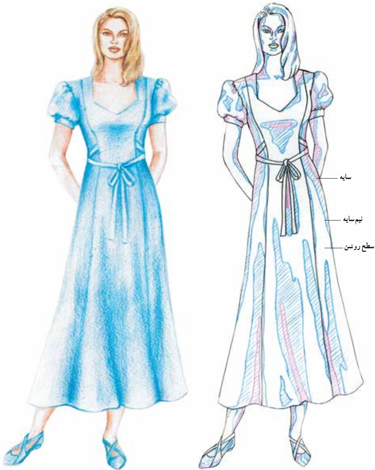
تصویر ۴-۴ - نمایش سطوح روشن - نیم سایه و سایه بر روی یک طرح (در تصویر محدوده‌ی نیم سایه با رنگ آبی و محدوده‌ی سایه با رنگ قرمز مشخص شده است.)