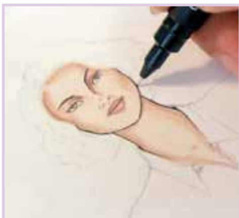
محکم نمودن خطوط با روان‌نویس