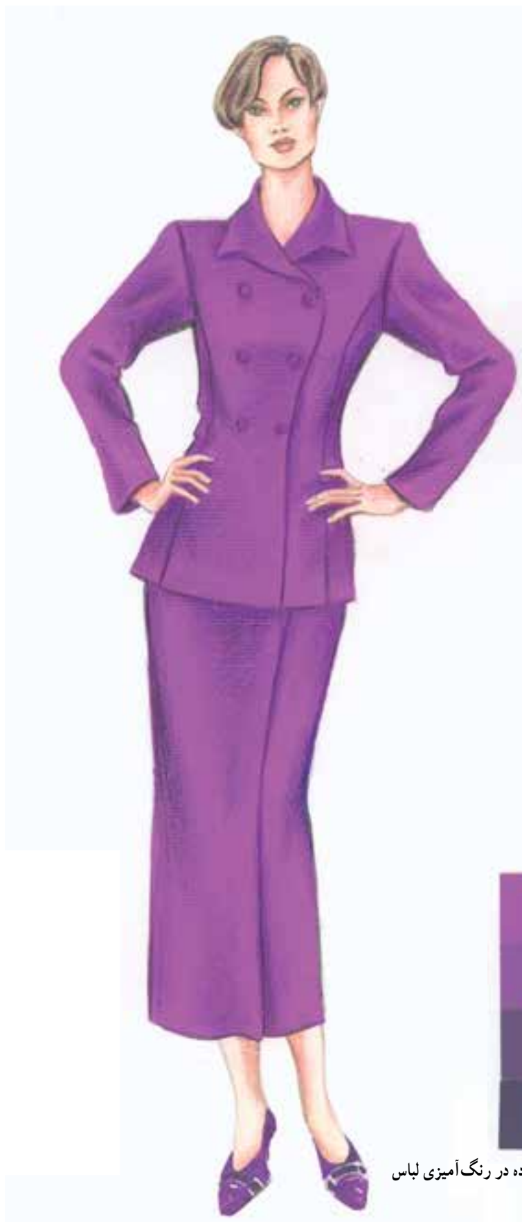
نوار رنگ‌های مورد استفاده در رنگ‌آمیزی لباس

تصویر ۱۳-۴ - یک طرح رنگ‌آمیزی شده با تکنیک (تونالیته) بدوسیله‌ی گواش - مداد رنگی