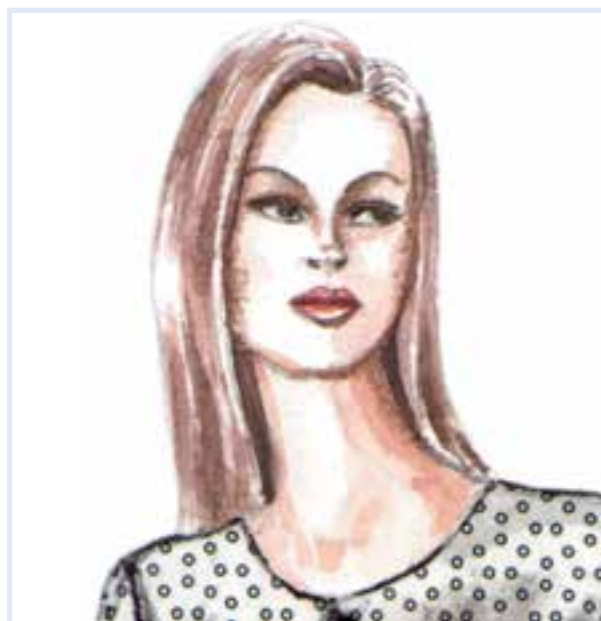
تصویر ۱۱-۴ — نمایش سایه روشن‌های مو و چهره با در نظر گرفتن سفیدی متن به وسیله‌ی گواش رقیق شده