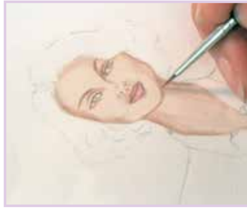
طراحی خطوط ظریف چهره و تیره نمودن محدوده‌های سایه با قلم‌موی نمره‌ی ۱