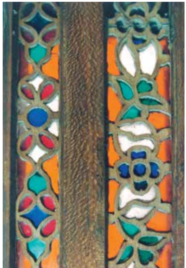
تصویر ۱-۱-۳- پارچه‌بری نصب شده در کنارهٔ یک در

از رشته‌های زیرمجموعهٔ شبکه‌بری می‌توان به پارچه‌بری اشاره نمود در این فن دو لایه چوب به‌طور مشابه شبکه‌بری می‌شوند و در بین آنها قطعاتی از شیشه رنگی نصب می‌گردد (تصویر ۱-۱-۳).