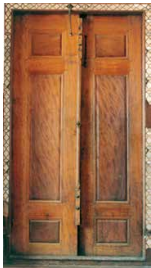
تصویر ۷-۱-۱- یک در قاب تنگه

تصویر ۶-۱-۱- گره چینی آلت و لقط در پایین یک در از جمله رشته‌های زیرمجموعه این فن می‌توان به «قاب تنگه» اشاره نمود که چیزی بین گره چینی آلت و لقط و درودگری است و در آن یک وسیله کاربردی به قابهایی تقسیم می‌شود و سپس درون این قابها با صفحات چوبی پُر می‌شود (تصویر ۷-۱-۱).