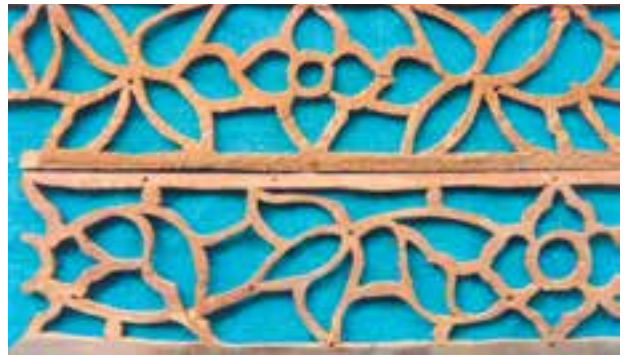
تصویر ۱-۱-۲- شبکه‌بری با نقش ختایی

از رشته‌های زیرمجموعهٔ شبکه‌بری می‌توان به پارچه‌بری اشاره نمود در این فن دو لایه چوب به‌طور مشابه شبکه‌بری می‌شوند و در بین آنها قطعاتی از شیشه رنگی نصب می‌گردد (تصویر ۱-۱-۳).