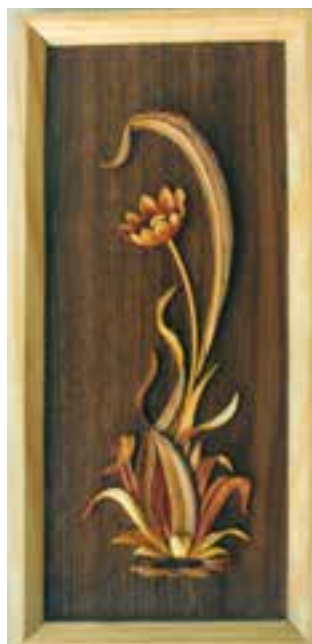
تصویر ۱۷-۱-۱ یک تابلو معرق منبت

مقرنس‌سازی چوبی را می‌توان حدّ واسط قطع‌کاری و درودگری و کنده‌کاری دانست در این هنر، قطعات چوبی به شکل منشور آماده می‌شود به نحوی که یک سر این منشورها به شکل هندسی خاص تراش می‌خورد سپس این منشورها به نحوی منظم در کنار هم چسبانیده یا میخ‌کوبی می‌شوند تا احجام منظم و تکراری و هندسی پدید آید (تصویر ۱۸-۱-۱).