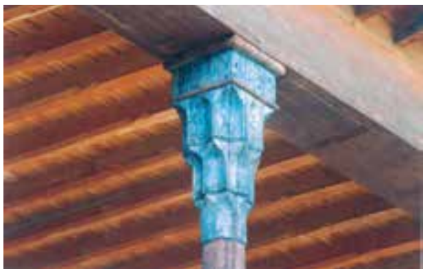
تصویر ۱۸-۱-۱ مقرنس چوبی اجرا شده در یک سرستون دوره صفوی

مقرنس‌سازی چوبی را می‌توان حدّ واسط قطع‌کاری و درودگری و کنده‌کاری دانست در این هنر، قطعات چوبی به شکل منشور آماده می‌شود به نحوی که یک سر این منشورها به شکل هندسی خاص تراش می‌خورد سپس این منشورها به نحوی منظم در کنار هم چسبانیده یا میخ‌کوبی می‌شوند تا احجام منظم و تکراری و هندسی پدید آید (تصویر ۱۸-۱-۱).