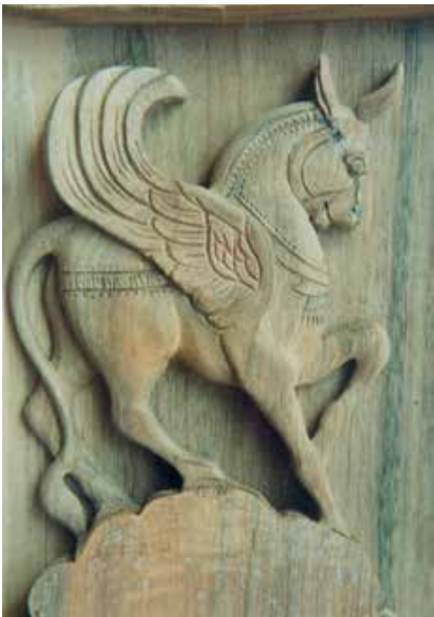
تصویر ۹-۱-۱- قسمتی از یک منبت کاری جدید

۴- کنده کاری: عبارت است از تراش قسمتهایی از چوب براساس طرح مورد نظر و به حجم مورد نظر: منبت کاری که زیرمجموعه این بخش است عبارت است از نوعی کنده کاری غیرهمگن براساس طرح برای رسیدن به نقش برجسته مورد نظر (تصویر ۹-۱-۱).