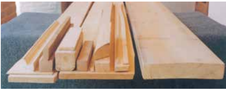
تصویر ۲۱-۱-۱- یک تخته و نمونه‌هایی از پروفیل‌های آن

پروفیل‌ها ممکن است برای ساخت زیرساخت و یا برای اجرای بخش تزئینی بکار روند.