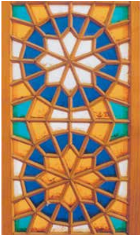
تصویر ۱-۱-۵- گره چینی شیشه‌دار که در حاشیه یک پنجره نصب شده است.

از رشته‌های زیرمجموعهٔ گره چینی می‌توان به گره چینی شیشه‌دار اشاره نمود که در آن بین آلتها شیشه رنگی نصب می‌گردد (تصویر ۱-۱-۵).