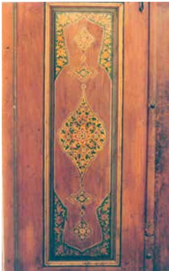
تصویر ۲۰-۱-۱- نقاشی و تذهیب در روی یک در چوبی

است. براساس همین اصل رشته‌های هنری چوبی به دو گروه کلی «الحاقی» و «غیرالحاقی» تقسیم می‌شوند، در رشته‌های غیرالحاقی قسمت تزینی، خود بخشی از زیرساخت است (مثل منبت کاری) ولی در رشته‌های الحاقی قسمت تزینی به‌روی زیرساخت اضافه می‌شود (مثل خاتم کاری). رشته‌های صنایع دستی چوبی غیرالحاقی عبارتند از: مشبک بری، پارچه‌بری، گره چینی مشبک، گره چینی شیشه‌دار، گره چینی آلت و لقطه، قاب تنکه، قواره‌بری، منبت کاری، خراطی، ابزارزنی، مجسمه‌سازی، مهرسازی، سبدبافی، حصیربافی، سازسازی.