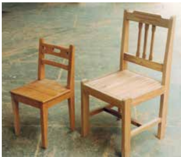
تصویر ۱-۱-۱- محصولات درودگری - دو نمونه صندلی با تزئینات جزئی

۱- درودگری: فن ساخت وسایل یا زیر ساختهای کاربردی یا کاربردی تزئینی است. وسایل چوبی از قبیل میز، صندلی، کمد، جعبه، در و ... محصولات درودگری هستند (تصویر ۱-۱-۱).