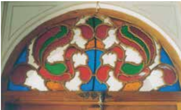
تصویر ۸-۱-۱- قواره‌بری یا اسلیمی بُری در بالای یک در

قواره‌بری که گاهی به آن اسلیمی بُری نیز می‌گویند نوعی گره چینی است که براساس طرح غیرهندسی انجام می‌گیرد (تصویر ۸-۱-۱).