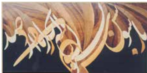
تصویر ۱۶-۱-۱ یک تابلو معرق معاصر

۶- قطعه‌کاری چوبی: به گروهی از رشته‌های صنایع دستی چوبی گفته می‌شود که براساس طرح اولیه قطعات بخش‌تزیینی که عمدتاً چوبی هستند آماده و سپس این قطعات براساس همان طرح به وسیله روشهایی مثل چسبانیدن و میخ‌کوبی به روی زیرساخت الحاق می‌شوند. معرق چوب از زیرمجموعه‌های این گروه است و گرچه شیوه‌های مختلفی دارد ولی در یک تعریف کلی و کوتاه می‌توان گفت: عبارت است از برش قطعاتی از لایه‌های نازک عمدتاً چوبی هم ضخامت براساس طرح و سپس چسباندن یا تعبیه آنها به روی زیرساخت در جای خود براساس همان طرح (تصویر ۱۶-۱-۱).