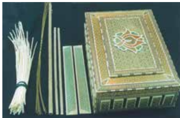
تصویر ۱۹-۱-۱- یک محصول خاتم کاری جدید به همراه مصالح اولیه و نمونه‌های گل پیچیده شده و چند نمونه لایه خاتم.

مشابه بدست آورد. خاتم مثلث که امروزه متداول‌تر است به شیوه‌ای به نام (گل‌بندی) اجرا می‌شود به این نحو که در مرحله اول منشورهایی مثلث‌القاعده از جنس چوب، فلز و استخوان آماده می‌شود. در مرحله دوم، این منشورها براساس طرح هندسی مورد نظر از پهلو کنار هم چسبانیده می‌شوند تا شش ضلعیها و مثلثهای بزرگ‌تری موسوم به «گل» و «توگلو» پدید آید (به این کار گل‌بندی گویند)، بر اثر کنار هم چسباندن گلها و توگلوها از پهلو به هم، مکعب مستطیل بزرگی پدید می‌آید که نقش هندسی در رأس آن پیداست و به آن «قامه» می‌گویند. حال با برش مقطعی قامه، لایه خاتم بدست می‌آید که در مرحله سوم خاتم کاری می‌توان این لایه‌ها را به‌روی زیرساخت مورد نظر چسباند (تصویر ۱۹-۱-۱).