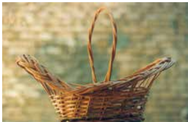
تصویر ۱۵-۱-۱ یک نمونه ظرف ساده سبببافی

سبد بافی نیز که به وسیله بافت شاخه‌های باریک چوبی و مروار و خیزران و غیره انجام می‌شود جزو این گروه است (تصویر ۱۵-۱-۱).