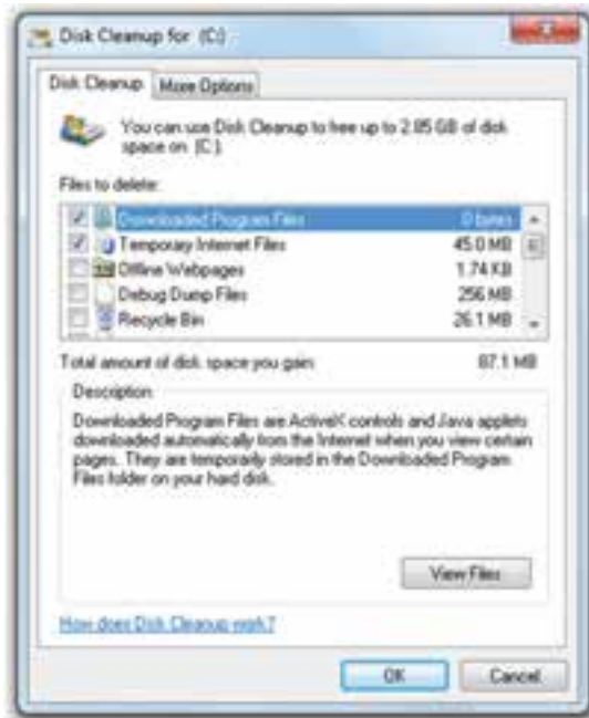
شکل ۶-۲- انتخاب نوع عملیات در پاک‌سازی

۲- در این مرحله، کادری مشابه شکل ۶-۲ نمایش داده می‌شود. هم‌اکنون باید نوع عملی که در پاک‌سازی انجام می‌شود را با علامت‌زدن انتخاب کنید.