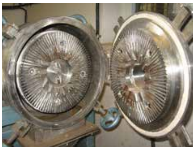
شکل ۸۰-۱- الف - صفحه‌ی پالاینده