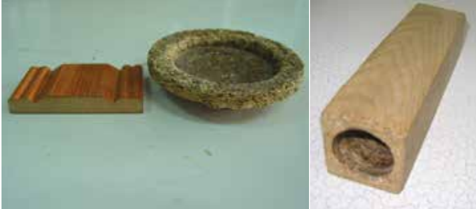
شکل ۷۹-۱- نمونه‌هایی از فرآورده‌های قالبی چوب