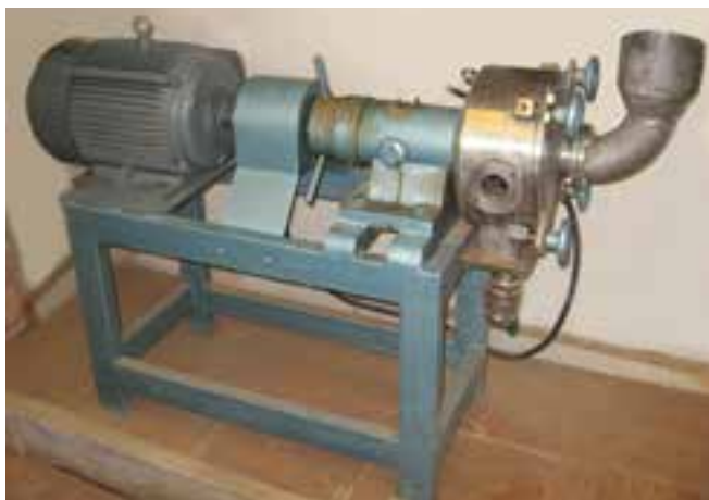
ب- یک دستگاه پالاینده‌ی آزمایشگاهی