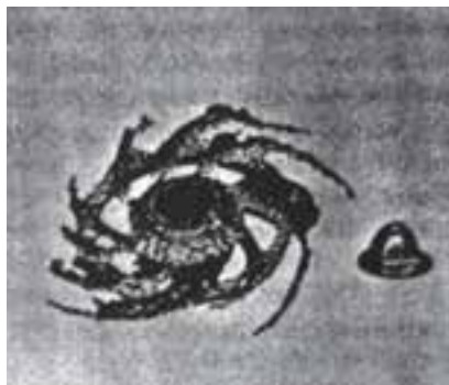
شکل ۲-۹- خوردگی سایشی پروانه‌ای از جنس فولاد زنگ‌نزن در یک نوع پمپ.

این قطعات، قطعه‌ی ثابت و سیال متحرک است که با سرعت زیاد در لوله جریان دارد و باعث خوردگی می‌شود.