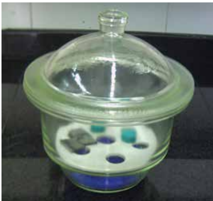
شکل ۷-۱- دسیکاتور