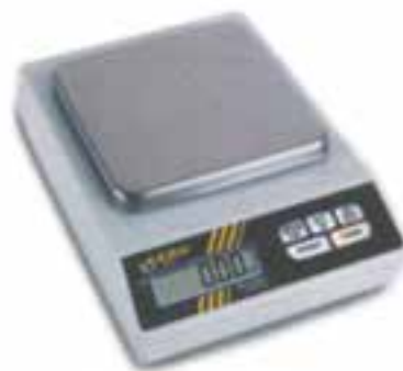
شکل ۱-۲- ترازوی الکتریکی