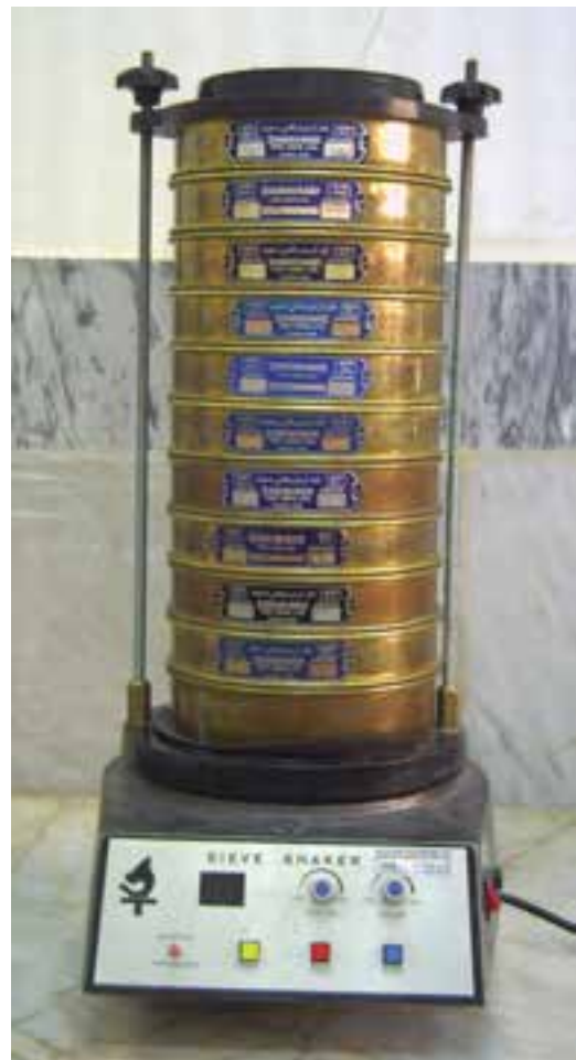
شکل ۱-۱- دستگاه لرزان آزمایشگاهی سری الک‌های استاندارد

۴- معمولاً دارای حداقل شش عدد الک با مش‌های مختلف و یک عدد درپوش و یک عدد کفه‌ی تحتانی (شکل ۱-۱).