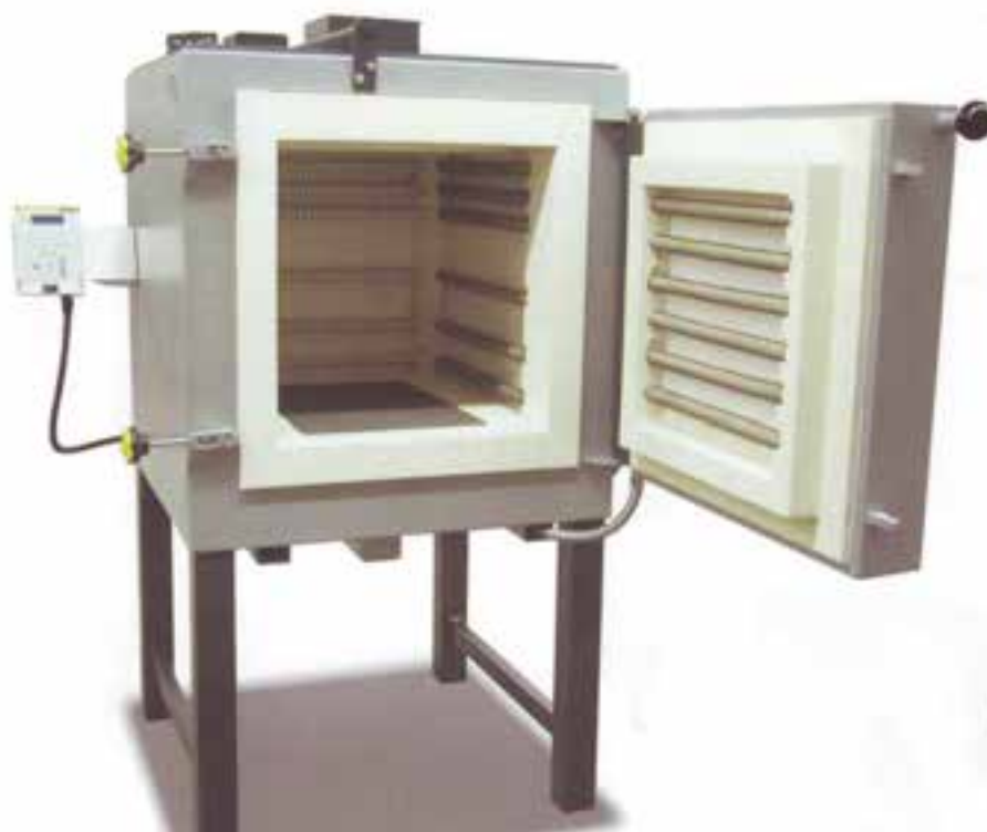
شکل ۶-۱- کوره‌ی خشک‌کن الکتریکی

رطوبت عبارت است از آب موجود در ماسه به میزان ۱/۵ تا ۸ درصد که با حضور خاک رس باعث بالا رفتن خاصیت شکل‌پذیری ۱ (پلاستیسیته) و استحکام‌تر ۲ ماسه می‌شود. خاک رس آب و رطوبت ماسه را جذب می‌کند و به حد اشباع می‌رسد،