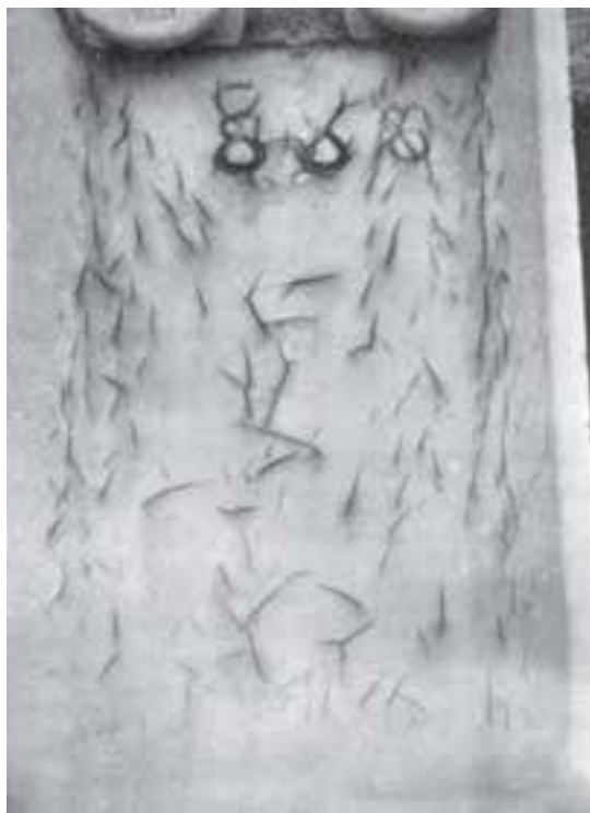
شکل ۶-۶ - پدیده‌ی ترک خوردگی فیلم