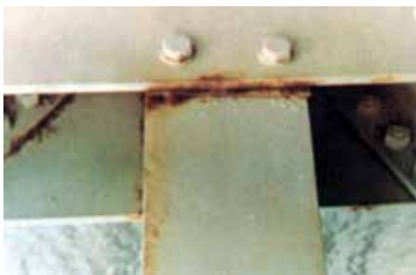
شکل ۶-۴ - آسیب دیدگی در قسمت درزهای محل اتصال