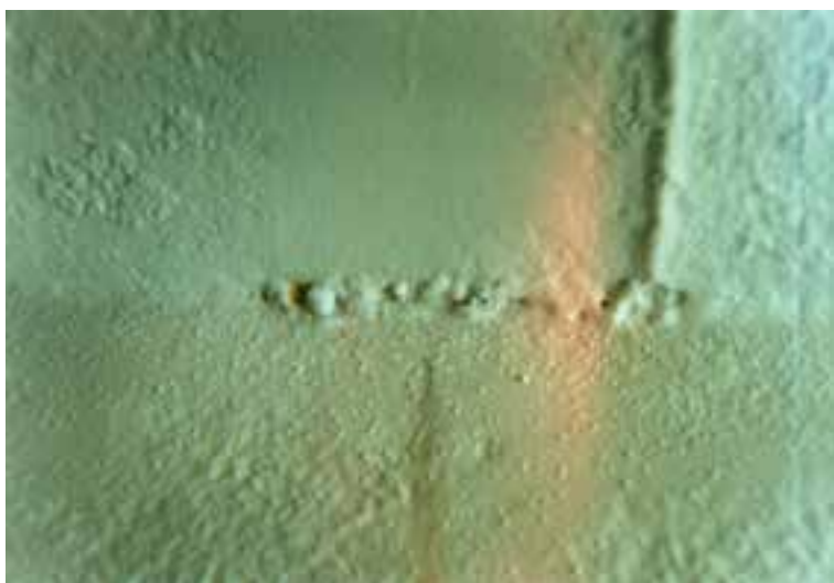
شکل ۶-۳ - جوش کاری و آماده سازی نامناسب

می‌بایست قبل از رنگ آمیزی صورت گیرد. شکل‌های ۶-۳، ۶-۴ و ۶-۵ سه مورد از آماده‌سازی نامناسب را نشان می‌دهد.