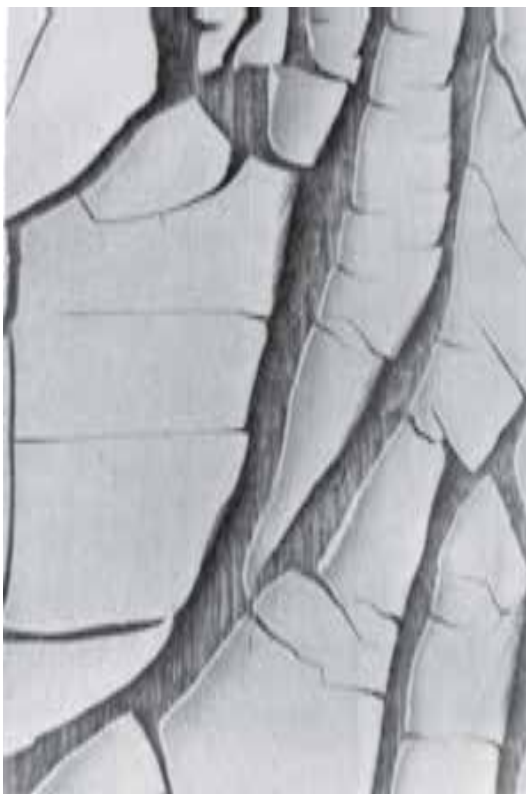
شکل ۹-۶ - پدیده‌ی پوسته‌ای شدن