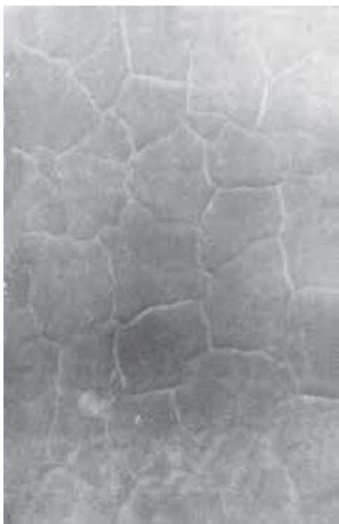
شکل ۷-۶ - پدیده‌ی پوست سوسماری شدن فیلم