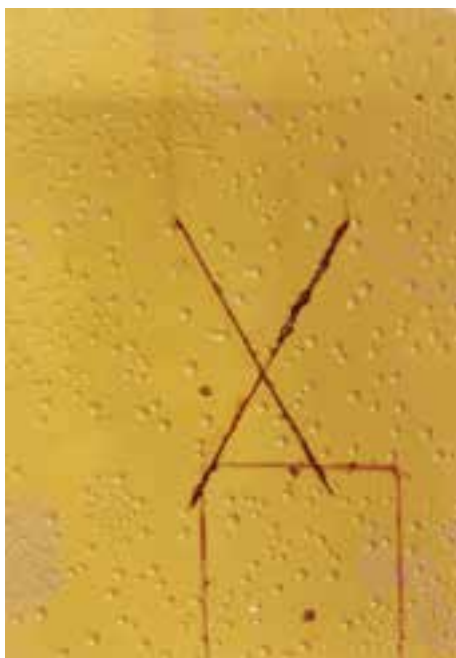
شکل ۱-۶- تاول‌زدگی (عدم مقاومت فیلم در محیط رطوبتی)