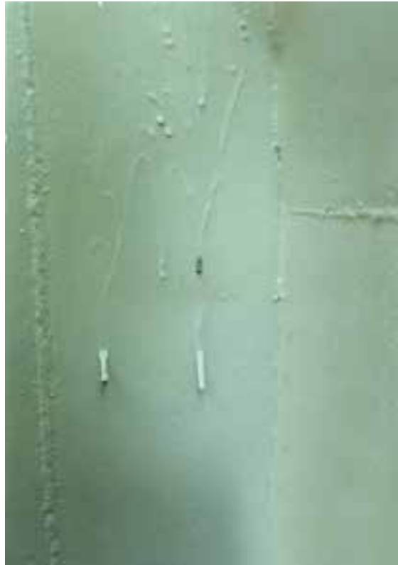
شکل ۸-۶ - پدیده‌ی شُرهِ کردن