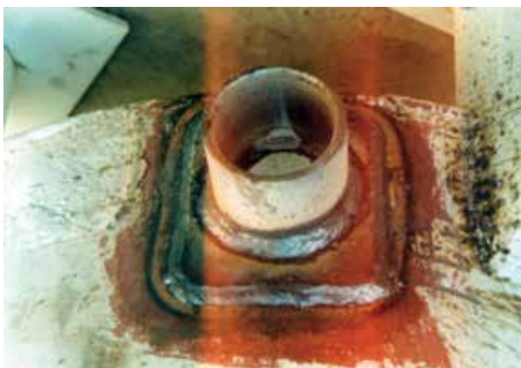
شکل ۶-۵ - جوش کاری پس از رنگ زدن