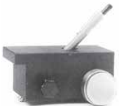
ب - سختی‌سنج مدادی

روش دیگری که برای تعیین سختی در آزمایشگاه‌های مجهز بکار می‌رود استفاده از آونگ‌های مخصوص است. در این روش سختی رنگ با استفاده از خاصیت تلف‌شدن انرژی در اثر نوسان آونگ مشخص می‌شود. طریقه‌ی تنظیم دستگاه و نحوه‌ی آزمایش در بروشورهای مربوطه منعکس شده است.