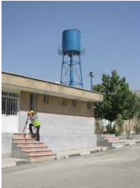
شکل ۹-۱. اختلاف ارتفاع چه قدر است؟