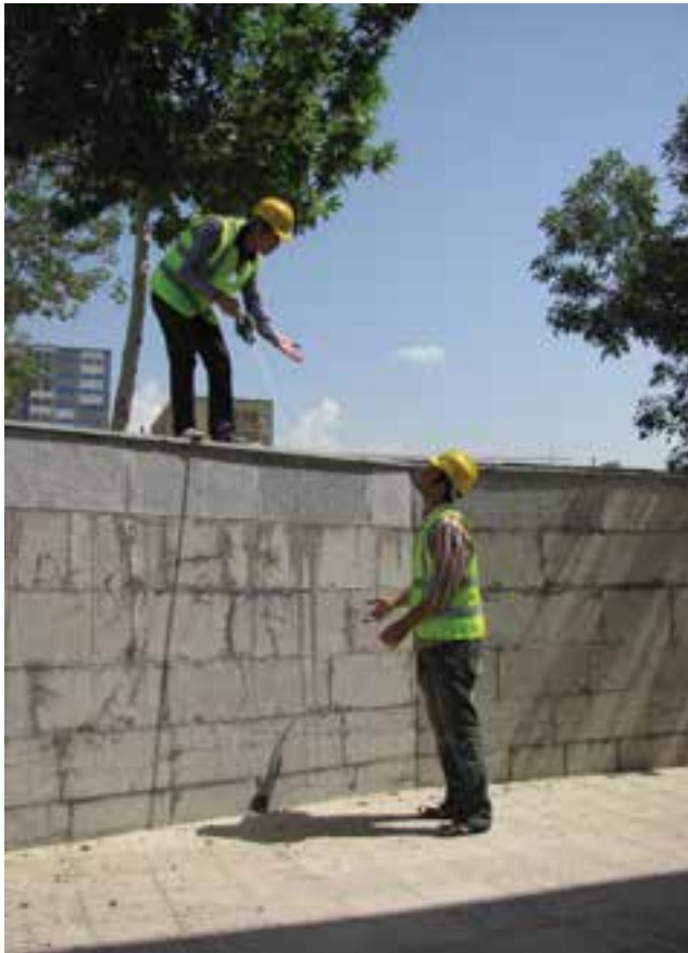
شکل ۹ - ۲. اختلاف ارتفاع چه قدر است؟

منظور از ارتفاع، اختلاف ارتفاع بالا تا پایین عارضه است. مثلاً بالا تا پایین پله