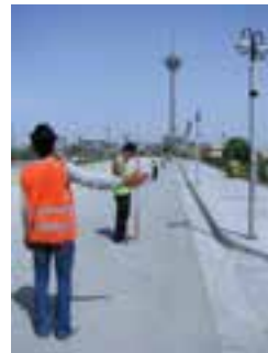
ژالن را به طرف راست ببر