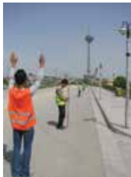
حالت ژالن خوب است