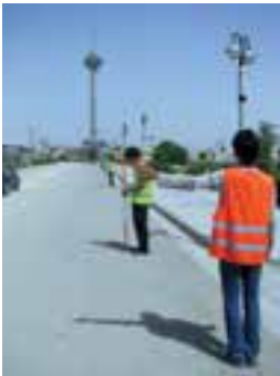
ژالن را به طرف چپ ببر

وقتی فاصله بین افرادی که عمل ژالن‌گذاری را انجام می‌دهند زیاد باشد، دیگر صدا رسا به گوش نمی‌رسد در این حالت معمولاً با علامت دادن دست می‌توان منظور خود را به دیگری فهماند. در این گونه موارد می‌توان با توجه به استفاده از علائم مانند شکل‌های راهنمای زیر عمل کرد (شکل ۴-۳). ✓