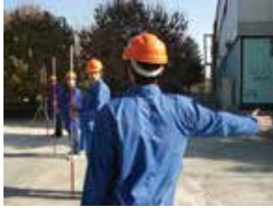
شکل ۴ - ۲. امتدادگذاری

این کار برای هر چند نقطه‌ای که لازم باشد تکرار می‌شود تا امتداد مستقیم برای مترکشی کاملاً مشخص گردد.