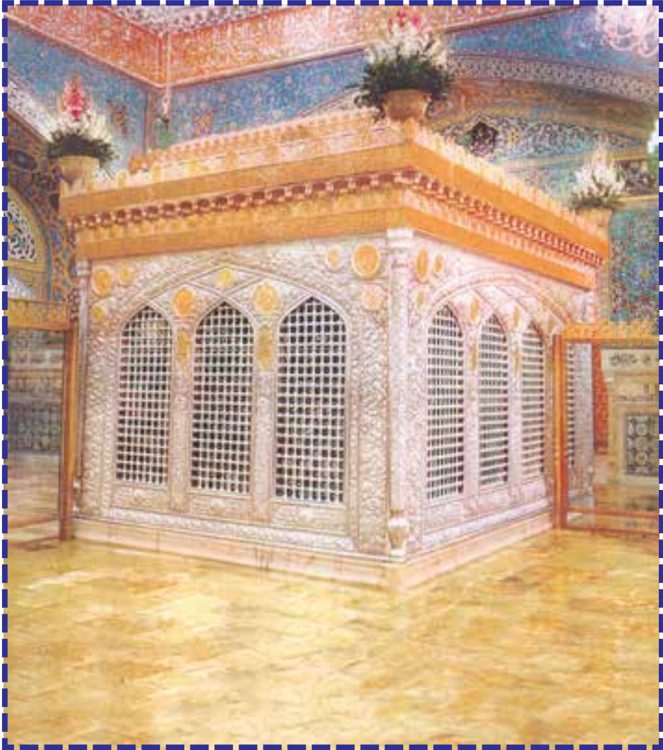
Sanctuaire sacré de L'Imam Réza (que lui soit béni) - Machhad