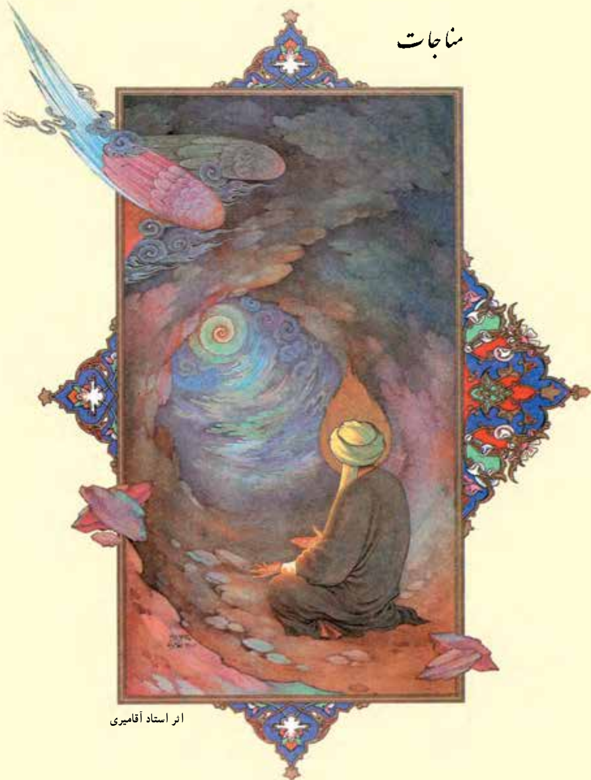
اثر استاد آقامیری