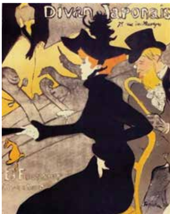
تصویر ۱۹- پوستر، انرهانری دو تولوز-لوترک، ۱۸۹۲