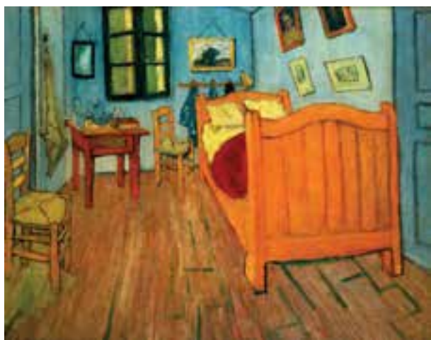
تصویر ۱۸- اتاق نقاش در آرل، انرونسان ون گوگ، سال ۱۸۸۹ میلادی، رنگ روغن روی بوم، موزه اورسی، پاریس

در آثار هنری تولوز-لوترک ۲ زندگی معاصر با کاریکاتوری دل‌تنگ‌کننده و زنده بیان می‌شود. گراورهای ژاپنی بر کار او بسیار تأثیرگذار بودند. او با ساده کردن پیکره‌ها و چهره‌ها دخل و تصرفاتی در آنها به وجود آورد که زمینه‌ای برای اکسپرسیونیسم شد و نوآوری‌هایی انقلابی در هنر پوستر به وجود آورد (تصویر ۱۹).