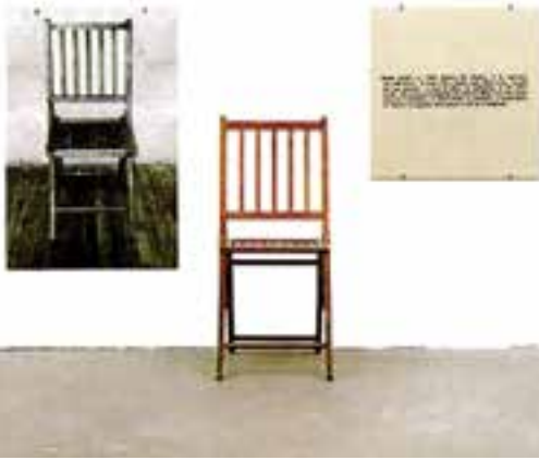
تصویر ۱۵- هنر مفهومی، یک و سه صدلی اثر جوزف کازوت، ۱۹۶۵

شکل‌های جدید هنر: از سوی دیگر محیط ۲ ، چیدمان ۳ و اجرای نمایشی ۴ و تمام جاذبه‌های هنری مستتر در این سه عنصر توجه هنرمندان را به خود جلب کرد. امروزه فعالیت‌های نمایش گونه و ژست‌های اجتماعی، رخداد هنری تلقی می‌شوند. هنر جدید در اشکال هنرچیدمان، هنر ویدئو، هنر عکس و هنر محیطی ظاهر شده است (تصویر ۱۷).