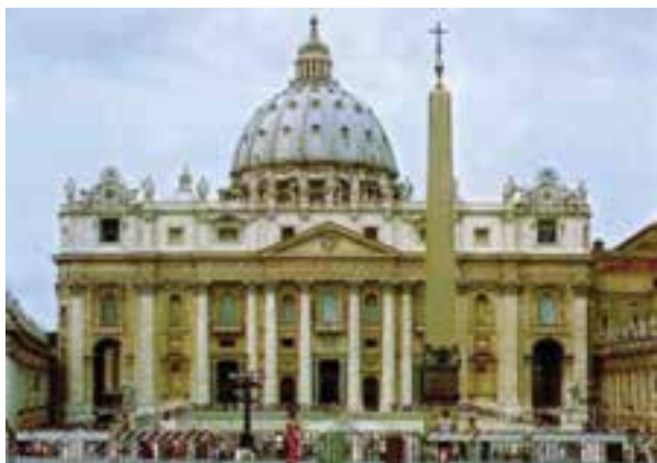
تصویر ۱- کلیسای سن‌پیر روم، نما اثر کارلو مادرنو، ستون کاری اثر برنینی، حدود ۱۶۱۲-۱۶۰۷ میلادی

معماری باروک با ساخت کلیساهای بزرگ از شهر رُم شروع شد. معماران این عصر نیز مانند دوره رنسانس هم پژوهشگر و هم در چند رشته تخصص داشتند، معماری باروک بنا به سلیقه معمار یا سفارش‌دهنده از سنت‌های مختلفی چون کلاسیک باستان، گوتیک و رنسانس در یک بنا سود می‌برد و تلاش می‌کرد بین عناصر مختلف هماهنگی ایجاد کند. در معماری باروک استفاده از شکل بیضی به جای دایره در گنبدها، پنجره‌ها و سقف رایج شد. سطوح محدب و مقعر، تأکید بر مرکز ساختمان، ارتباط معماری با فضای پیرامون، تأکید تزئینات داخلی و تلاش برای هماهنگی میان معماری، نقاشی و تندیس‌سازی بود. کارلو مادرنو ۲ و برنینی ۳ از بنیان‌گذاران معماری باروک در شهر رُم بودند. نما و صحن بیرونی