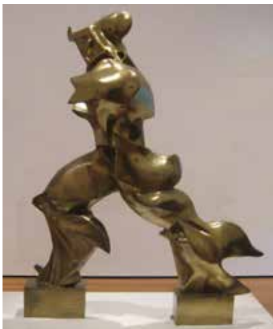
تصویر ۶- صور یگانه از استمرار در فضا، اثر امبرتو بوتچونی، ۱۹۱۳ م