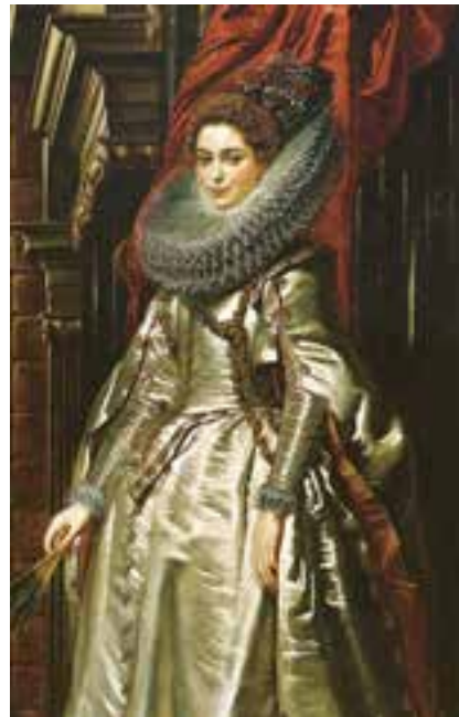
تصویر ۳- مارکزا، اثر روبنس، رنگ و روغن، سال ۱۶۰۶ میلادی، گالری هنر واشنگتن