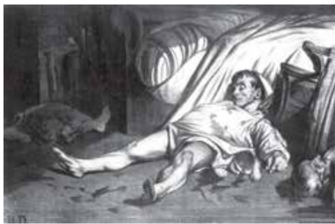
تصویر ۱۳- خیابان ترانسنون، اثر اونوره دومیه، ۱۸۳۴، گراور، ۴۵×۳۰ سانتی متر، موزه هنری فیلادلفیا