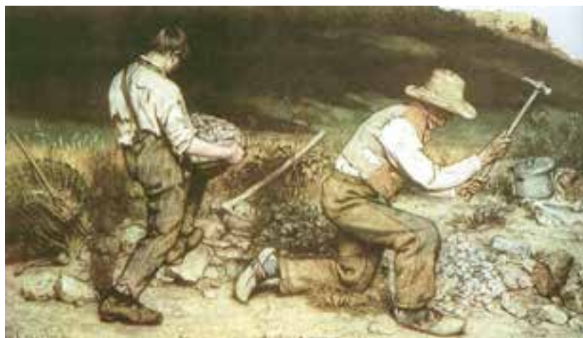
تصویر ۱۱- سنگ شکنان، اثر گوستاو کوربه، نگارخانه دولتی، درسدن (این تابلو در جنگ دوم جهانی نابود شد)

رئالیسم در میانه سده نوزدهم به وجود آمد که واکنشی در برابر خصلت آرمانی کلاسی سیسم و خصلت عاطفی و ذهنی رمانتی سیسم بود. انسان‌دوستی و علاقه به اصلاحات اجتماعی موضوعی بود که به تمام زوایای زندگی و هنر سده نوزدهم راه پیدا کرد. آنچه به نظر هنرمند جالب می‌آمد، اکنون در محیط خود او وجود داشت و این موضوع جالب، مردم - همان گونه که هستند - بود. نقاشی رئالیستی بازنمایی بدون آرمانگری در مفهوم صحنه با تمام خصوصیات پسندیده و ناپسندیده بود. این نهضت با کوربه ۴ آغاز می‌شود. تابلوی «سنگ شکنان» او نخستین نمونه تمام‌عیار نقاشی به این شیوه است. او معتقد بود که هنرمند باید فقط چیزهای مرئی و ملموس را بازنمایی کند. او موضوعاتی چون زندگی و کار تهیدستان را انتخاب می‌کرد و راه را برای نقاشان دیگر حتی با دیدگاه‌های متفاوت گشود (تصویر ۱۱).