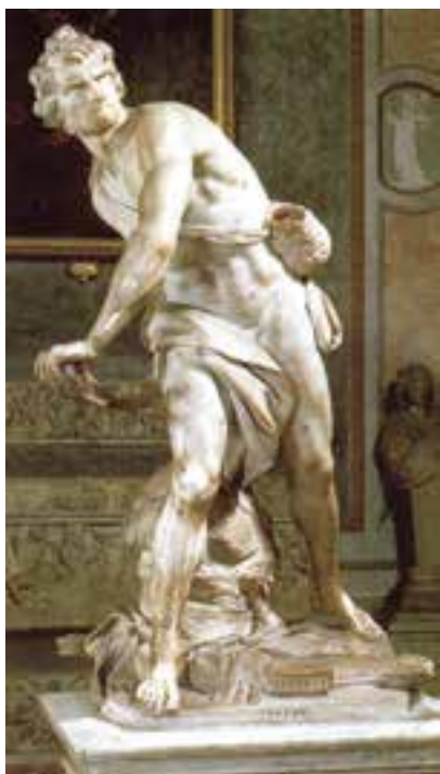
تصویر ۶- داوود در حال پرتاب سنگ به سمت جالوت، اثر برنینی، سنگ مرمر، سال ۱۶۲۳ میلادی، روم (مقایسه کنید با داوود میکلا آنژی)

تندیس‌سازی باروک نیز همانند نقاشی بسیار زنده، پرشور و چشمگیر است و بیان‌گر تلاش هنرمند در ارائه احساسات عمیق انسان است و تلاش دارد واکنش تماشاگر را برانگیزد (تصویر ۵). تندیس داوود در حال پرتاب سنگ به جالوت اثر برنینی سرشار از بیان احساس، تحرک و بویایی است (تصویر ۶).