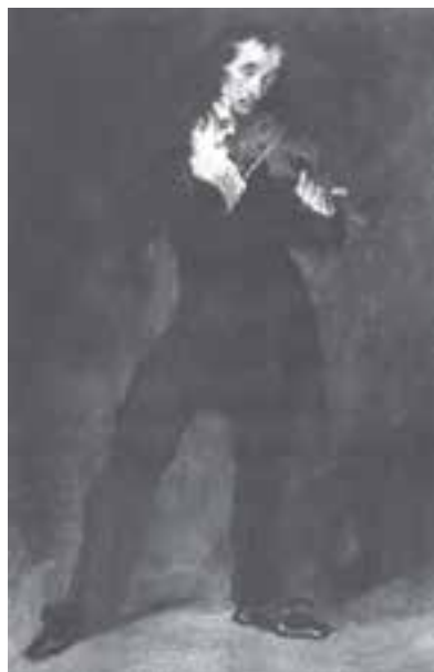
تصویر ۱۰- باگانی، انر اوژن دلاکروا، حدود ۱۸۳۲، رنگ روغن روی مقوا، ۲۸×۴۲ سانتی‌متر، مجموعه فیلیس، واشنگتن

جنبش‌های اجتماعی این عصر سبب دگرگونی در ذهن انسان اروپایی شد. در این مکتب نقاشان کارگاه نقاشی را رها کردند. آنها به طبیعت عشق می‌ورزیدند و براساس عاطفه و ذهن هنرمند رنگ‌ها را تابناک و سرزنده به تصویر می‌کشیدند. موضوعات معمولی و چهره‌های عادی را انتخاب و جایگزین تناسبات رسمی و قراردادی کردند. لازم به ذکر است که اینها همه در عصر «انقلاب صنعتی» یعنی گریز از ماشین و پناه بردن به دامان طبیعت بود. شاخص‌ترین هنرمند رمانتیک دلاکروا ۲ است که دامنه امکانات بیانی این هنر را گسترش فراوان داد. او شیوه رنگ‌پردازی و قلم‌زنی خود را به نقاشان بعدی مخصوصاً به امپرسیونیست‌ها انتقال داد. هنر نقاشی در عصر رمانتی سیسم، بیشتر موضوعات را از ادبیات الهام می‌گرفت. دلاکروا نیز داستان‌های تابلوهایش را عموماً از ادبیات و رخدادهای روزگار خود بر می‌گزید (تصویر ۱۰).