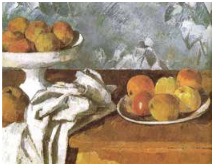
تصویر ۱۷- نقش اشیا، اثر پل سزان، حدود سال‌های ۱۸۸۲-۱۸۷۹ میلادی، رنگ روغن روی بوم، ۴۶×۵۵ سانتی‌متر، کلکسیون خصوصی

«سزان» ۶ از دیگر نقاشان این مکتب، با روش علمی در صدد یافتن قواعد جدیدی برای نظم دادن به تجربه و ادراک رنگ بود (تصویر ۱۷). از نظر سزان «نقاش باید طبیعت را به شکل استوانه، کره و مخروط نشان دهد».