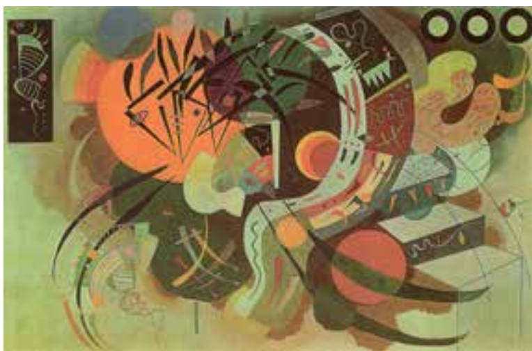
تصویر ۹- هنر انتزاعی، منحنی مسلط، اثر کاندینسکی

سال‌های ۱۹۱۱-۱۹۱۰ را سال‌های پیدایش جریان هنر آبستره (انتزاعی) می‌دانند. البته سرچشمه‌های این جریان هنری به سال‌های پیش‌تر بر می‌گردد. هدف اصلی انتزاعگران، نفی هر نوع بازنمایی طبیعت و ایجاد تجربه‌ای بصری یا تجسم مفهومی کلی و یا ذهنی بود. معمولاً کاندینسکی ۲ را مبتکر نقاشی انتزاعی و فیلسوف و نظریه‌پرداز این شیوه می‌دانند. وی مانند نقاشان قدیم روسی با جهان‌نگری عارفانه خویش هیچ‌گاه هنر را تقلیدی از جهان مادی نمی‌دانست. در ابتدا شروع و حرکت در این مسیر به شجاعت و تخیل فوق‌العاده‌ای نیاز داشت. اما امروزه هنر انتزاعی بخشی از زندگی ما شده است (تصویر ۹).