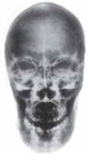
تصویر ۱۹- پرتره جمجمه، اثر الکساندر دوکادنه، چاپ سیباکروم روی آلومینیوم، هنر عکس، ۲۵۰ × ۱۴۸

در مقابل این شکل‌های جدید هنری، نوعی بازگشت به موضوعات و ارزش‌های کلاسیک به وجود آمده است که به جای پافشاری بر ژولیدگی زندگی شهری معاصر، تلاش دارند ارزش‌های کلاسیک را در آثارشان ارائه دهند. برتوچی در اثر خود (تصویر ۲۰) دو نوجوان ایتالیایی را با پس‌زمینه نقشه ایتالیا نشان می‌دهد تا بازگشتی به سنت‌های کلاسیک روم باستان باشد.