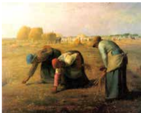
تصویر ۱۴- خوشه چینان، اثر ژان فرانسوا میله، ۱۸۵۷ میلادی، رنگ و روغن روی بوم، موزه اورسه، پاریس