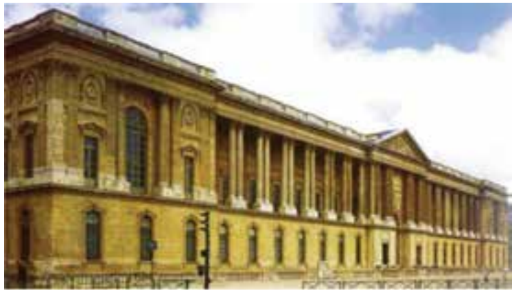
تصویر ۲- نمای شرقی کاخ لوور، سال ۱۶۷۰-۱۶۶۷ میلادی، پاریس (در حال حاضر موزه لوور)

کلیسای سن پیر ۱ در رُم کار مادرنو و ستون کاری آن کار برنینی است (تصویر ۱). برنینی از معماران و تندیس‌سازان بزرگ شهر رُم بود، وی پیرو سنت کلاسیک باستان بود و خود را جانشین میکل‌آنژ می‌دانست، تزینات پُر تجمل صحن داخلی کلیسا از نمونه کارهای او است. کاخ لوور ۲ از آثار باشکوه معماری باروک است. این بنا متأثر از سنت کلاسیک باستانی است اما ستون‌های دو تایی آن ابتکار جدیدی بود که در معماری فرانسه رواج یافت (تصویر ۲).