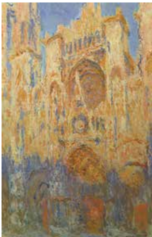
تصویر ۱۵- منظره کلیسای روئن در غروب آفتاب، اثر کلود مونه، رنگ و روغن روی بوم، موزه هنرهای زیبای بوستون

اصطلاح امپرسیونیسم را در سال ۱۸۷۴م، روزنامه‌نگاری به‌ریشخند در مورد یکی از منظره‌های کلود مونه ۱ (امپرسیون: طلوع آفتاب) به‌کاربرد. مونه نماینده واقعی این جنبش است. او بیست و شش منظره از کلیسای روئن ۲ را نقاشی کرد (تصویر ۱۵). در هر تابلو، کلیسا از یک نقطه دید ثابت ولی در ساعات متفاوتی از روز و در شرایط اقلیمی و جوی متفاوتی نقاشی شده است. پیسارو ۳ و رنوار ۴ از شاخص‌ترین امپرسیونیست‌ها هستند. عامل پیونددهنده این نقاشان «حساسیت به رنگ» و «جلوه‌های ناپایدار نور و حرکت» است. نور نقش اصلی را در نقاشی امپرسیونیستی ایفا می‌کند و وظیفه هنرمند ثبت دقیق و فوری ارتعاشات زودگذر نور است. امپرسیونیست‌ها بیشتر در فضای باز نقاشی می‌کردند.