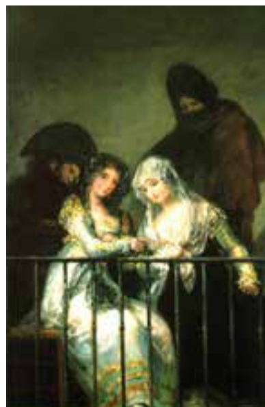
تصویر ۱۲- زنان در بالکن، اثر فرانسیسکو گویا، ۱۸۱۵-۱۸۱۰ میلادی، رنگ و روغن روی بوم، موزه هنر متروپولیتن، نیویورک

دومیه ۲ نیز با تکنیک چاپ سنگی مقدار زیادی کاریکاتورهای اجتماعی و سیاسی برای چاپ در مجلات و روزنامه‌ها ساخت (تصویر ۱۳). میله ۳ (میله) نقاشی است که تمایلات هر دو مکتب واقع‌گرایی و رمانتیک را در آثارش می‌توان دید (تصویر ۱۴).