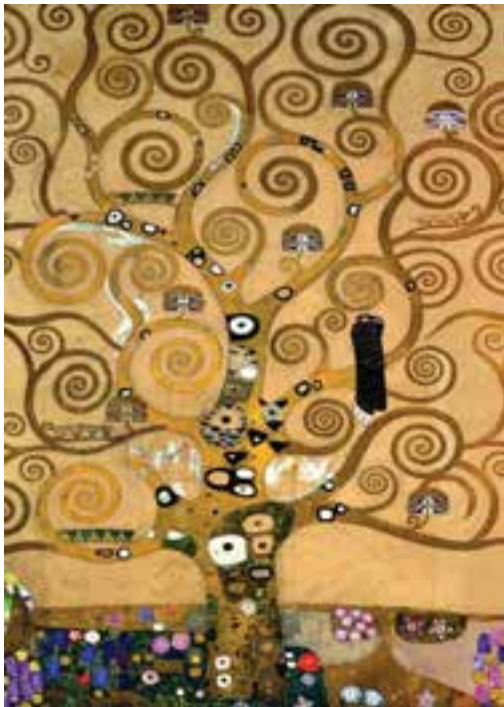
تصویر ۲۰- بخشی از اثر درخت زندگی، سمبولیسم، اثر کلیمت

یا نمادی از تجربه درونی آن واقعیت کردند. تفسیرهای آزادانه هنرمند از طبیعت جای شکل‌های قطعی جهان مرئی را گرفت و کم‌کم اسلوب کار هنرمند شخصی‌تر شد. هنرمند با رد شکل‌های قراردادی، از سلطه مفاهیم و معانی قراردادی نیز بیرون می‌آید. وظیفه هنرمند جستجوی سرچشمه‌های پنهان و مرموز آدمی است. آنها به دنبال کشف و شهود بودند. سمبولیست‌ها در بیانیه‌ای اعلام کردند «ما به استقلال هنر باور داریم، هنر برای ما وسیله نیست بلکه هدف است. هر هنرمندی که چیزی جز زیبایی در نظر گیرد، در نظر ما هنرمند نیست...». شعار «هنر برای هنر» شیوه زندگی آنها بود. کلیمت ۱ از نقاشان جنبش سمبولیست می‌باشد (تصویر ۲۰).