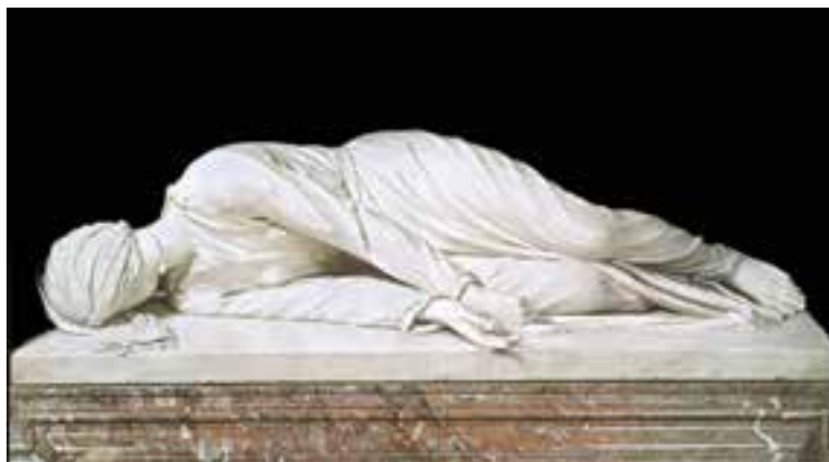
تصویر ۵- تندیس بدن روحانی متوفی (طبیعت‌گرایی پُر احساس)، اثر استفانو مادرنو، مرمر، حدود ۱۶۰۰ میلادی، روم