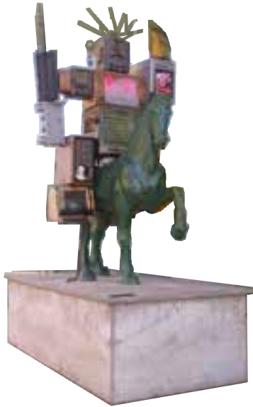
تصویر ۱۸- هنر پُست مدرن، سوارکار، اثر نام جوم پایک، موزه ارتباطات فرانکفورت. (شاید هنرمند وسایل رایانه‌ای و دیجیتال را دون‌کیشوتی در عصر حاضر معرفی می‌کند.)