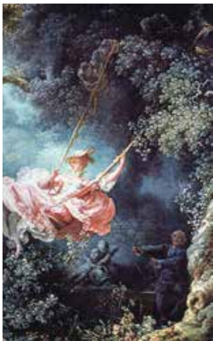
تصویر ۷- بخشی از تابلو به نام تاب، اثر فراگونار

اصطلاحی در تاریخ هنر برای توصیف هنر تزئینی در زمینه‌های مختلف، چون تزئینات معماری، نقاشی، تندیس‌سازی، طراحی ائانیه، اشیای زینتی و غیره پدید آمد. واژه روکوکو از واژه فرانسوی روکای به معنی «سنگریزه» گرفته شده است و به سنگریزه‌ها و صدف‌هایی اطلاق می‌شود که برای تزئین فضای داخل غارها و سرداب‌های مصنوعی به کار برده می‌شوند. واتو ۲ از برجسته‌ترین هنرمندان سده هجدهم میلادی سبک خاصی را آفرید که پس از او به روکوکو انجامید. نقاشی این دوره، سرشار از جلوه‌های پراحساس و حتی شاد و فریبنده با موضوع‌های دنیوی و سبکسرانه، رنگ‌های لطیف و خطوط منحنی و منطبق با سلیقه اشرافیت است. فراگونار ۳ ، که نقاشی‌های او تزئینی با رنگ‌های چشم‌نواز است از نمایندگان این سبک به‌شمار می‌رود (تصویر ۷).