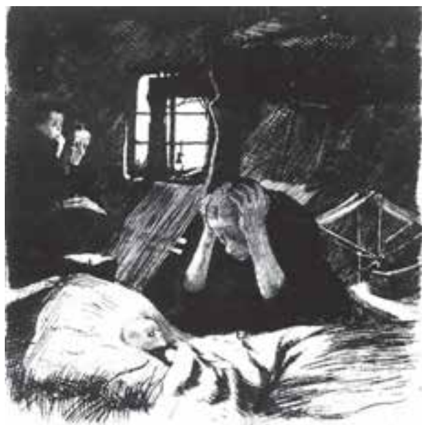
تصویر ۴- نیاز، اثر کته کُل ویشس، اکسپرسیونیسم سال‌های ۱۹۰۱-۱۸۹۳ میلادی، چاپ سنگی

نُله، کُل ویشس ۲ و... ماندگارترین آثار اکسپرسیونیستی را آفریدند. آنها در وحشتناک‌ترین لحظات سده بیستم یعنی زمان استبداد نازی بر تمدن اروپایی می‌زیستند و شاهد مستقیم کشتارها و فساد آلمان در سال‌های پس از جنگ بودند (تصویر ۴).