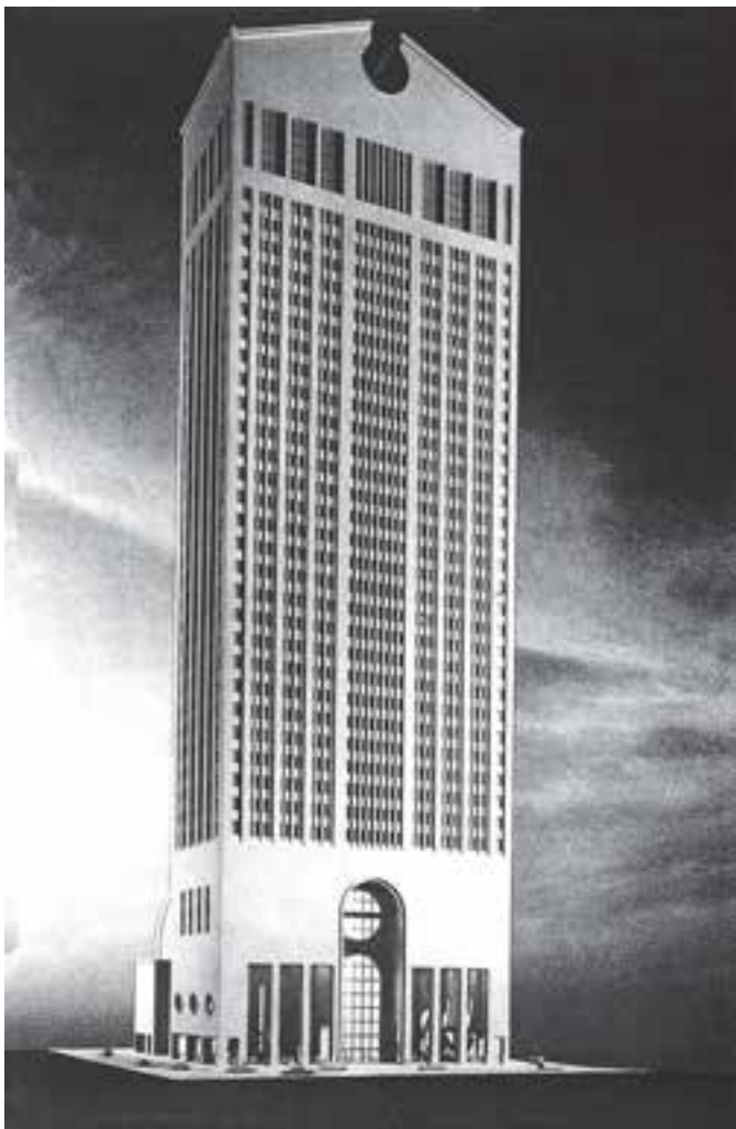
تصویر ۱۶- معماری پست مدرن، ساختمان سونی، اثر فیلیپ جانسون ۱۹۸۳، نیویورک (یادآور کمد قدیمی)