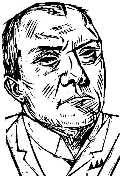
تصویر ۱۲- تک‌چهره خود هنرمند (باسمه)، اثر ماکس بکمان، نئورئالیسم دهه ۱۹۲۰

درآلمان پس از جنگ اول جهانی، آشفته‌گی اجتماعی و سیاسی به اوج می‌رسد. نسل جنگ سعی می‌کند با تیزبینی بر تباهی اخلاقی و بینوایی اجتماعی انگشت بگذارد. چنین بینشی فقط می‌تواند با نوعی واقعگرایی تند و گزنده بیان شود. پس هنر به سلاح حمله و دفاع و وسیله‌ای برای نقد و تبلیغ بدل می‌شود. به این ترتیب شکل‌های مختلف واقع‌نمایی به‌عنوان واکنشی منفی در برابر انتزاع شکل می‌گیرد. «بکمان» ۳ مفهومی نوین از واقعگرایی را مطرح کرد. او سبک‌های مختلفی را در زندگی تجربه نمود. برای بکمان هیچ چیز مهمتر از بازنمایی و محتوا نبود. پرده‌های او در نقطه مقابل هنر تزئینی یا «نقاشی برای نقاشی» قرار دارند. در آثار او انسان، موقعیت او و حالات ذهنی‌اش با واقعیت تمام در برابر تماشاگر ظاهر شده‌اند (تصویر ۱۲).