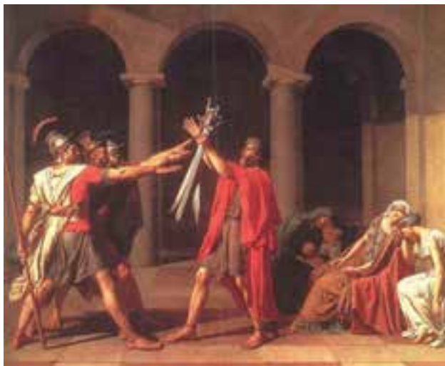
تصویر ۸- سوگند هوراتیوس‌ها، اثر ژاک لویی داوید، ۱۷۸۴م، رنگ روغن روی بوم، ۴۲۰×۳۳۰ سانتی‌متر، موزه لوور، پاریس

نئوکلاسیسیسم سبکی هنری است که در نیمه دوم سده هجدهم واکنشی علیه باروک و روکوکو به‌شمار می‌رود. از سوی دیگر گرایش به هنر آرمانی یونان و روم به‌عنوان تقلید از طبیعت در این مکتب شکل گرفت. هنرمند معروف این سبک داوید ۲ (۱۸۲۵-۱۷۴۸م) است. او در برابر سبک روکوکو طغیان کرد و سنت‌های کلاسیک را از نو به سبک فردی خود احیا نمود (تصویر ۸). تصویر ۹ نمونه‌ای از معماری نئوکلاسیک می‌باشد که از ستون‌ها و نمای معماری کلاسیک یونان تأثیر گرفته است.