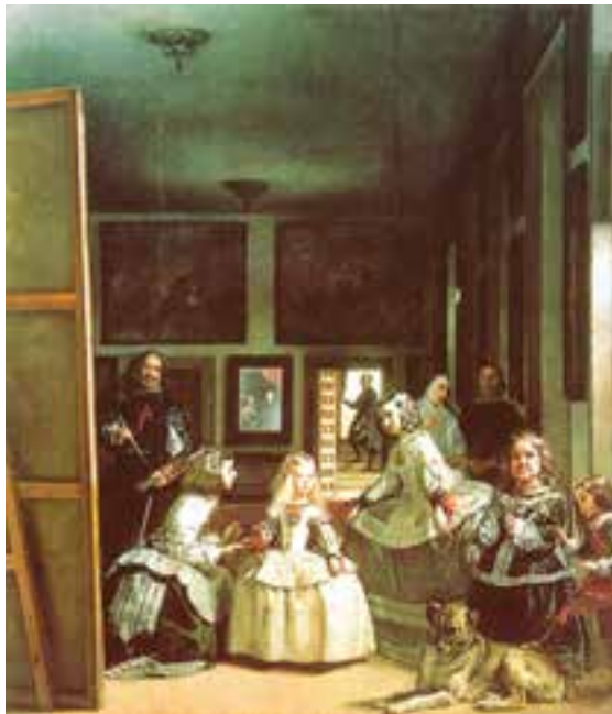
تصویر ۴- تصویر ندیمه اثر و لاسکوئز، رنگ و روغن، سال ۱۶۵۶ میلادی، مادرید

نقاشان باروک در نمایش طبیعت به واقعیت وفادار بودند و در آثارشان به رنگ، بافت، محاسبه روشنایی و تاریکی، استفاده از نور برای جلب توجه، حالت نمایشی، فضای پر و خالی و جلوه‌های غیر مترقبه اهمیت می‌دادند. از ویژگی‌های نقاشی باروک رواج نقاشی‌های علمی، تجسم فرهنگ و ادبیات عامه و آدم‌های معمولی، طبیعت بیجان، نقاشی منظره، نقاشی سقفی (تصاویر ۳ و ۴)، از هنرمندان برجسته این دوره می‌توان به کارا و ادجو ۳ ، دیه گو و لاسکوئز ۴ و رامبراند ۵ اشاره کرد.