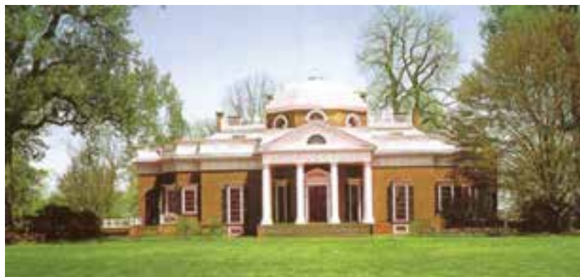
تصویر ۹- خانه توماس جفرسن رئیس جمهور امریکا، سده ۱۸ میلادی، ویرجینیا، امریکا