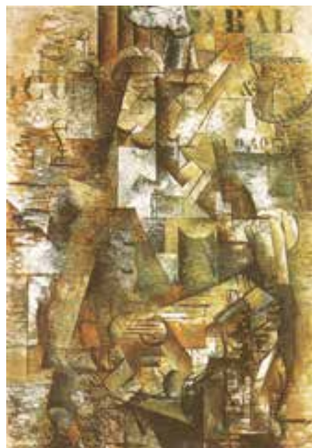
تصویر ۵- پرتغالی‌ها، اثر زرژ براک، کوبیسم ترکیبی، رنگ و روغن، ۱۹۱۱ میلادی

فوتوریست‌ها بیشترین استقبال را از جنبش کوبیسم کردند. آنها تلاش کردند صورت پویاتری از کوبیسم را ارائه کنند. فوتوریست‌ها به‌ستایش دنیای نوین، ماشین، سرعت و خشونت پرداختند. آنها می‌خواستند هنر را به زندگی نزدیک کنند و حرکت را جوهر زندگی امروزی می‌دانستند. تأکید آنها بر نور و حرکت بود. دوران شکوفایی این جنبش در پایان جنگ جهانی رو به‌زوال گذاشت. بوتچونی ۷ از بزرگان این جنبش است که تلاش دارد حرکت و انرژی را در آثارش جلوه‌گر سازد (تصویر ۶).