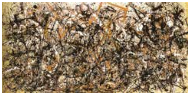
تصویر ۱۳- اکسپرسیونیسم انتزاعی، اثر جکسون پولاک، ۱۹۵۰ میلادی، رنگ و روغن و رنگ لعابی روی بوم بدون آستر، موزه هنر مدرن، نیویورک

نوعی نقاشی عاری از تصویر و فاقد شکل‌های بنیادی (مانند اشکال هندسی) و روشی خودانگیزته و پویا و قلمزنی آزاد به‌شمار می‌رود. نقاشی‌های پولاک ۲ بیان‌گر این شیوه است. نقاشی‌های او بازتابی از شرایط کلی زندگی بی‌قرار انسان غربی پس از تجربه دو جنگ جهانی است (تصویر ۱۳). از نظر او و همه هنرمندان اکسپرسیونیست انتزاع‌گرا، اثر هنری نتیجه عمل مهارنشده هنرمند است و هیچ مضمونی را بیان نمی‌کند. اکسپرسیونیسم انتزاعی نخستین جنبش هنری مهم در سال‌های بعد از جنگ جهانی دوم و اصیل‌ترین و متمایزترین دستاورد تاریخ هنر آمریکا دانسته شده است.