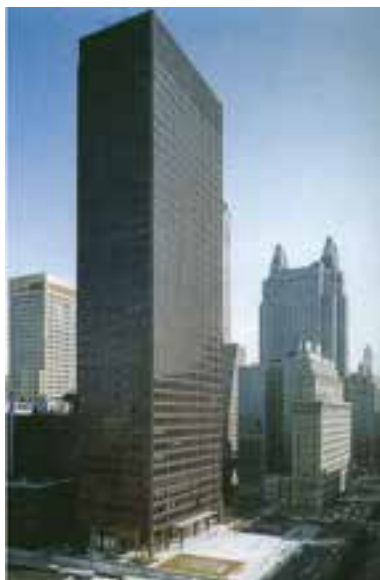
تصویر ۱- معماری مدرن ساختمان سیگرم، نیویورک، سال ۱۹۵۸-۱۹۵۴

معماری مدرن ابتدا از اروپا شروع شد و سپس در آمریکا رونق گرفت. معماری مدرن دو مسیر را ادامه داد، یکی معماری ماشین‌وار که معتقد بود شکل بنا باید تابع عملکرد آن باشد و دیگری معماری شخصی که بیانگر، جذاب، متمایل به جلوه‌های تزئینی و استفاده از عناصر معماری گذشته بود. بتون مسلح، آهن و شیشه نقش مهمی در اشکال معماری قرن بیستم داشت. معماری ماشین‌وار مدرن اغلب با ساختمان‌های مکعب گونه و آسمان خراش‌ها در مراکز شهری مشخص می‌شود (تصویر ۱ و ۲).