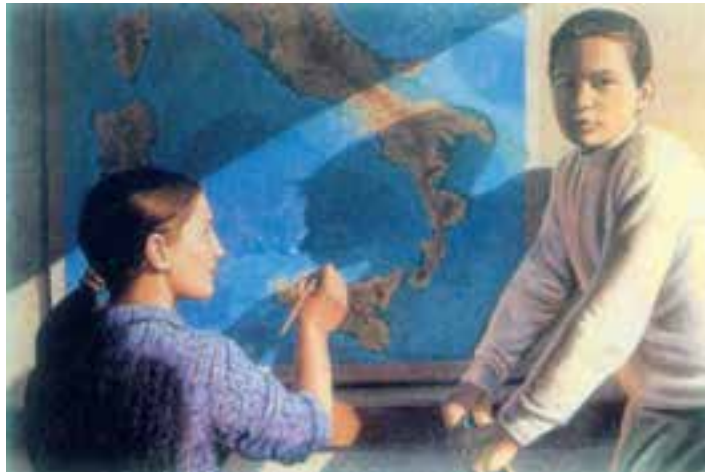
تصویر ۲۰- ریشه نقاشی، اثر کارلو برتوچی، بازگشت به سنت‌های کلاسیک، ۲۰۰۰، رنگ روغن روی بوم، ۸۰×۱۲۰، گالری پولیتیکو، رم