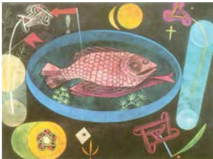
تصویر ۱۰- اطراف ماهی، اثر پل کله، هنر انتزاعی، رنگ و روغن روی بوم، ۱۹۲۶ میلادی