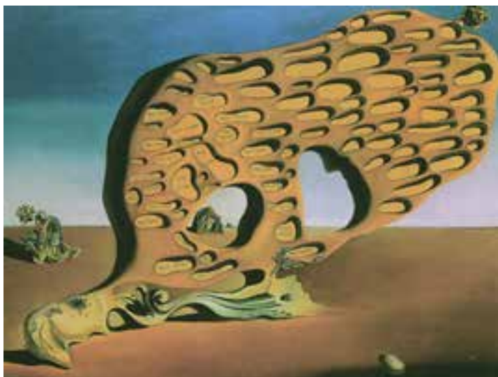
تصویر ۸- غربال آرزوی نفسانی، اثر سالوادوردالی، ۱۹۲۹، رنگ و روغن روی بوم