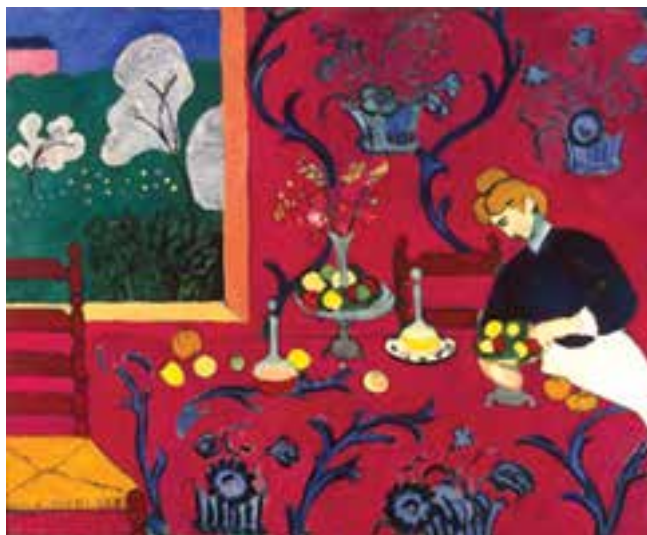
تصویر ۳- میز غذاخوری، اثر هانری ماتیس، ۱۹۰۸ میلادی، موزه هرمتاژ، سن پترزبورگ

نخستین نشانه‌های یک نهضت جدید، در سال ۱۹۰۵ در نمایشگاهی به پیشگامی «هانری ماتیس» ۳ ظهور کرد. آشنایی هنرمندان با فرهنگ غیراروپایی راه‌های تازه‌ای را برای انتقال عواطف پیش پای آنها گذاشت. نقاشی‌های آنها از نظر طرح ساده و از لحاظ رنگ درخشان بود. در این نمایشگاه منتقدی آنها را «فووها» (حیوان وحشی) نامید. آنها با در کنار هم قراردادن رنگ‌های متضاد قدرت و شدت تازه‌ای به رنگ بخشیدند. نمایش کنش عاطفی هنرمند به موضوع کارش با استفاده از شدیدترین رنگ و قوی‌ترین خط، از هر شبیه‌سازی مهمتر بود (تصویر ۳).