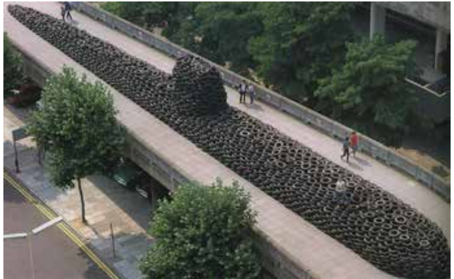
تصویر ۱۷- هنر چیدمان، اثر دیوید ماچ، لاستیک‌های فرسوده، نمایش در گالری هاروارد لندن، تخریب پس از نمایش

نام جوم پایک ۱ هنرمندی است که با چیدمان وسایل بصری، حجم‌های جالبی را ایجاد می‌کند و با نگاه طنز یا انتقادی خود، تسلط وسایل ارتباط جمعی را بر زندگی انسان نشان می‌دهد (تصویر ۱۸). در هنر معاصر، عکاسی جایگاه ویژه‌ای یافته است و هم ارزش با سایر رشته‌های هنری قرار گرفته است. به کمک امکانات کامپیوتری بین هنر عکاسی و دیگر شکل‌ها حد و مرزی وجود ندارد. دو رسانه ویدئو و عکاسی به دلیل جذابیت مردمی و جنبه سرگرمی و سهولت نقل و انتقال آن مورد استقبال هنر جدید قرار گرفته است. یکی از هنرمندان پُست مدرن در عکاسی، دوکادنه ۲ است که عکس‌های رادیولوژی را با توجه به ویژگی‌های شخصی افراد رنگ می‌زند و ترکیبی از عکاسی و نقاشی به وجود آورده است. (تصویر ۱۹).