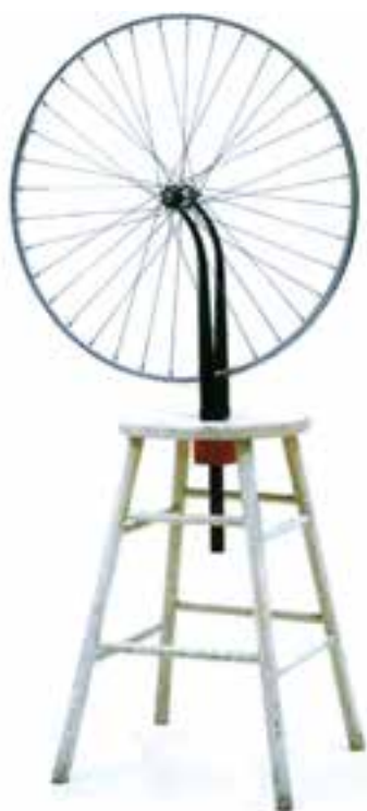
تصویر ۷- دوچرخه فلزی سوارشده روی پایه چوبی رنگ آمیزی شده، اثر مارسل دوشان، هنر دادائیسم ۱۹۱۳ م، موزه هنر مدرن، نیویورک

سورئالیسم از درون دادائیسم بیرون آمد و اغلب دادائیست‌ها مثل دوشان، به جنبش سورئالیسم پیوستند. آنها قصد تلفیق امور معقول و غیر معقول را داشتند. سورئالیسم تجربه شاعرانه‌ای در یکی کردن انسان با جهان درونی‌اش است. اوج این جنبش دهه ۱۹۳۰ و مهمترین و نیرومندترین جنبش هنری سال‌های بین دو جنگ جهانی بود. دالی ۴ از هنرمندان مشهور این مکتب بود. بلافاصله پس از شروع جنگ جهانی دوم بسیاری از این هنرمندان به ایالات متحده (نیویورک) کوچ کردند و به طور جدی منشأ حرکت و تحول در میان هنرمندان آمریکایی گردیدند (تصویر ۸).