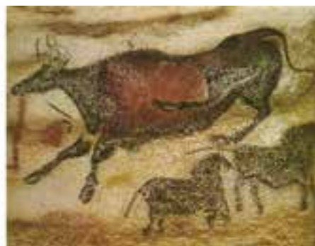
تصویر ۵- دوره پارینه سنگی راست: تالار گارها، چپ: نقش اسب، غار لاسکو، فرانسه، حدود ۱۵۰۰۰ تا ۱۰۰۰۰ سال پیش از میلاد