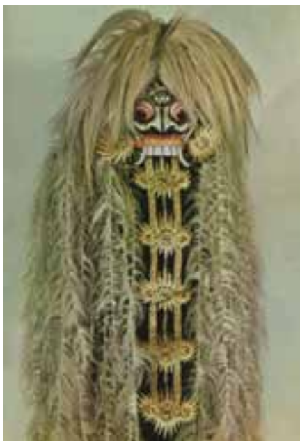
تصویر ۱۷- ماسک نمایشی، جزیره بالی - اندونزی

در ساخت پیکره‌ها، بیشترین تأکید بر روی نگاه و حالت چهره است که بیانگر معنا و کارکرد آن می‌باشد. سایر اندام‌های بدن بسیار ساده و هندسی‌وار هستند. بعضی از تندیس‌ها رنگ آمیزی و با نقوش هندسی کنده شده، تزیین می‌شوند (تصویر ۱۷). این مردمان با وجود تاریخ طولانی همانند ملت‌های آسیا، اروپا و شمال آفریقا به مراحل تحول نرسیدند و شیوه زندگی آنها کم و بیش تا زمان حاضر، ادامه یافته، اما با ورود اروپاییان به سرزمین‌های آنها، نظام زندگی و شیوه هنری این جوامع در حال انقراض است.