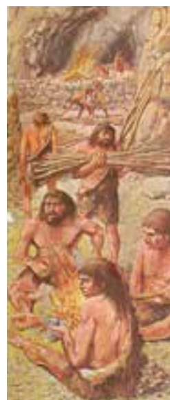
تصویر ۳- تصویر فرضی از زندگی مردم عصر پارینه سنگی