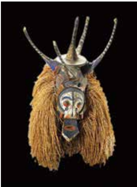
تصویر ۱۹- ماسک آیین بلوغ، جنوب غربی کنگو، آفریقا، قرن بیستم، بلندی ۲۴ سانتی‌متر، گالری برکت، کالیفرنیا

معمولاً به هنر ساکنان آفریقا غیر از سواحل و مناطق شمالی آن قاره، هنر آفریقایی گفته می‌شود. بومیان آفریقا صاحب هنری منضبط و سنت‌گرا، با محتوایی آئینی و زیبایی‌های صوری و انتزاعی خاص هر قوم و قبیله بوده‌اند. شکل‌های هنری معتبرترین ملاک تعیین هویت هر قبیله به‌شمار می‌آید. مهمترین قالب هنری آن قاره پیکره‌سازی و کنده‌کاری تزئینی بود. پیکره‌های چوبی همه‌جا در مراسم دینی یا آئین‌های قبیله‌ای به کار می‌رفت. سرپیکره‌ها غالباً بزرگ و بی‌تناسب ساخته می‌شد، زیرا در باور هنرمند، سر جایگاه نیروی زندگی و مهمترین بخش بدن بود. تندیسک‌ها تقریباً همیشه از یک تنه درخت و با فرینه‌سازی دقیق تراشیده می‌شدند و کشیدگی بدن و کوتاهی دستان شاخه‌مانندشان به همین سبب بود. نقاشی روی پوست بدن و شیاراندازی بر چهره در میان بسیاری قبایل مرسوم بوده است. نگاره‌ها و آرایش‌های رنگی به کار رفته در روی بدن، غالباً در پیکره‌سازی نیز اجرا می‌شده است. حرکات موزون مهمترین و گویاترین وسیله بیان هنری بومیان آفریقا است. در جریان این حرکات از تندیس‌های گوناگون استفاده می‌شد. هنرهای آفریقا در زندگی روزانه و مراحل مختلف زندگی تولد، بلوغ، ازدواج و مرگ نقش مهمی دارند (تصاویر ۱۸ و ۱۹).