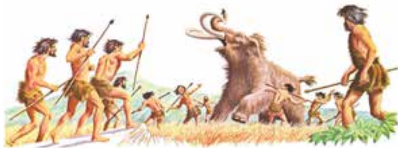
تصویر ۴- تصویر فرضی شکار ماموت توسط مردم عصر پارینه سنگی

در حدود ۳۵۰۰۰ سال پیش از میلاد نخستین دست ساخته‌های انسان ظاهر و به تدریج کیفیت ساخت آنها بهبود می‌یابد و در فاصله ۱۵۰۰۰ تا ۱۰۰۰۰ سال پیش از میلاد به بالاترین کیفیت می‌رسند (تصاویر ۳ و ۴).