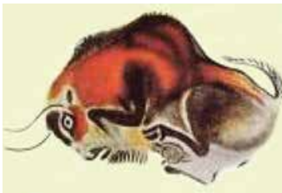
تصویر ۶- گاو وحشی زخمی، غار آلتامیرا، اسپانیا. حدود ۱۵۰۰۰ تا ۱۰۰۰۰ سال پیش از میلاد