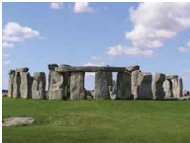
تصویر ۱۴- الف- استون هنج (سنگ افراشت) یا پرستشگاه نجومی سنگی، انگلستان، حدود ۱۸۰۰ تا ۱۴۰۰ سال پیش از میلاد