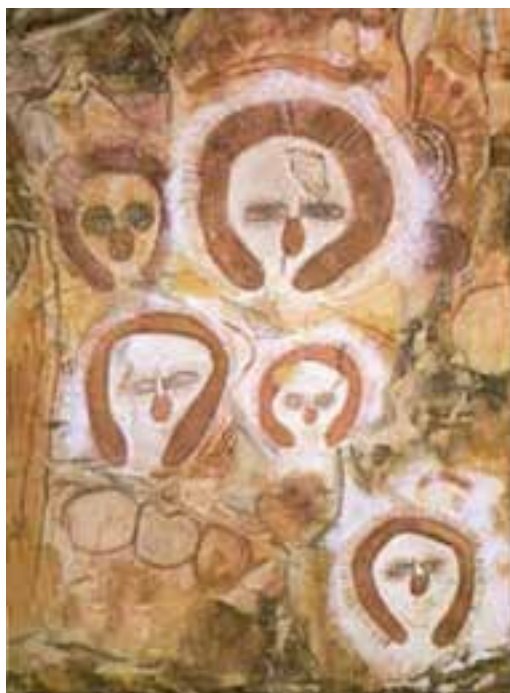
تصویر ۲۱- نقاشی صخره‌ای (روح زندگی)