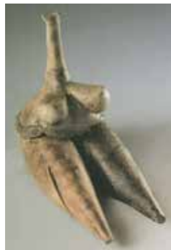
تصویر ۹ - ونوس تپه سراب، کرمانشاه، حدود ۶۰۰۰ سال پیش از میلاد - موزه ملی ایران