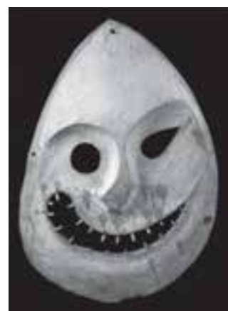
تصویر ۲۶ – نقاب رقص، اسکیموهای آلاسکا، حدود سال ۱۸۸۰ میلادی، چوب، موزه مردم‌شناسی، برلین

اسکیموها در نواحی شمال آمریکا، اروپا و آسیا (پیرامون قطب شمال) سکونت دارند و از طریق ماهیگیری و شکار حیوانات امرار معاش می‌کنند. اسکیموها در ساخت پیکره‌های جانوری، صورتک و لوازم زندگی به‌ویژه از استخوان، عاج، چوب و شاخ حیوانات توانا هستند. اسکیموها در طی سده‌های متوالی، صدها پیکره کوچک آدمی، جانوری و صورتک‌های متحرک را با استفاده از جنس عاج و استخوان و چوب ساخته و یا تصاویر ریز نقش جانور و انسان را با ظرافت تمام بر روی این مواد کنده‌کاری کرده و از طریق آنها افسانه‌های قومی خود را حفظ کرده‌اند (تصویر ۲۶). در بعضی از صورتک‌های اسکیموها اجزا و حالت چهره از واقع‌گرایی نیرومندی برخوردار است.