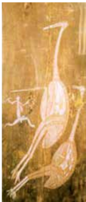
تصویر ۲۲- نقاشی روی چوب، صحنه شکار (نقاشی اشعه ایکس)، غرب استرالیا

نه تنها شکل ظاهری بلکه اندام‌های داخلی مانند ستون فقرات، قلب و... نیز نقاشی می‌شوند (نقاشی اشعه ایکس) (تصویر ۲۲).