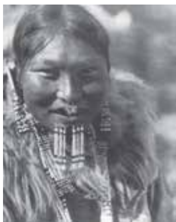
تصویر ۲۵ – یک دختر سرخ‌پوست آمریکای شمالی. اوایل قرن بیستم

صنعتگران سرخپوست در عرصه تبدیل سنگ به انواع اشیای مفید در زندگی روزمره یا اشیای آیینی توانا هستند. رسم دیگر سرخپوستان ساخت محیط‌های گیرا و تماشایی برای فعالیت‌های مذهبی است. نقاشی و کنده‌کاری‌های صخره‌ای نیز در نزد آنها رواج دارد که برخی از آنها بسیار زنده و طبیعت‌گرایانه هستند. در نزد سرخ‌پوستان جنوب غربی آمریکا «نقاشی آیینی روی شن» ۱ با استفاده از گرد سنگ‌ها و خاکه‌های رنگی (نظیر خاک رُس، گچ، زغال و...) بر بستری از ماسه و یا خاک مرسوم بوده که انجام آن نیاز به مهارت داشته و نقاش به‌دستور طیب – جادوگر قبیله به‌ایجاد نقوش رمزی و سنتی با هدف شفا دادن بیماران در مراسمی همراه با دعا و افسون می‌پرداخته است (تصویر ۲۴). سرخپوستان ساکن دشت‌های بزرگ به‌دلیل زندگی چادرنشینی توجهشان بیشتر بر لباس و اندام خود و دیگر اشیای منقول مانند چپق، تبرزین و ظروف گوناگون معطوف بود (تصویر ۲۵).