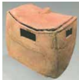
تصویر ۸ - ماکت سفالی خانه برای نگهداری آذوقه، تپه سنگ چخماق، شاهرود، حدود ۶۰۰۰ تا ۵۰۰۰ سال پیش از میلاد

در اوایل هزاره چهارم پیش از میلاد با ابداع چرخ سفالگری، سفال‌ها از تقارن منظمی برخوردار شده و نقاشی روی سفال از اهمیت برخوردار می‌شود. سفال‌ها در آغاز دارای نقوش