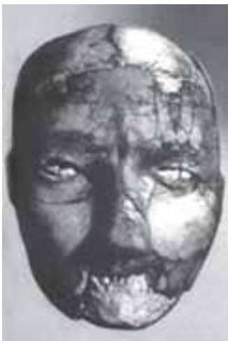
تصویر ۱۳- مجموعه گچ‌اندود، اریحا، اردن، حدود ۶۰۰۰ تا ۷۰۰۰ سال پیش از میلاد

هندسی (خطوط موازی، عمودی، زیگزاگ، موجی و شطرنجی و...) بودند و این نقش‌ها با رنگ‌های سیاه یا قرمز بر روی آنها رسم می‌شدند. اندکی بعد تصویر انسان، پرندگان، چهارپایان و ستارگان نیز رایج شد (تصاویر ۱۰ و ۱۱ و ۱۲). شیوه تصویر نگاری موجودات، ساده، خلاصه شده و دو بُعدی هستند ۱ و بدن موجودات به شکل هندسی و در بعضی موارد روی اجزای بدن اغراق می‌شود (مثل شاخ‌ها)، به همین خاطر تصاویر از واقع‌نمایی و طبیعت‌گرایی به دور هستند. آثار و اشیای هنری به‌جا مانده از دوره نوسنگی در نقاط مختلف دنیا هم‌زمان نیستند و از نظر نوع با هم متفاوتند. به‌طور مثال در ایران و عراق سفال و در فلسطین مجموعه‌های یادبودی و در انگلستان سنگ افراشته‌ها (سنگ‌هایی که به‌صورت عمودی روی زمین قرار گرفته است) باقی مانده‌اند (تصویر ۱۴). در اریحا (دهکده‌ای در کشور اردن) پرستش مجموعه مانند برخی جوامع بومی آفریقا رایج بود، در این محل تعدادی سردیس آدمی که سیمایی نافذ و پر حالت دارند و به‌هزاره هفتم و ششم پیش از میلاد تعلق دارند، کشف شده است. هنرمندان اریحا مجموعه را از بقیه اسکلت جدا می‌کردند و با گچ رنگی دوباره آن را به‌شکل سر آدم در می‌آوردند و در بازسازی سعی می‌کردند که شبیه چهره صاحب آن باشد (تصویر ۱۳). سازندگان این سردیس‌ها پیشگامان هنر چهره‌سازی در دوره‌های بعد هستند.