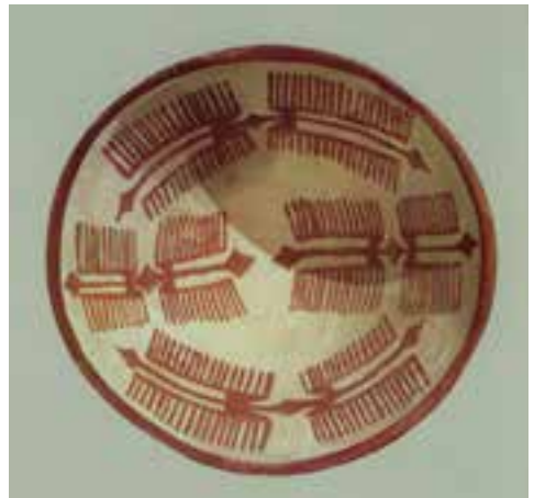
تصویر ۱۰- کاسه سفالی، تل گپ، خوزستان، حدود ۴۰۰۰ تصویر ۱۱- گلدان سفالی، مصر، تصویر ۱۲- کاسه سفالی تل سامرا، عراق، ۵۵۰۰ پیش از میلاد پیش از میلاد ۴۵۰۰

هندسی (خطوط موازی، عمودی، زیگزاگ، موجی و شطرنجی و...) بودند و این نقش‌ها با رنگ‌های سیاه یا قرمز بر روی آنها رسم می‌شدند. اندکی بعد تصویر انسان، پرندگان، چهارپایان و ستارگان نیز رایج شد (تصاویر ۱۰ و ۱۱ و ۱۲). شیوه تصویر نگاری موجودات، ساده، خلاصه شده و دو بُعدی هستند ۱ و بدن موجودات به شکل هندسی و در بعضی موارد روی اجزای بدن اغراق می‌شود (مثل شاخ‌ها)، به همین خاطر تصاویر از واقع‌نمایی و طبیعت‌گرایی به دور هستند. آثار و اشیای هنری به‌جا مانده از دوره نوسنگی در نقاط مختلف دنیا هم‌زمان نیستند و از نظر نوع با هم متفاوتند. به‌طور مثال در ایران و عراق سفال و در فلسطین مجموعه‌های یادبودی و در انگلستان سنگ افراشته‌ها (سنگ‌هایی که به‌صورت عمودی روی زمین قرار گرفته است) باقی مانده‌اند (تصویر ۱۴). در اریحا (دهکده‌ای در کشور اردن) پرستش مجموعه مانند برخی جوامع بومی آفریقا رایج بود، در این محل تعدادی سردیس آدمی که سیمایی نافذ و پر حالت دارند و به‌هزاره هفتم و ششم پیش از میلاد تعلق دارند، کشف شده است. هنرمندان اریحا مجموعه را از بقیه اسکلت جدا می‌کردند و با گچ رنگی دوباره آن را به‌شکل سر آدم در می‌آوردند و در بازسازی سعی می‌کردند که شبیه چهره صاحب آن باشد (تصویر ۱۳). سازندگان این سردیس‌ها پیشگامان هنر چهره‌سازی در دوره‌های بعد هستند.