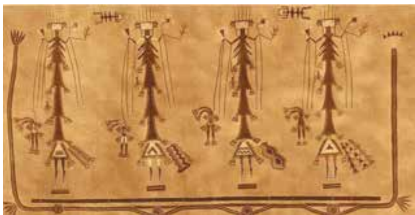
تصویر ۲۴ – نقاشی روی شن، قبیله ناواجو ۲ ، جنوب غربی آمریکا، ۱۹۰۷ میلادی