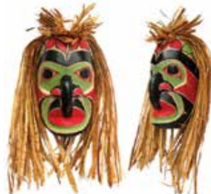
تصویر ۲۳- سمت راست، ماسک آیینی، سرخ پوستان شمال غربی آمریکا، چوب و الیاف، ۲۰۱۰ میلادی. بلندی حدود ۲۵ سانتی‌متر، گالری هنرهای زیبای بومی، سیاتل، بلندی حدود ۲۵ سانتی‌متر. وسط، ماسک به شکل سر پرنده با منقار متحرک، سرخپوستان سواحل غربی آمریکا. سمت چپ، رییس یک قبیله