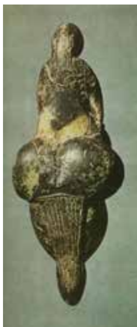
تصویر ۷- الهه لسیپوگ، Lespugue فرانسه، عاج ماموت، حدود ۲۳۰۰۰ سال پیش از میلاد

در نقاط دیگر جهان آثاری به این قدمت و پیشرفت که از نظر کمیت و کیفیت با آثار اروپایی قابل مقایسه باشد به دست نیامده است. در آسیا و ایران هم نقاشی‌ها و نقش‌کندهای (حکاکی‌های روی سنگ) پناهگاهی و صخره‌ای شناسایی شده‌اند، اما نسبت به نمونه‌های اروپایی جدیدتر و متعلق به دوره نوسنگی و بعد از آن هستند.