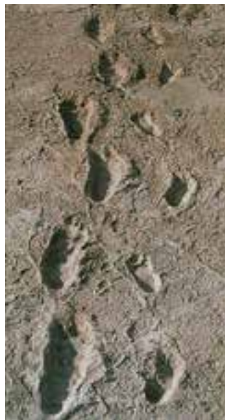
تصویر ۱- اثر رد پای انسان حدود سه و نیم میلیون سال پیش، تانزانیا، آفریقا

تاریخ هنر با این سؤال‌ها شروع می‌شود، انسان از چه زمانی به آفرینش هنری دست زد؟ چه انگیزه‌ای باعث آن بود؟ نخستین دست ساخته‌ها چه بودند؟ پاسخ روشن به این سؤال‌ها آسان نیست و هر پاسخی را باید با احتیاط پذیرفت. باستان شناسان بنا به شواهدی حضور انسان بر روی زمین را تا چند میلیون سال پیش به عقب می‌برند (تصویر ۱).