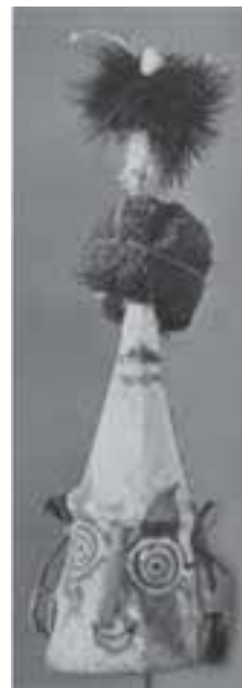
تصویر ۱۵- ماسک رقص، پارچه با تزئینات گیاهی. گینه‌نو، شمال استرالیا