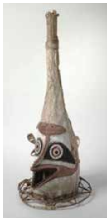
تصویر ۲۰- ماسک آیینی، الیاف گیاهی، گِل و رنگ، اوائل قرن بیستم، گینه‌نو، شمال استرالیا، بلندی حدود ۹۰ سانتی‌متر، مجموعه پاپوا (Papua)