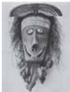
تصویر ۱۶- بالا: ماسک دیواری، نقاشی روی چوب. پایین: ماسک مراسمی، چوب با نقاشی همراه با پوشال و دانه‌های گیاهی. گینه‌نو، شمال استرالیا