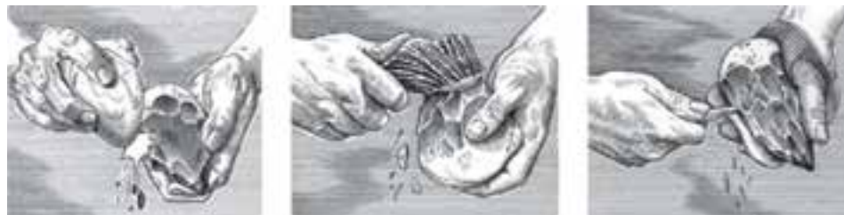
تصویر ۲- مراحل ساخت ابزارهای سنگی در دوره پارینه سنگی

گروه‌های انسان‌های غارنشین از طریق شکار و جمع‌آوری غلات زندگی می‌کردند، مردها اغلب به شکار حیوانات و زن‌ها هم به جمع‌آوری دانه‌ها و ریشه‌های گیاهان وحشی، مواظبت از کودکان و سالخورده‌گان، نگهداری آتش و پخت‌وپز می‌پرداختند. این جوامع برای ادامه زندگی به ابزار کار نیاز داشتند که مهمترین ابزار آنها سنگ بود. به همین خاطر این دوره را عصر سنگ نام‌گذاری کرده‌اند. مهمترین ابزار، سنگ‌های مُشته‌ای ۳ و نوک تیزی بود که از طریق شکستن سنگ‌های بزرگ‌تر به دست می‌آمد. در این دوره انسان با شناخت دقیق‌تر دنیای پیرامون، ساخت ابزار کارآمدتر را فراگرفت و برای تأمین نیازهای مادی تلاش بیشتری از خود نشان داد و سعی کرد خواسته‌ها و نیازهای خود را به شکل نقاشی، حکاکی روی سنگ و ساخت پیکره بیان کند و پیش از آنکه به مدد ذوق، هنرمند شود بر اثر نیاز، صنعتگر شد (تصویر ۲).