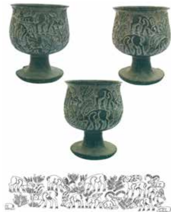
▲ شکل ۳- ظرف سنگی، تمدن جیرفت، هزاره سوم پ.م

برجسته و کاشی‌لعب‌دار، کشف شده (شکل ۲). به دلیل این توجه، علاقه به حفاری در مناطق باستانی روز به روز بیشتر می‌شود. اولین زمینه فعالیت‌های رسمی باستان‌شناسی در ایران کاوش در منطقه باستانی شوش بوده که در بین سال‌های ۳۱-۱۲۲۹ شمسی انجام پذیرفته است. پس از فعالیت گروه‌های باستان‌شناسی در ایران توسط باستان‌شناسان خارجی و داخلی آنچه به تحقق رسید آشکارسازی و شناخت فرهنگ تاریخی و ملی ایران است که همچنان ادامه دارد. از مهم‌ترین یافته‌های جدید به همت باستان‌شناسان ایرانی کشف منطقه باستان‌شناسی ناشناخته دشت لوت به‌ویژه سرزمین آرت در جیرفت با قدمتی ۵۰۰۰ ساله است. براساس آثار به دست آمده می‌توان دریافت که این منطقه تاریخی دارای رشد فرهنگی و بالنده‌ای بوده و در اواخر هزاره چهارم پیش از میلاد شکل گرفته است. با این کشف چنین به نظر می‌رسد که بایستی دید تازه‌ای نسبت به شکل‌گیری مناطق و تمدن‌های همجوار داشت (شکل ۳).