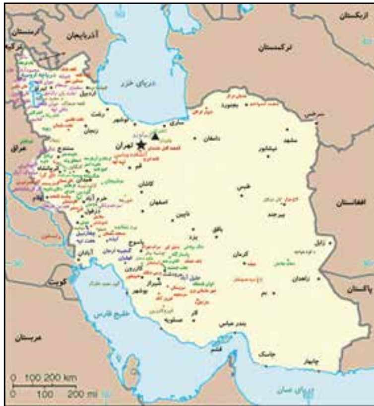
▲ شکل ۲- نقشه مناطق برجسته باستانی در ایران