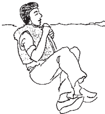
شکل ۲-۹- حالت بدن در موقع انتظار برای رسیدن کمک

۵-۱- خوردن قبل از شنا کردن: این پند قدیمی را همه شنیده اید که می گویند: بلافاصله بعد از خوردن غذا شنا نکنید. حداقل باید یک ساعت پس از خوردن غذا شنا کرد زیرا عدم رعایت این نکته ممکن است موجب گرفتگی عضلانی و نهایتاً غرق شدن گردد. پند یا نصیحت گفته شده به نظر معقول