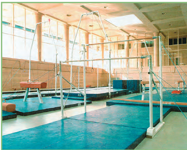
شکل ۲-۸ تجهیزات و وسایل مورد نیاز رشته‌ی ژیمناستیک