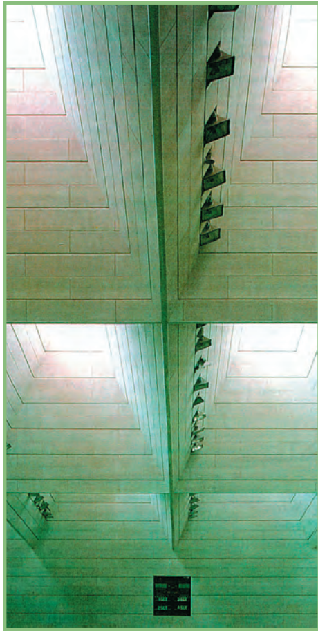
شکل ۱-۶- تلفیق نور طبیعی و مصنوعی

شرایط تأمین نور مصنوعی سالن‌ها: برای تأمین روشنایی مورد نیاز داخل سالن‌ها، به‌ویژه سالن‌های چندمنظوره، باید چراغ‌ها و پروژکتورها در خطوط (اضلاع) طولی دیوارهای سالن تعبیه شوند تا بر دید بازی‌کنان عمود نباشد و برای آن‌ها مزاحمتی ایجاد نکند. از مهتابی‌ها و نورهای ملایم هم می‌توان در سقف سالن‌ها استفاده کرد. سایر ویژگی‌ها و شرایط استفاده از نور مصنوعی عبارت‌اند از: