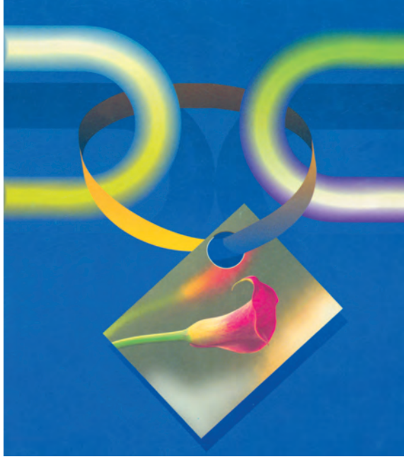
شکل ۶-۲- رابطين بهداشت