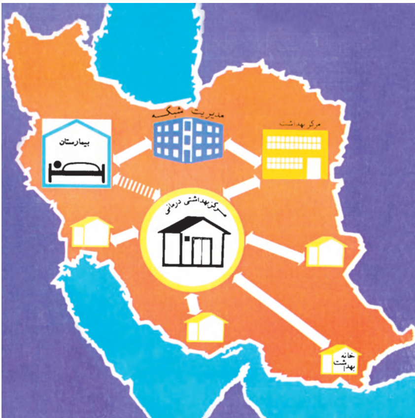
شکل ۲-۴- نظام عرضه‌ی خدمات بهداشتی

مراکز بهداشتی درمانی شهری و پایگاه‌های بهداشتی در شهرها مسئول ارائه‌ی خدمات به مردم