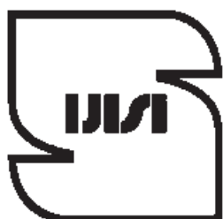
علامت استاندارد ایران

نشانگر تعهد تولید کننده یا عرضه کننده به رعایت ضوابط و قوانین و استمرار انطباق کالا با استانداردهای ملی ایران است. این علامت دارای کادر اصلی به صورت S است که هم می‌تواند گویای کلمه SAFETY (ایمنی) و هم علامت اختصاری STANDARD (استاندارد) باشد. طرح داخل نشانگر کلمه ایران است. این علامت برای کالاهایی است که از هر حیث (ایمنی و عملکرد) با استانداردهای ملی ایران مطابقت دارند. در صورت وارونه کردن علامت، نام اختصاری مؤسسه استاندارد و تحقیقات صنعتی ایران به زبان انگلیسی (isiri) مشاهده می‌شود.