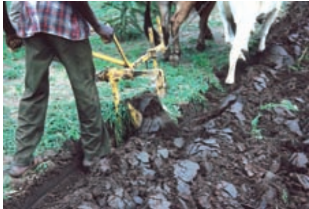
شکل ۲-۵- استفاده از دام برای شخم زدن زمین

مرحله بعد با کشف فلز و در نهایت آهن به وقوع پیوست. لذا انسان برای ساخت ابزار از آهن استفاده کرد و گاو آهن به وجود آمد. نام گاو آهن برگرفته از نام دامی که آن را می کشید (گاو) و جنس ابزار ساخته شده یعنی آهن بود.