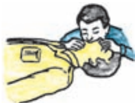
شکل ۱-۳- روش دهان به دهان

ریه‌ی مصدوم خارج شود، بینی را رها کنید و به آرامی به قفسه‌ی سینه‌اش فشار آورید. این عمل را آنقدر تکرار کنید تا مصدوم بتواند نفس بکشد. تناوب دم و بازدم بایستی با تنفس شخص کمک‌دهنده هم زمان باشد (شکل ۱-۳).