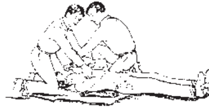
شکل ۱-۲- تنفس مصنوعی روش سیلوستر

ریه‌ی مصدوم خارج شود، بینی را رها کنید و به آرامی به قفسه‌ی سینه‌اش فشار آورید. این عمل را آنقدر تکرار کنید تا مصدوم بتواند نفس بکشد. تناوب دم و بازدم بایستی با تنفس شخص کمک‌دهنده هم زمان باشد (شکل ۱-۳).