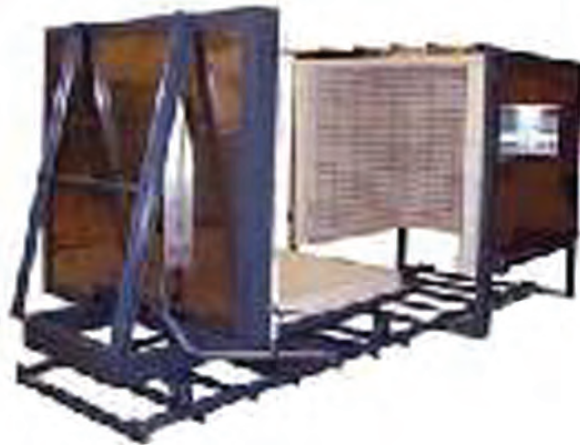
شکل ۱-۵- خشک کن متناوب

از خشک کن های متناوب، اغلب در جاهایی استفاده می شود که ظرفیت تولید پایین می باشد. انرژی گرمایی مورد نیاز این نوع خشک کن ها معمولاً از انرژی گرمایی مازاد کوره های پخت سرامیک تأمین می گردد. نیاز به تعداد بیشتر نیروی انسانی در چیدمان و راه اندازی خشک کن های متناوب و مصرف انرژی گرمایی زیاد در مقایسه با خشک کن های مداوم، از نقاط ضعف عمده ی آنها محسوب می شود (شکل ۱-۵).