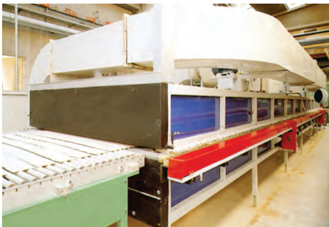
شکل ۲-۵- خشک‌کن مداوم صنعت کاشی

در کارخانجات انرژی گرمایی مورد نیاز این نوع خشک‌کن‌ها، انرژی گرمایی هم از انرژی مازاد کوره‌های پخت سرامیک و هم از منبع جدا و اختصاصی، تأمین می‌گردد (شکل‌های ۲-۵ و ۳-۵).