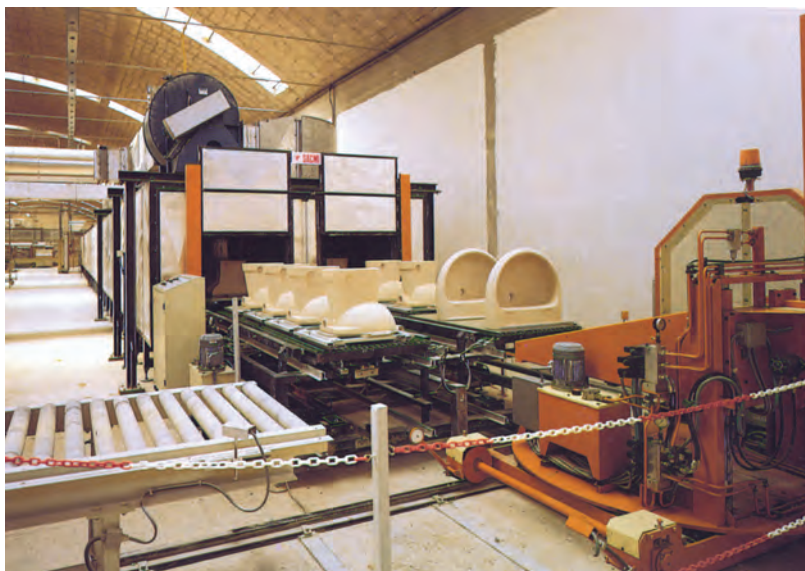
شکل ۳-۵- خشک‌کن مداوم برای چینی بهداشتی

۱-۳-۵ - خشک‌کن‌های عمودی: خشک‌کن‌های عمودی، کانال‌هایی هستند که محصولات سرامیکی در آن‌ها برای خشک شدن، از پایین تا ارتفاع بالا حرکت می‌کنند. به عبارت دیگر، محصولات سرامیکی در داخل محفظه‌ی خشک‌کن به طور قائم به طرف بالا حرکت می‌کنند، سپس به طرف پایین هدایت می‌شوند، و در اثر قرار گرفتن در معرض گرمای ناشی از دمنده‌های هوای داغ، خشک می‌شوند.