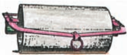
شکل ۵-۳- غلتک معمولی صاف

پره غلتک داخل شیار قرار می گیرد که ضمن فشردن داخل شیارها