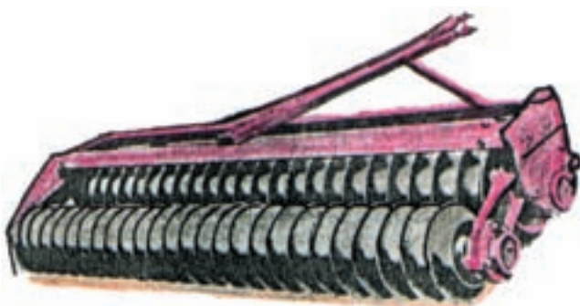
شکل ۵-۴- غلتک پره‌ای دو ردیفه