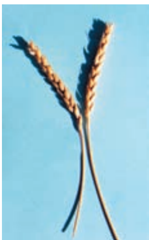
شکل ۳۰-۱- سفیدک