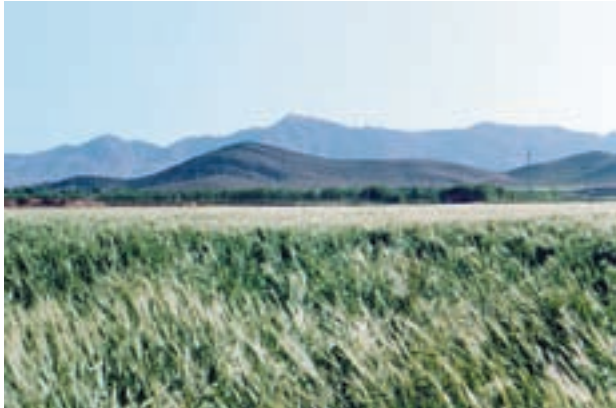
شکل ۵۲-۱- خوابیدگی در گندم