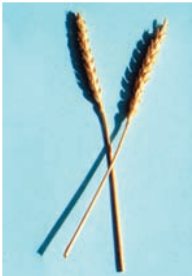
شکل ۱-۳۴ - بزوستایا

گندم بزوستایا: اصل آن از کشور شوروی سابق است. سنبله آن ریشک دار گلوم بدون کرک و سفیدرنگ است. ارتفاع بوته متوسط، رنگ دانه قرمز می باشد. گندمی است پاییزه، متوسطرس، مقاوم در برابر خوابیدگی، ریزش، سرما، زنگ زرد و شوری. خاصیت نانوایی این گندم خوب، پروتئین آن بالا و از نوع مرغوب است (شکل ۱-۳۴).