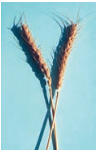
شکل ۲۹-۱- شاه‌پسند

گندم شاه‌پسند: سنبله ریشک‌دار، اندازه بوته بلند، رنگ دانه سفید مایل به قرمز، گندمی پاییزه، دیررس، مقاوم در برابر ریزش و خوابیدگی و نسبت به زنگها و سیاهکها و خشکی حساس است. ارزش نانوایی آن خوب نیست. (شکل ۲۹-۱)