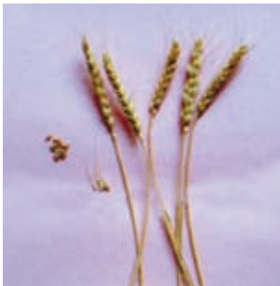
شکل ۱-۳۱ - گندم بکراس - روشن

پیمانۀ مهارتی: انتخاب ارقام مناسب گندم و جو برای کشت شماره شناسایی: ۱۱-۱-۷۴/ک