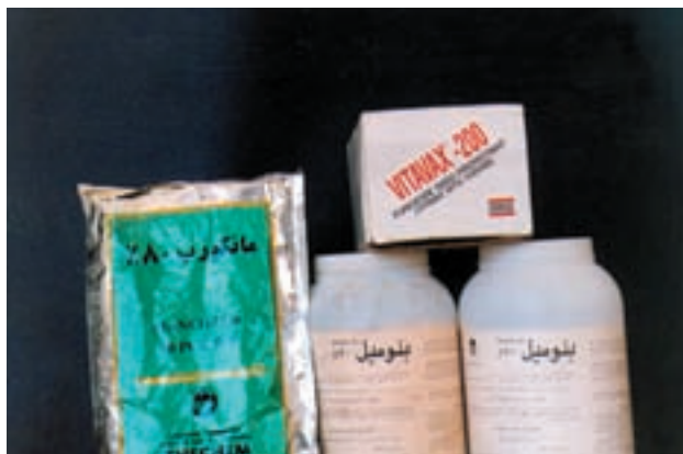
شکل ۱-۵۹- انواع سموم ضد عفونی کننده گندم

مهارت: کشت گندم و جو شمارۀ شناسایی: ۱۱-۱-۷۴/ک