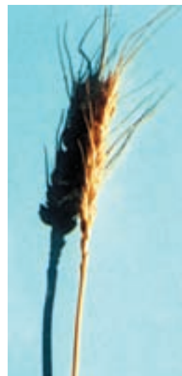
شکل ۱-۴۸ - کرج ۲