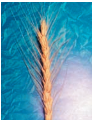
شکل ۱-۳۵ - گندم اینیا ۶۶

پیمانۀ مهارتی: انتخاب ارقام مناسب گندم و جو برای کشت شماره شناسایی: ۱۱-۱-۷۴/ک