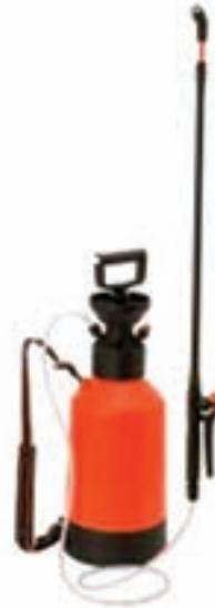
شکل ۲۶-۳- سم پاش استوانه‌ای پشتی ساده

کار، سم پاشی کنید. نکته مهم این است که در جریان سم پاشی با این سم پاش، باید تلمبه زنی را به صورت یک نواخت تکرار کنید تا فشار افت نکند (شکل ۲۷-۳).