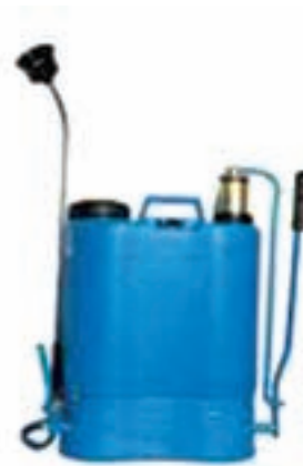
شکل ۲۷-۳- سم پاش کتابی پشتهی اهرمی