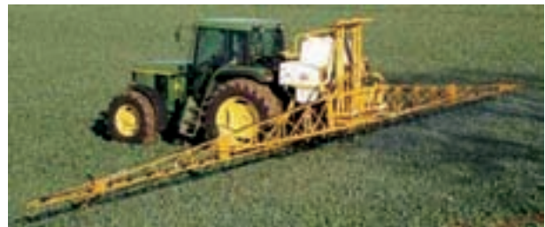
شکل ۳۱-۳- سم‌پاش پشت تراکتوری بوم‌دار

لازم است سالیانه حداقل یک بار سم‌پاش را، چنان‌که توضیح داده شد، برای تنظیم میزان خروجی، کالیبره نمایید. از این نوع سم‌پاش در ایران برای مبارزه با علف‌های هرز مزارع بزرگ استفاده می‌شود (شکل ۳۱-۳).