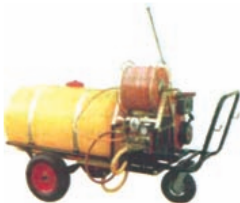
شکل ۳۰-۳- سم‌پاش فرغونی

عدد است و شیلنگ و لانس بر سر آن نصب می‌شود. برای سم‌پاشی علف‌های هرز مزارع، سم‌پاش را در بیرون مزرعه قرار می‌دهند و حدود ۵۰ تا ۱۰۰ متر شیلنگ را به آن اضافه می‌نمایند. سپس به همراه ۲ تا ۳ نفر، این شیلنگ‌ها را به داخل مزرعه برده و سم‌پاشی را انجام دهید (شکل ۳۰-۳).