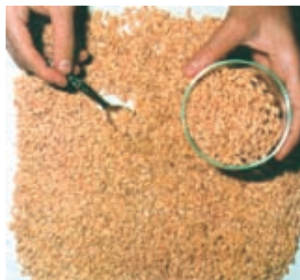
شکل ۲۰-۳- بذور عاری از علف هرز

الف) استفاده از بذور عاری از بذور علف هرز (شکل ۲۰-۳):