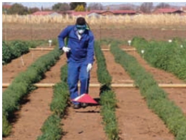
شکل ۲۳-۳- کنترل علف‌های هرز با استفاده از گرما

۴-۸-۳- کنترل فیزیکی علف‌های هرز: برای کنترل فیزیکی علف‌های هرز از گرما و آتش استفاده می‌شود. (شکل ۲۳-۳).