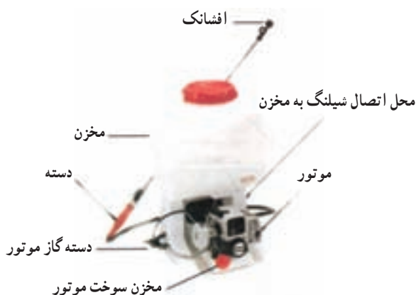
شکل ۲۸-۳- سم‌پاش موتوری پشتی لانس‌دار