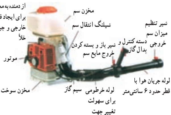
شکل ۲۹-۳- سم‌پاش موتوری پشتی اتومایزر

از دمنده به مخزن برای ایجاد فشار خارجی و جبران خلأ