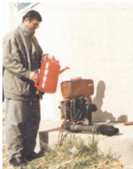
شکل ۲۴-۳- پر کردن مخزن شعله افکن