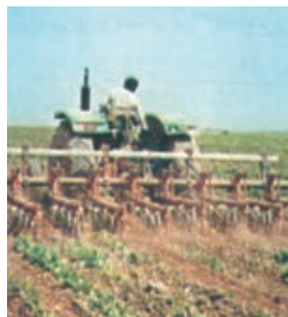
شکل ۲۲-۳- وجین علف‌های هرز با استفاده از ماشین مرکب سله‌شکنی و وجین‌کن

۳- تراکتور را طوری وارد مزرعه کنید که چرخ‌های آن در بین ردیف‌ها قرار گیرد و به گیاه اصلی صدمه وارد نسازد. تراکتور را به طور اصولی و صحیح و با سرعت مناسب، در مزرعه به حرکت درآورید تا عمل سله‌شکنی و وجین انجام شود (شکل ۲۲-۳). گزارش کار این فعالیت‌ها را به مربی خود تحویل دهید.