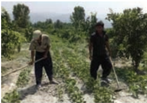
شکل ۲۱-۳- وجین علف‌های هرز با استفاده از وسایل دستی

۴- علف‌های هرز را از محصول اصلی تشخیص دهید و آنها را با استفاده از ابزار، از خاک خارج کنید (شکل ۲۱-۳).