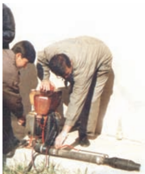
شکل ۲۵-۳- آماده سازی و روشن کردن شعله افکن

۷- گاز دستگاه را به میزان مورد نیاز تنظیم نمایید.