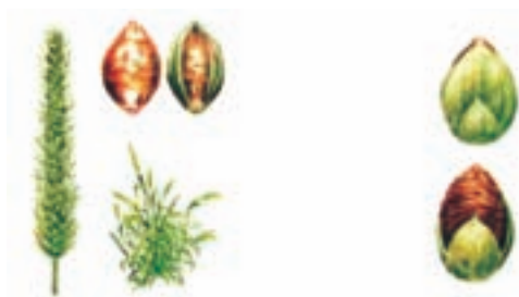
شکل ۱۷-۳- علف هرز دم روباهی که دارای بذرهایی با سطح خشن و ناهموار است و به این علت به بدن جانوران می‌چسبد و جابه‌جا می‌شود.

۳- جانوران: دام از عوامل حفظ و انتشار علف‌های هرز است. دام‌های وحشی و اهلی هر دو در پراکنش بذور علف‌های هرز دخالت دارند. پرندگان از بذور علف‌های هرز تغذیه می‌کنند و سبب انتشار آنها می‌شوند. از جمله این بذور، بذور گل تاج‌ریزی و عشقه را می‌توان نام برد. پرندگان، همچنین برای لانه‌سازی از ریشه و ریزوم گیاهان استفاده می‌کنند و باعث انتشار علف‌های هرز می‌شوند. بعضی از بذور هم به دلیل داشتن قلاب، کرک، خار یا دارا بودن سطحی خشن و ناهموار به بدن پرندگان یا به بدن و کرک و پشم حیوانات دیگر می‌چسبند و از محلی به محل دیگر منتقل می‌شوند. بذورهای جو موشی، توق و دم روباهی به این طریق پراکنده می‌شوند (شکل ۱۷-۳).