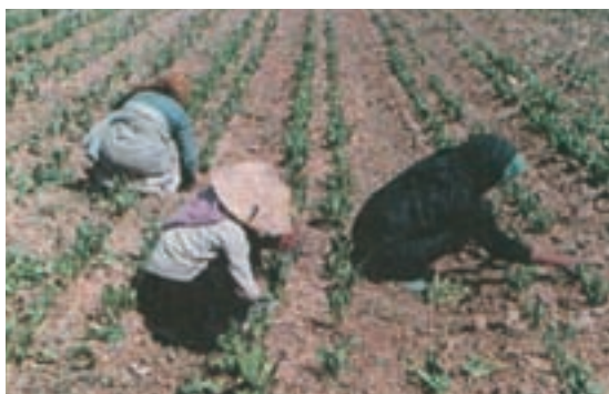
شکل ۱۵-۳- وجین علف‌های هرز توسط کارگران

وسیله‌ای که باشد دارای هزینه قابل توجهی است (شکل ۱۵-۳).