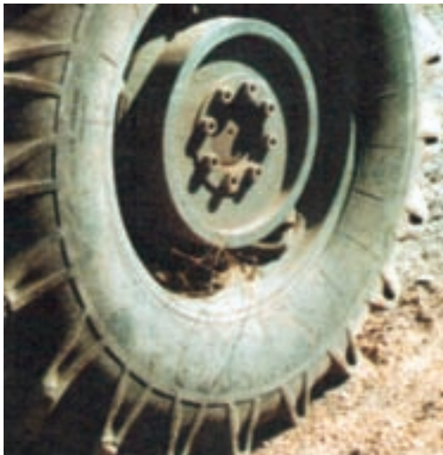
شکل ۱۹-۳- بوتۀ علف هرز که روی چرخ ماشین کشاورزی قرار می گیرد و با آن جابه جا می شود.

بازدید ۳-۳ : همراه با مربی خود از دامداری هایی که دام خود را برای تعلیف به مزارع یا باغ ها می برند بازدید نمایید. روی بدن دام ها، مخصوصاً لابه لای پشم و موهای بدن آنها را بازدید کنید و بذر علف های هرز یا قسمتی از بوتۀ آنها را بیابید.