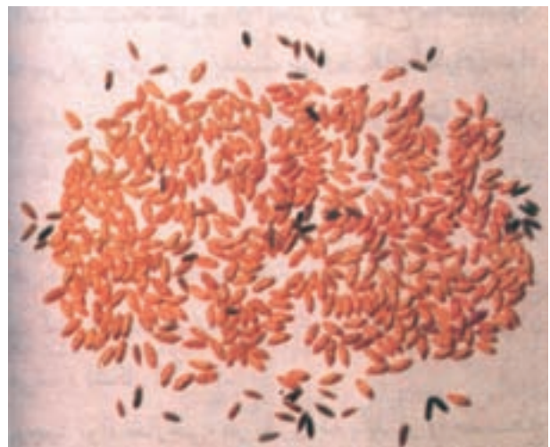
شکل ۱۸-۳- بذر چاودار در بین بذور گندم

۱- کود دامی کاملاً پوسیده و کود دامی تازه را به کمک فرغون در دو کرت جداگانه به مساحت ۵۰ متر مربع از مزرعه روی