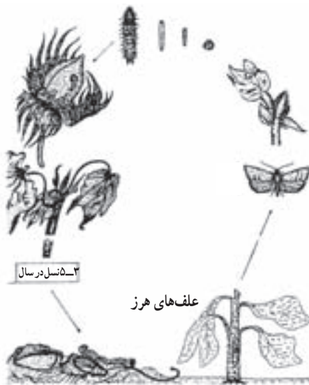
شکل ۱۶-۳- چرخه زندگی کرم خاردار پنبه. کرم خاردار پنبه قسمتی از زندگی خود را روی علف‌های هرز می‌گذراند.

پنبه نمونه‌هایی از این گروه‌اند (شکل ۱۶-۳).