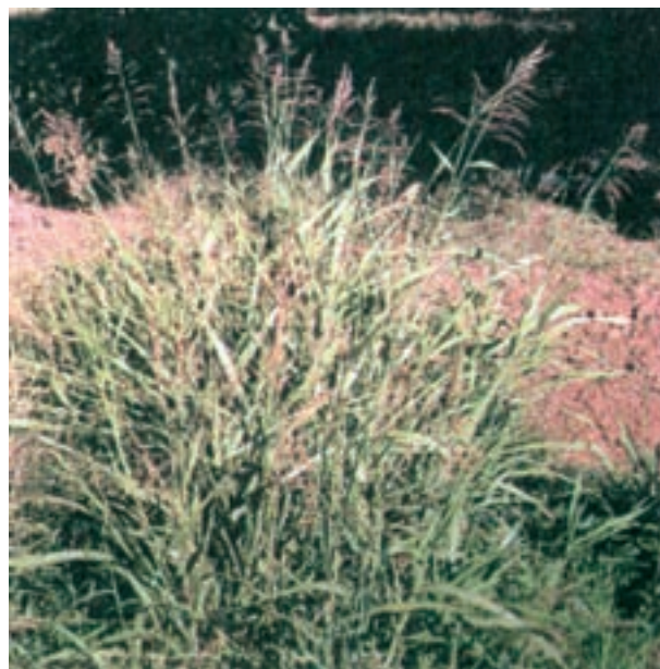
الف - قیاق