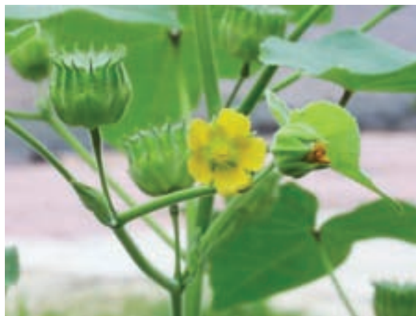
شکل ۹-۳- علف هرز گاو بنبه