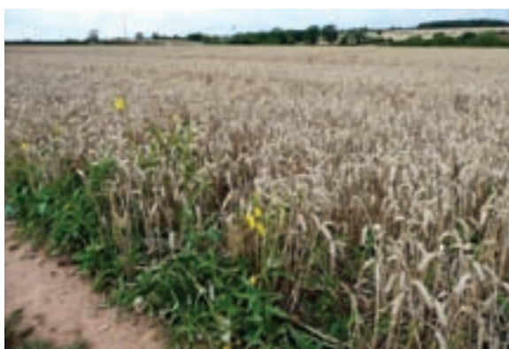
شکل ۳-۲- رویش علف‌های هرز در خاک‌های نامناسب حاشیه مزرعه

۳- علف‌های هرز بذر بسیار زیادی تولید می‌کنند. برای مثال، تعداد بذر در یک بوته سلمه‌تره (سلمک) به ۷۲۰۰۰ و در تاج خروس به ۱۱۷۴۰۰۰ عدد می‌رسد (شکل ۳-۳).