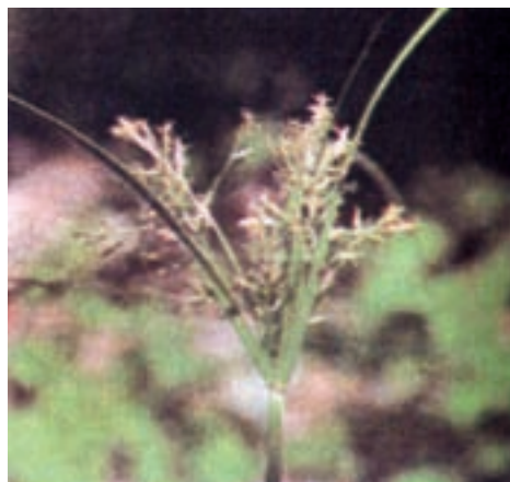
ب - اویارسلام