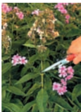
شکل ۵-۹- ب