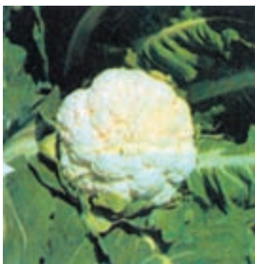
شکل ۸-۱- گل کلم

پاره‌ای از سبزیجات مانند کرفس، گل کلم، ریواس، مارچوبه و ... باید قبل از مصرف سفید گردند تا از نظر طعم و لطافت قابل استفاده شوند. برای این منظور باید به طرق مختلف از رسیدن نور خورشید به قسمت مورد نظر جلوگیری نمود که این عمل را «سفید کردن» می‌گویند (شکل‌های ۸-۱ و ۸-۲).