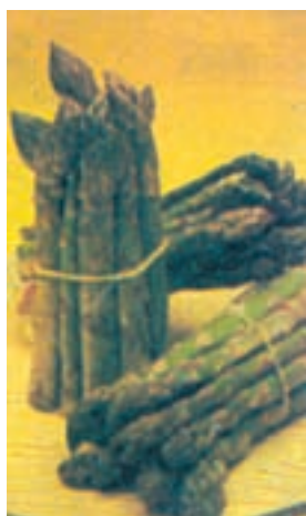
شکل ۸-۲- مارچوبه