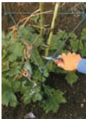
شکل ۵-۹- الف

– عمل سربرداری در بعضی از گل‌های زینتی و آپارتمانی نیز که در سال یک شاخه گل دهنده تولید می‌کنند مرسوم است. در این گیاهان به محض مشاهده ساقه گل دهنده جدید بلافاصله ساقه سال قبلی را قطع می‌کنند. مانند: الف) فلوکس