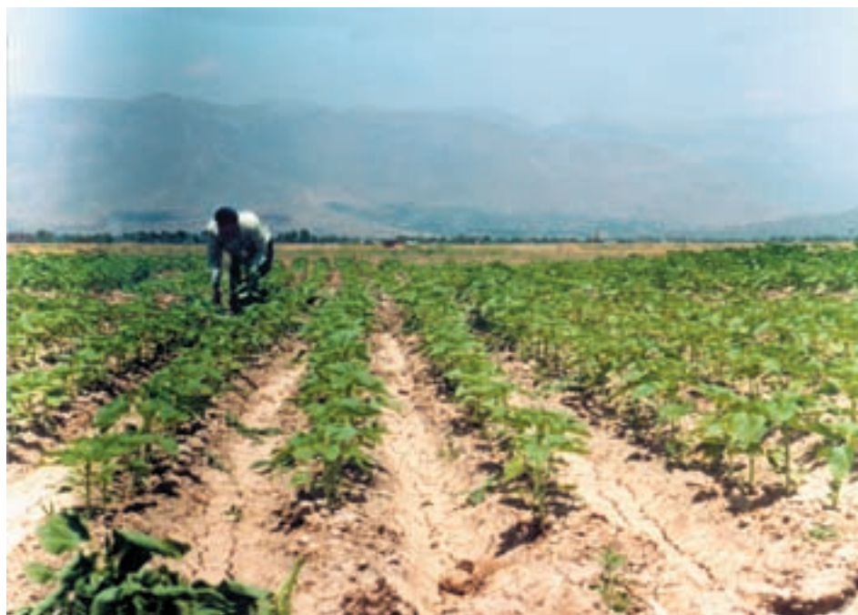
شکل ۵-۵- مزرعه‌ای که عملیات واکاری و تنک به موقع صورت گرفته و تراکم مطلوب ایجاد شده است.

اگر در انتخاب بذر، آماده‌سازی، تنظیم ماشین کارنده و آبیاری اول به دقت و ظرافت عمل کرده باشید معمولاً نیازی به این عملیات نخواهد بود.