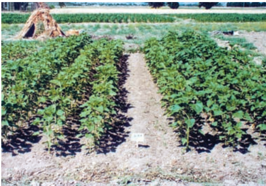
شکل ۹-۵- مزرعهای که عملیات داشت، به‌درستی و به موقع در آن صورت گرفته است.

علفهای هرز زراعت آفتابگردان را شناسایی کنید: در مناطق مختلف و در یک منطقه در زراعتهای مختلف، علفهای هرز متفاوتی وجود دارند. به بیان دیگر، یک علف هرز در همه شرایط از نظر تعداد، تنوع و خسارت یکسان عمل نمی‌کند. بنابراین، کار درست آن است که علفهای هرز مهم منطقه را شناسایی نموده، آنها را از نظر درجه اهمیت و خسارت برای محصول مورد کاشت درجه‌بندی کنید. تحقیق کنید: با مراجعه به مزارع اطراف محل سکونت خود: