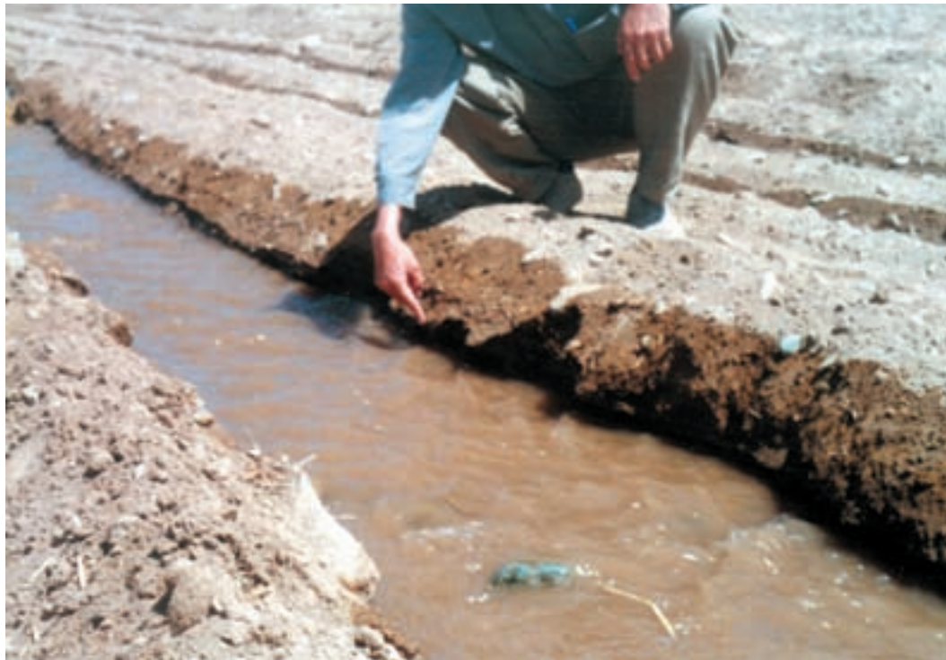
شکل ۱-۵– نهر اصلی آبیاری مزرعه در بالا دست زمین

۲۱– آبیاریهای بعدی را با توجه به نظام حق آبه و عرف منطقه انجام دهید.