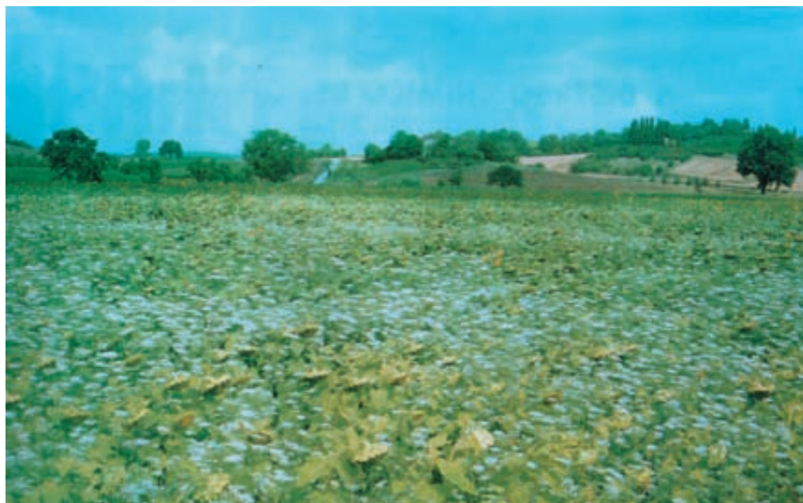
شکل ۷-۵ مزارع آفتابگردان که علفهای هرز آن کنترل نشده است.