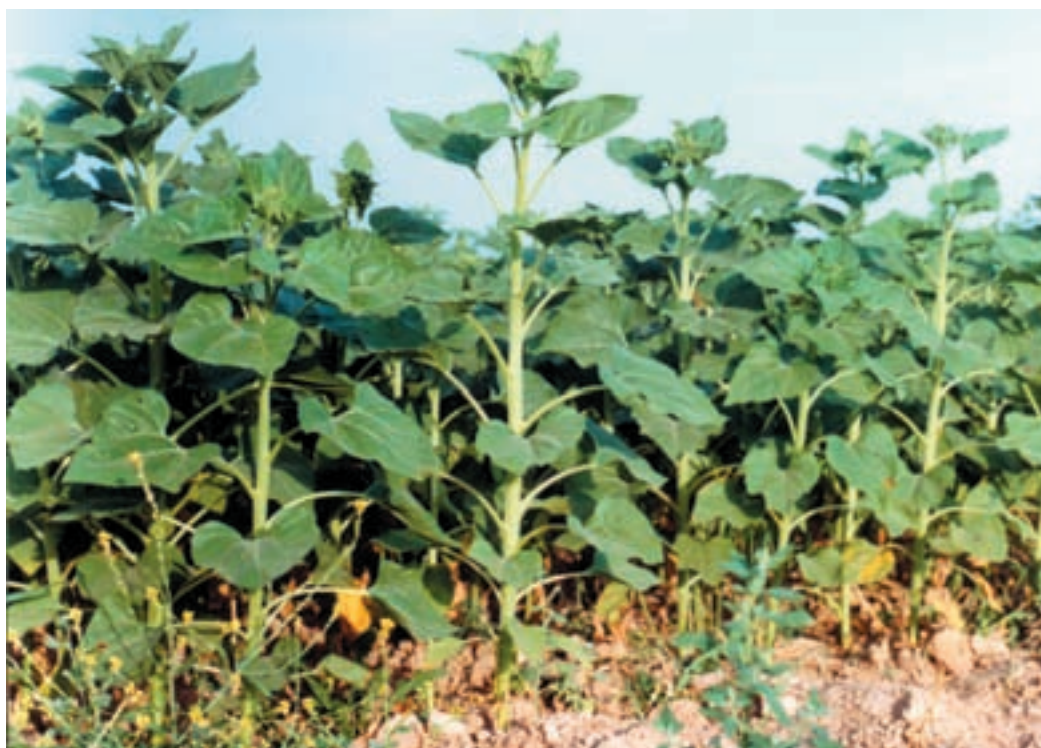
شکل ۱۰-۵- پس از کامل شدن پوشش گیاهی، آفتابگردان بر علفهای هرز غلبه پیدا می‌کند.