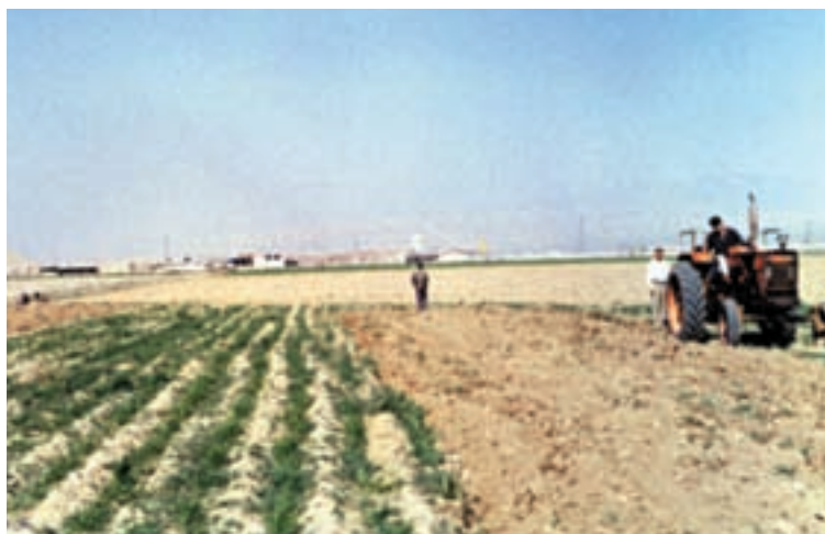
شکل ۲-۳- کاهش تراکم علفهای هرز و افزایش ماده آلی خاک با اجرای شخم پس از رویش بذور موجود در زمین

نیاز به اندازه‌گیری مجدد نیست. در این صورت، نتایج آزمایش‌ها را فراهم آورید.