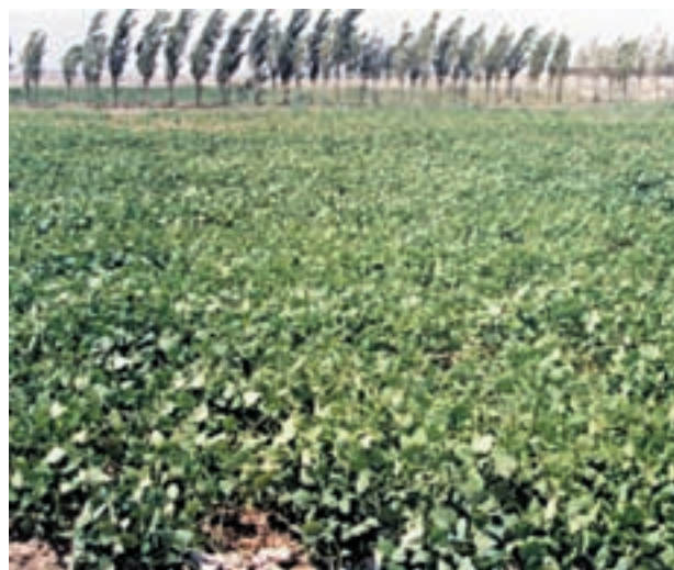
شکل ۴-۳- ماش یکی از بهترین گیاهان قابل استفاده به عنوان کود سبز است.

پاسخ دهید: کود سبز علاوه بر افزایش مواد آلی خاک، چه محاسنی دارد؟ بحث کنید: آیا هر گیاه برای تهیه کود سبز مناسب است؟ چرا؟