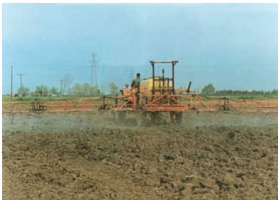
شکل ۱۱-۳- مصرف علف‌کش قبل از کاشت در اغلب شرایط، مطلوب و مقرون به صرفه است.

مقدار سم را فقط کارشناسان حفظ نباتات تعیین می‌کنند.