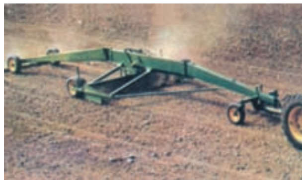
شکل ۱۰-۳- هموار بودن زمین در آبیاری نقشی بسیار ضروری است.

گزارش دهید: از مجموع عملیات خاک ورزی ثانویه در پنبه گزارش کار ارائه دهید.