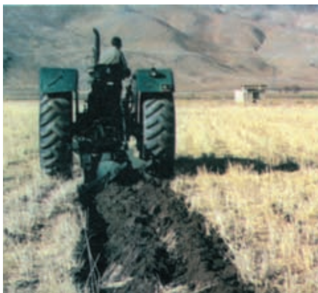
شکل ۱-۳- زیر خاک کردن کلس یکی از راههای افزایش ماده آلی خاک است.

درصد مواد آلی در آنها کم است. از این رو، یکی از توصیه‌های مهم در زراعت پنبه، قراردادن آن در اول تناوب و پس از مصرف کود دامی به مقدار کافی یا کود سبز می‌باشد. در صورت فراهم بودن شرایط رویش گیاهانی چون شبدر، باقلا، ماشک و ... می‌توان آنها را در فاصله بین دو کاشت یا حتی اگر این دو کاشت متوالی پنبه باشد اقدام به افزایش مواد آلی و حاصلخیزی خاک نمود. ضمن آن که این گیاهان با ایجاد پوشش مناسب در سطح خاک، مانع از فرسایش آن می‌گردند.