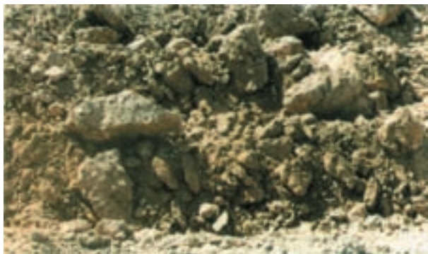
شکل ۵-۳- تنظیم نبودن و رعایت نکردن شرایط اجرای شخم باعث عدم تأمین اهداف شخم می‌شود.

در فرآیند آماده‌سازی زمین یا تهیه‌ی بستر مناسب کاشت، شخم یکی از مهمترین مراحل است. اجرای شخم بدون رعایت زمان، شرایط و عمق مناسب، نه تنها ممکن است هدفهای شخم را تأمین نکند، امکان دارد به احتمال زیاد خسارات زیادی به زمین و زارع وارد آورد. اصول کلی شخم را در مهارت آماده‌سازی زمین فراگرفته‌اید. بنابراین در این جا، صرفاً به ویژگی‌هایی از شخم که با زراعت پنبه مرتبط است، پرداخته می‌شود.