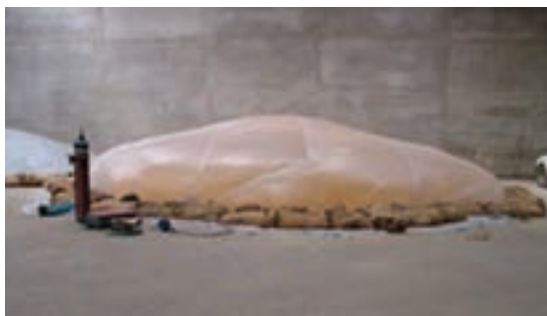
شکل ۳-۴- هوادهی مواد خوراکی

تا آلوده نبودن آن به حشرات، کنه‌ها و آفات محرز گردد. علاوه بر این حداقل هر هفته یک بار محتوی انبار را از نظر وجود احتمالی آفات و امراض بازرسی کنید و در صورت لزوم نمونه‌هایی از آن را برای آزمایش به آزمایشگاه بفرستید.