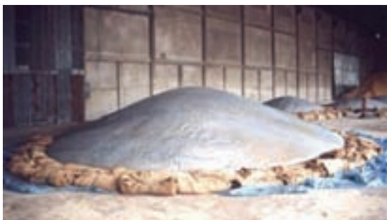
شکل ۲-۴- نحوه نگه‌داری مواد در انبار