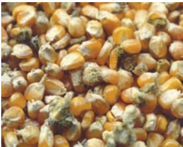
شکل ۴-۷- دانه های ذرت آلوده

۲-۴-۵- درجه بندی مواد اولیه : مواد اولیه ای که در دان طیور استفاده می کنید باید از مواد خوراکی درجه یک باشد و هیچ گونه آلودگی قارچی نداشته باشد. هم چنین این مواد باید سالم و بدون شکستگی باشد، زیرا شکسته بودن این مواد زمینه آلوده شدن به قارچ ها را فراهم می کند. مواد اولیه شکسته ایجاد خاک می کند و جزء مواد درجه پایین است.