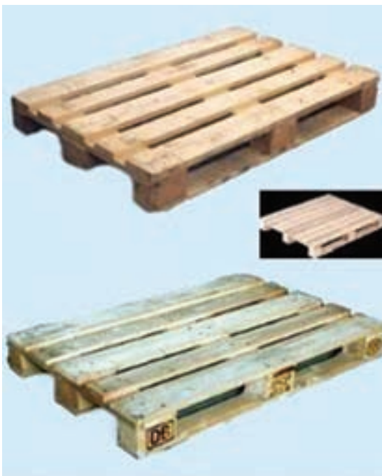
شکل ۱-۴- پالت چوبی