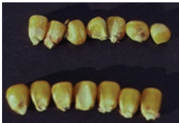
شکل ۴-۴- شناسایی ظاهری مواد خوراکی