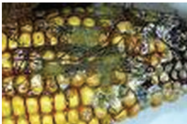
شکل ۴-۶- بلال کپک زده

۱-۴-۶- قارچ کش ها و روش های استفاده از آنها : جداسازی و تمیز کردن، اولین اقدام برای کنترل مواد آلوده به شمار می رود. در مرحله بعد و در صورت وجود آلودگی از قارچ کش ها استفاده نمایید.