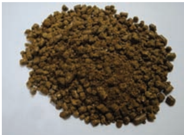
شکل ۱۱-۲ کنجاله کلزا (کانولا)

کنجاله تخم پنبه: کنجاله تخم پنبه فرآورده باقیمانده از روغن کنسی تخم پنبه است. تخم پنبه دارای گوسیپول است که در گلهای تخم گذار اهمیت دارد، زیرا در سفیده و زرده تخم مرغ ایجاد رنگ می کند. به هنگام استفاده از کنجاله تخم پنبه در جیره، تغییر رنگ زرده را به صورت لکه های سبز تا سیاه، بسته به مدت زمان انبارداری آن، مشاهده خواهید کرد.