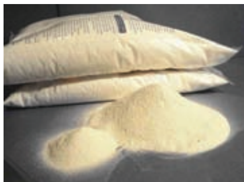
شکل ۱۸-۲- دی‌کلسیم فسفات

مقدار کلسیم و فسفر دی‌کلسیم فسفات ۲۲ و ۱۸/۷ درصد است و مقدار کلسیم و فسفر منو کلسیم فسفات ۱۶ و ۲۱ درصد است.