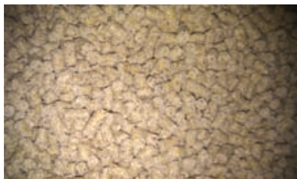
شکل ۹-۲- کنجاله سویا

مقدار انرژی کنجاله سویا ۲۲۳۰ کیلوکالری و پروتئین آن ۴۴ درصد است. مقدار کلسیم و فسفر کنجاله سویا ۲۹٪ و ۲۷٪ درصد است.