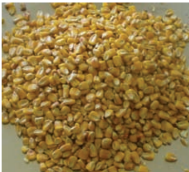
شکل ۱-۲- دانه ذرت

اگر از ذرت به مقدار زیاد و برای مدت طولانی در جیره طیور استفاده شود، به دلیل گزانتوفیل (رنگ‌دانه زرد) موجود در آن، چربی لاشه زرد می‌شود.