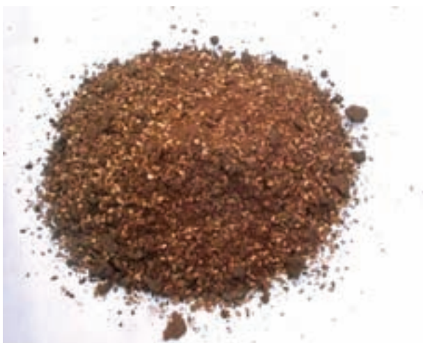
شکل ۱۳-۲ کنجاله کنجد

مقدار انرژی قابل سوخت و ساز و پروتئین کنجاله کنجد ۲۲۱۰ کیلوکالری و ۴۳ درصد است. مقدار کلسیم و فسفر قابل استفاده ۱/۹۹ و ۳۴/۰ درصد است.