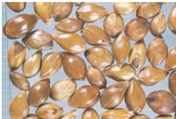
شکل ۲-۲- دانه ذرت خوشه‌ای

گندم: در بیشتر کشورها از گندم برای تهیه نان و به مقدار کمتری برای منبع انرژی در تغذیه طیور استفاده می‌شود. گندم‌ها به انواع نرم و سخت طبقه‌بندی می‌شوند. میزان انرژی گندم، ۳۱۲۰ کیلوکالری و میزان پروتئین آن از ۱۰ تا ۱۵ درصد متغیر است. میزان کلسیم و فسفر قابل استفاده گندم ۰/۵٪ و ۱۱٪ درصد است. با وجود این که گندم نسبت به ذرت حاوی پروتئین بیشتری است و انرژی آن هم اندکی از ذرت کمتر است اما به دلیل این که حاوی سطوح بالایی از گلو تن است، که به چسبندگی مدفوع و کاهش هضم در طیور منجر می‌شود، میزان مصرف آن محدودتر است. با استفاده از آنزیم‌ها می‌توان چسبندگی گندم را کاهش داد و قابلیت هضم پلی‌ساکاریدهای آن را افزود.