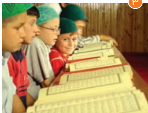
انس با قرآن کریم در کشورهای ترکیه ①، هلند ②، یونان ③ و انگلستان ④