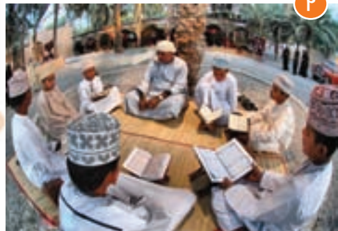
انس با قرآن کریم در کشورهای امارات (۱)، عمان (۲) و کویت (۳)