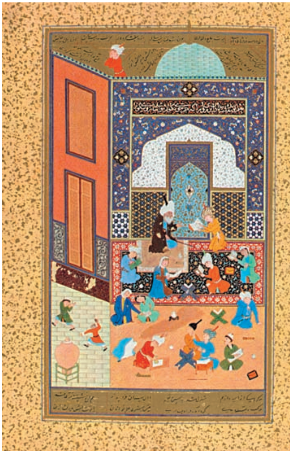
لیلی و مجنون در مکتب (مینیاتور)