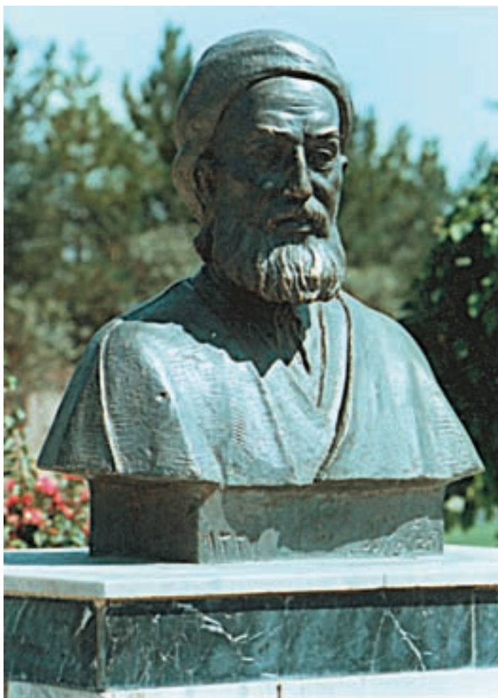
نیم تنه‌ای از خیام نیشابوری

قالب ترانه را خیام ابداع نکرده است اما اگر بگوییم که نام بردارترین ترانه‌ها در ادب فارسی به نام او ثبت شده است، گزافه نگفته‌ایم. تعداد ترانه‌هایی که واقعاً از خیام است نباید چندان زیاد باشد اما بعد از خیام، در مجموعه‌ها و کتاب‌ها، مقدار زیادی رباعی به او نسبت داده شده که بسیاری از آن‌ها قطعاً از شاعر دردمند و کم‌سخن نیشابور نیست. گویی هر کس حرفی اعتراض‌آمیز و تردید برانگیز و غیر قابل تحمل داشته که خود جرئت پذیرفتن عواقب آن را نداشته است، آن را به خیام نسبت داده است. تذکره‌نویسان و شعر دوستان هم هر جا چنین ترانه‌هایی را یافته‌اند، بی‌آن که نام سراینده‌گان آن‌ها را بدانند، آن‌ها را به نام خیام ثبت کرده‌اند. رباعیات خیام از دیرباز به زبان‌های خارجی ترجمه شده و او را در ادبیات مغرب‌زمین،