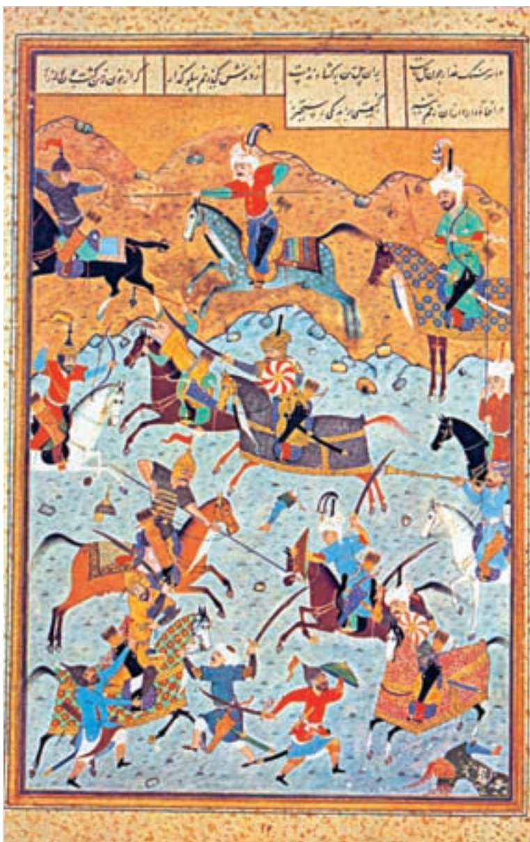
جنگ دارا با اسکندر (مینیاتوری از اسکندرنامه‌ی نظامی)

کاست؛ بلکه، برعکس باید گفت دولت جاویدی که در قلمرو داستان سرایی فارسی برای وی به دست آمده، امروز هم چون گذشته پاینده و شکوهمند مانده است. زندگی این سخن سرای بزرگ سرانجام در تنهایی و گوشه نشینی، به سال ۶۰۸ ه.ق. به سر آمد و او را در شهر گنجه به خاک سپردند. نمونه‌هایی از شعر او را می‌آوریم.