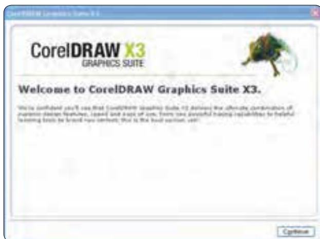
شکل ۱-۱ کادرمحاوره راهنمای نصب

در کادرمحاوره بعدی، شماره سریال (Serial Number) را در بخش 'Already have a Trial serial number?' از محتوای CD پیدا کرده و در کادر متنی مربوطه وارد کنید. سپس روی دکمه Continue کلیک کرده و وارد کادرمحاوره بعدی شوید (شکل ۱-۲).