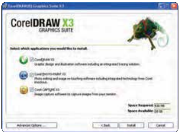
شکل ۱-۳ پنجره راهنمای نصب