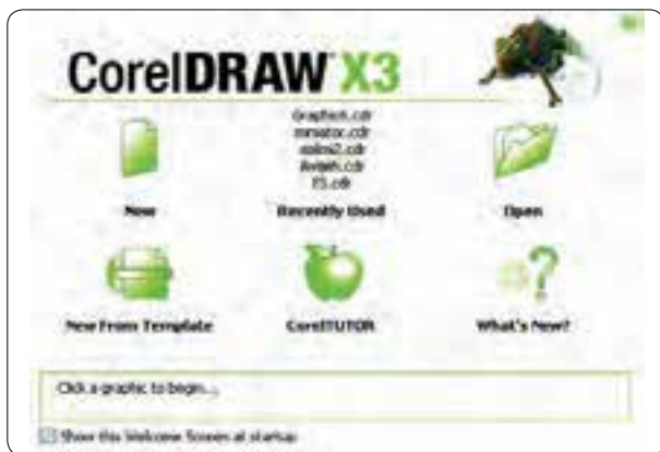
شکل ۴-۱ کادر محاوره خوشامدگویی

از مسیر Start/All Programs/Corel Graphics Suite X3 روی آیکن Corel DRAWX3 کلیک کنید تا نرم‌افزار اجرا شود. با اجرای نرم‌افزار، در ابتدای ورود به برنامه کادر محاوره خوشامدگویی (Welcome screen at startup) ظاهر می‌شود (شکل ۴-۱).