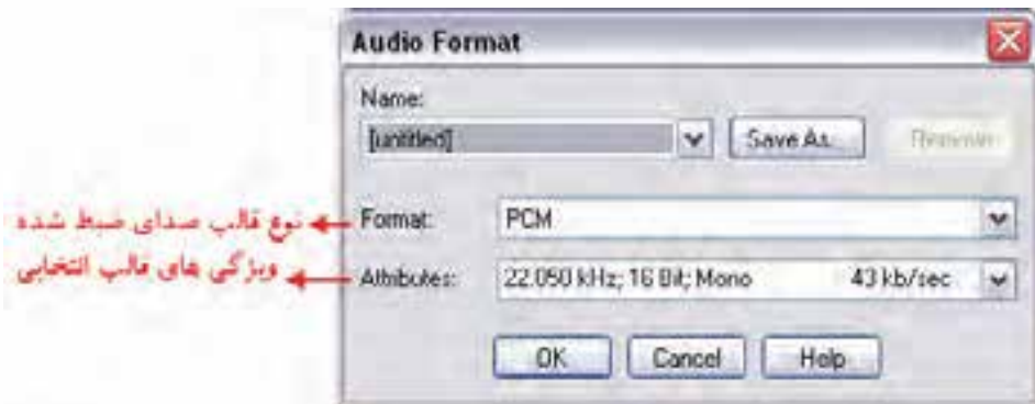
شکل ۴-۷ کادر محاوره Audio Format

در پنجره ی Output Properties می توان سخت افزار ورودی صدا را نیز تعیین کرد؛ برای این منظور، روی دکمه ی Audio Setup کلیک کرده تا کادر محاوره ای Audio Format باز شود. (شکل ۴-۷)