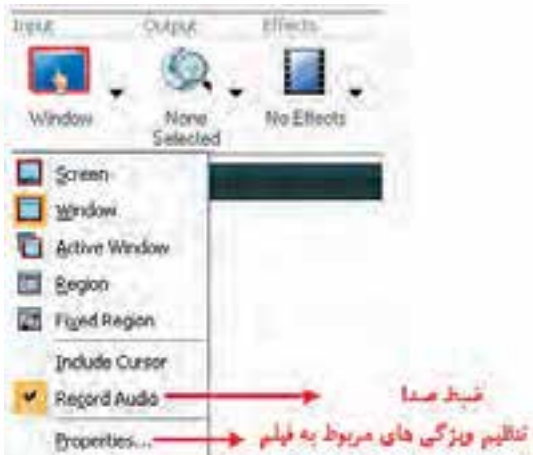
شکل ۲-۴ لیست بازشوی Input

در این بخش می‌توانید تنظیمات مربوط به منطقه‌ی ورودی Capture که شامل گزینه‌های Screen، Window، Active Region، Fixed Region و Window است و در قسمت‌های قبل به‌طور کامل در مورد آنها صحبت کردیم را انجام دهید. (شکل ۲-۴)