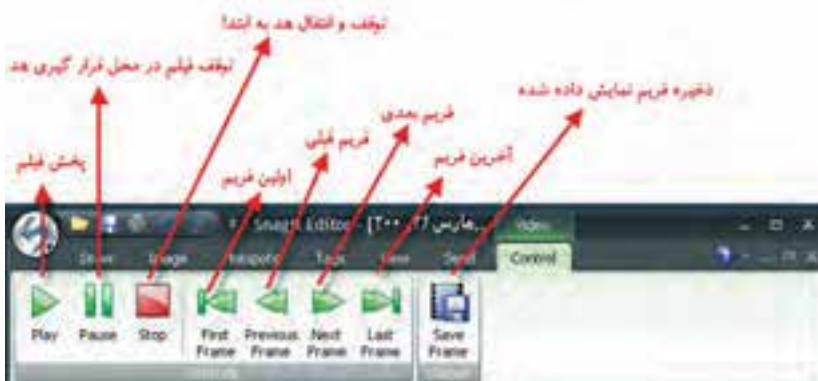
شکل ۸-۴ کادر محاوره SnagIt Editor در حالت Video