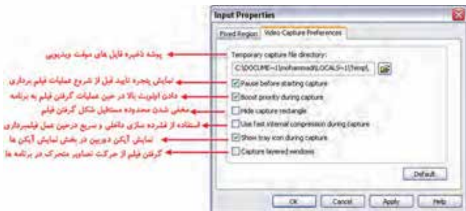
شکل ۳-۴ زبانه Video Capture Preferences از کادر محاوره Input Properties

در این زبانه شما می‌توانید تنظیمات مربوط به Capture در حالت Video از قبیل محل ذخیره‌سازی فایل‌های موقت ویدیویی، نمایش پنجره‌ی تأیید عملیات Capture قبل از شروع، پنهان نمودن مستطیل نشان‌دهنده‌ی محدوده‌ی Capture و... را در این بخش انجام دهید (شکل ۳-۴).