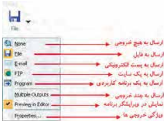
شکل ۴-۴ لیست بازشوی Output

در این قسمت خروجی حاصل از عملیات Capture می‌تواند در قالب یک فایل ویدیویی، ارسال به یک پست الکترونیکی یا یک سایت مشخص و حتی به یک برنامه‌ی خاص صورت گیرد.