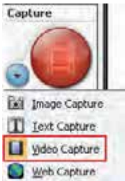
شکل ۱-۴ محیط SnagIt در حالت Video

برای گرفتن Capture به صورت Video، در قسمت Capture Mode روی گزینه Video Capture کلیک کنید (شکل ۱-۴).