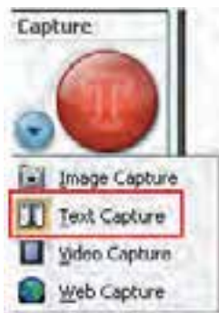
شکل ۳-۱ انتخاب حالت Capture

برای گرفتن Capture به صورت Text در قسمت Capture Mode روی گزینه‌ی Text Capture کلیک کنید. (شکل ۳-۱)