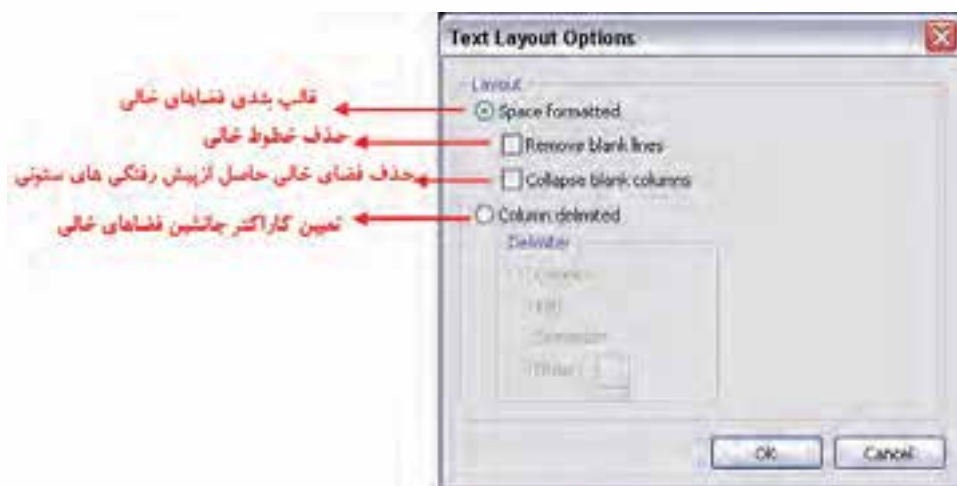
شکل ۳-۵ کادر محاوره تنظیمات جلوه Layout

از این گزینه برای تنظیم قالب بندی مربوط به فضاهای خالی و کاراکترهای جانشین قرار گرفته در این فضاها استفاده می‌شود با اجرای این گزینه، کادر محاوره‌ای مربوط به آن باز خواهد شد. (شکل ۳-۴)