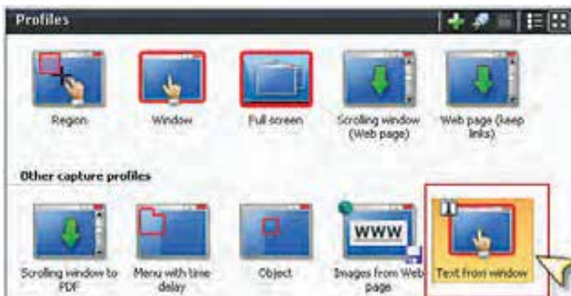
شکل ۳-۲ انتخاب نوع ورودی از بخش Profiles

پنجره‌ای را که می‌خواهید متن موجود در آن را جدا کنید، باز کرده و سپس در نرم‌افزار SnagIt از پانل Profile گزینه‌ی Text from a window را انتخاب کنید. اکنون اگر دکمه Capture را که در قسمت پایین و سمت راست کادر محاوره قرار دارد، کلیک کنید یا از کلید میانبر تعریف شده (Print Screen) استفاده کنید، اشاره‌گر ماوس به شکل یک دست در می‌آید؛ در این حالت چنانچه روی پنجره مورد نظر کلیک کنید، عملیات Capture انجام خواهد شد. (شکل ۳-۲)