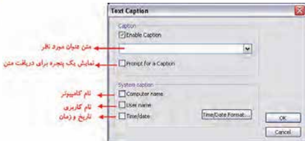
شکل ۳-۶ کادر محاوره Text Caption

با استفاده از این جلوه در بخش Effects می‌توان عناوینی مانند: قرار دادن یک عنوان برای تصویر، قرار دادن نام کامپیوتر، نام کاربر، اضافه کردن تاریخ و زمان را روی خروجی نهایی اعمال کرد. (شکل ۳-۶)