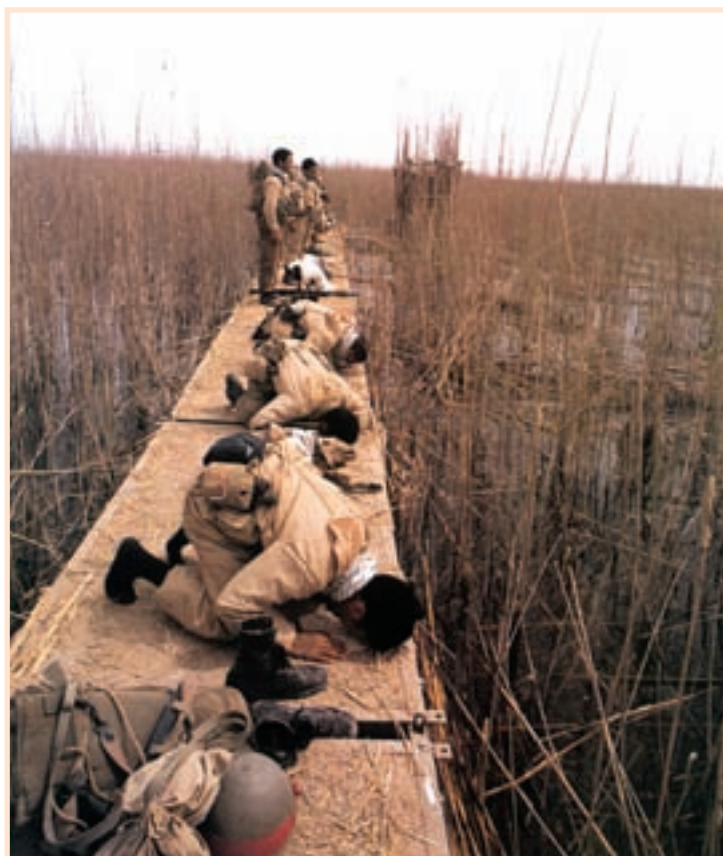
تصویر ۱-۳- رزمندگان در منطقه عملیاتی دوران دفاع مقدس در حال اقامه نماز

ایمان به خدا، رهبری حکیمانه امام خمینی (ره) و یکپارچگی و حمایت‌های مردمی نه تنها موجب پیروزی انقلاب اسلامی ایران شد، بلکه بالاترین سلاح و مهمات ما در هشت سال دفاع مقدس بود.