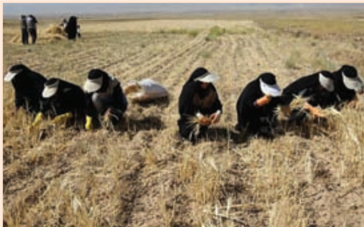
تصویر ۵-۲- حضور دانش آموزان بسیجی در عرصه سازندگی کشور

۴- حفظ دستاوردهای انقلاب اسلامی و حضور مؤثر در عرصه های سازندگی و امدادی.