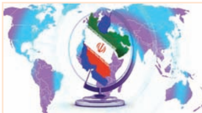
تصویر ۱-۲- جمهوری اسلامی ایران در بین کشورهای منطقه از امنیت ملی بالایی برخوردار است