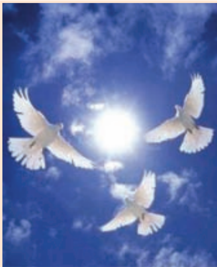
تصویر ۱-۳- پیام دین اسلام به جهانیان، صلح و دوستی است

برای نمونه در ابتدای ظهور اسلام، حضرت پیامبر (ص) به منظور گسترش دین خدا در بین مردم و برای جلوگیری از ایجاد جنگ و خونریزی به همراه پیروان خود به مدینه مهاجرت کردند. آن حضرت پس از ۱۰ سال، با وجود شکست دشمن، با شعار دوستی، برادری و «امروز روز رحمت است»، پیروزمندانه وارد مکه شدند.