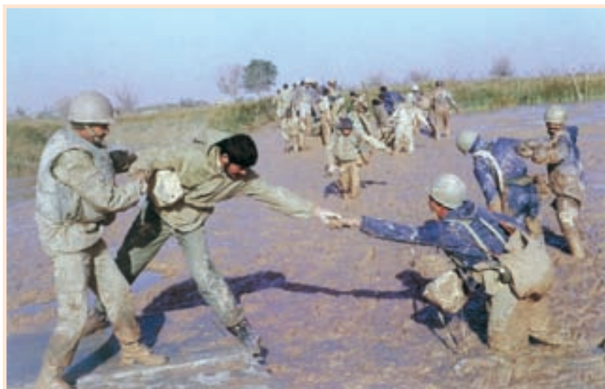
تصویر ۲-۳- رزمندگان میهن در منطقه عملیاتی والفجر ۸

امام خمینی (ره) فرمودند: «جنگ، جنگ است و عزت و شرف ما در گرو همین مبارزه است». فرزندان غیور ملت شریف ایران با اعتقاد به خدای بزرگ و نصرت الهی در صفوف متحد به سوی جبهه‌ها روانه شدند و این نوای شیرین را سر می‌دادند: «هر که دارد هوس کرب و بلا بسما...». موج عظیم مردمی در قالب «بسیج» برای دفاع از حقانیت اسلام و ایران به دفاع مقدس طعم غیرت و شرف دادند. سربازان ما در جبهه‌های نبرد حق علیه باطل به سرباز بودن خود می‌بالیدند. نیروهای مسلح شامل نیروی زمینی، نیروی هوایی، نیروی دریایی، نیروی انتظامی و هوانپروز و سپاه پاسداران انقلاب اسلامی با انگیزه‌های الهی، شانه به شانه بسیج که پشتوانه مردمی و بازوی توانایشان بود، با وجود کمبود سلاح و مهمات و مشکلات اولیه، جانانه و قهرمانانه می‌جنگیدند. عشایر غیور ایران زمین و اقوام مختلف کرد، لر، عرب، ترک، بلوچ و سایر قومیت‌ها و همچنین پیروان کلیه ادیان الهی در میهن ما متحد و منسجم تحت لوای پرچم مقدس جمهوری اسلامی و با هدایت و رهبری امام خمینی، سلحشوری و ایثارگری را معنا بخشیدند.