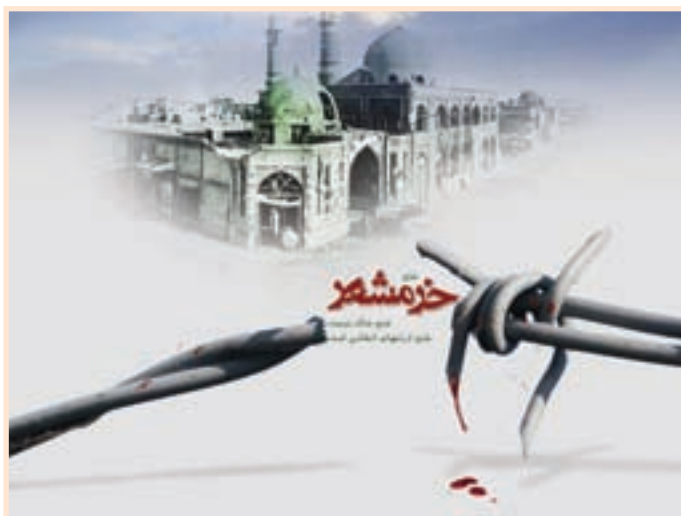
تصویر ۳-۳- خرمشهر را خدا آزاد کرد «امام خمینی»

عده‌ای از افراد معتقد بودند که با عقب راندن صدام در بسیاری از نقاط مرزی کشور، دیگر نیاز به ادامه جنگ نیست، اما مسئولان سیاسی و نظامی کشور و عموم مردم معتقد بودند که در چنین شرایطی نمی‌توان به صداقت دشمن و اراده سازمان‌های بین‌المللی اطمینان کرد و آتش‌بس را پذیرفت.