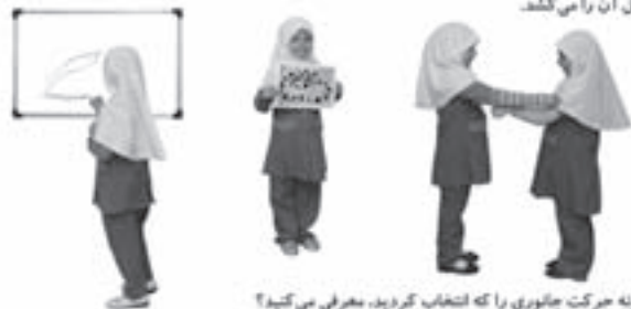
شما چگونه حرکت جانوری را که انتخاب کردید، معرفی می‌کنید؟