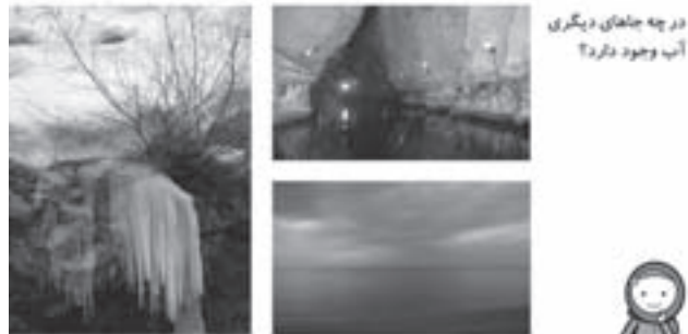
در چه جاهای دیگری آب وجود دارد؟

آیا در بدن ما جانوران و گیاهان هم آب وجود دارد؟ چه جانورانی را می‌شناسید که در آب زندگی می‌کنند؟