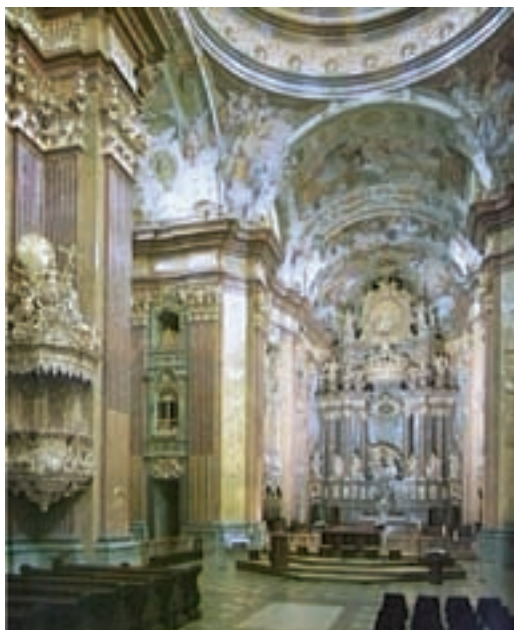
کلیسا - معماری دوران مسیحیت

ادبیات اروپا معمولاً با مکتب کلاسیک آغاز می‌شود. اساسی‌ترین تعریفی که از این مکتب ارایه می‌شود «بازگشت به هنر قدیم یونان و روم به تبع نهضت رنسانس و اومانیزم» است. امپراتوری روم غربی (در قرن پنجم میلادی) حتی پیش از سقوط، ارتباط خود را با فرهنگ و ادب یونان بریده بود و وارث فرهنگ یونانی، و حتی مرکز قدرت امپراتوری روم شرقی بود. در غرب به علت رسمیت یافتن زبان لاتین به جای یونانی، حتی در قرون چهارم و پنجم، بی‌توجهی به زبان و فرهنگ یونانی نیز تشدید شده بود.