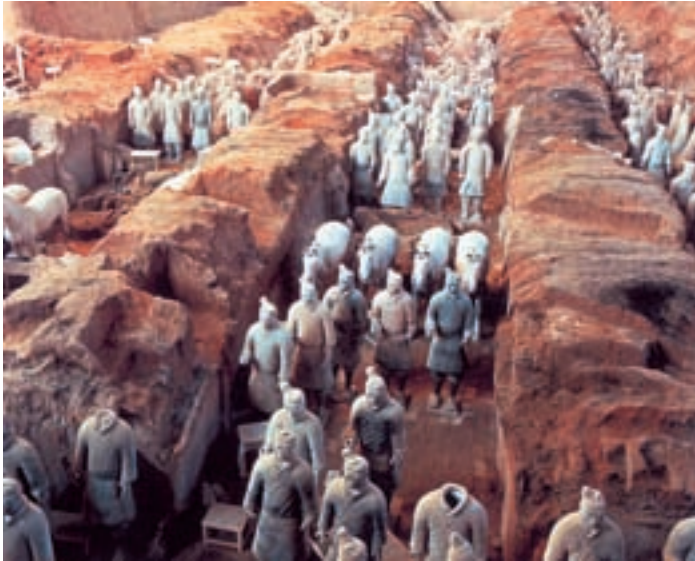
مقبره‌ی امپراتور شی‌هان‌دی - منطقه‌ی زیان‌شان‌زی - چین

نظر به این‌که تقسیم دوران‌های تاریخی به سه بخش قرون قدیم، قرون میانه و قرون جدید، ابتدا از سوی مورخان اروپایی به میان آمده، طبیعی است که در مورد سرزمین‌ها و ملت‌های اروپایی به کار رفته باشد.