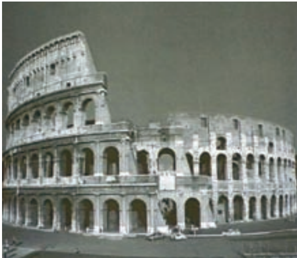
کلوزیوم - رُم ایتالیا

قرن پنجم قبل از میلاد، روم شاهد برتری نظامیان در امور مملکتی بود که قدرت مطلقه‌ی فرمانروایان را به هم ریخت و شالوده‌ی نظام جدیدی به نام جمهوری را به کار بست. آنچه که در ادبیات روم قابل تأمل است این است که ادبیات یونانی چنان بر زندگی مردم روم نفوذ کرده بود که نویسندگان رومی آثار خود را به تقلید از نویسندگان یونانی می‌نوشتند. «آندروونیکوس» که خود یونانی‌الاصل بود پدر ادبیات روم شناخته می‌شود. او اودیسه‌ی هومر را به زبان لاتین ترجمه کرد (حدود ۳۴۰ ق.م).