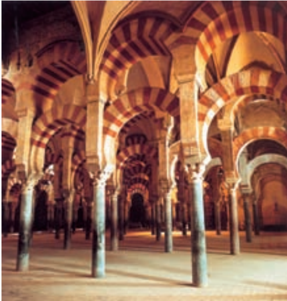
معماری مسجد مسلمانان — اسپانیا

سرگذشت مردی اشرافی و در عین حال سفیهی به نام دن کیشوت را که مجذوب داستان‌های قهرمانان گذشته شده، با زبان مضحک و در عین حال غم‌انگیز، بیان می‌کند. دن کیشوت، به امید انجام کارهای خیر (همچون شوالیه‌ها) به سیر و سفر می‌پردازد. او سراسر، نجابت و شرافت است، لیکن در قالبی احمقانه. سروانتس در این داستان، نه فقط اشراف روبه زوال اسپانیا، بلکه خود اسپانیا را به نقد می‌کشد.