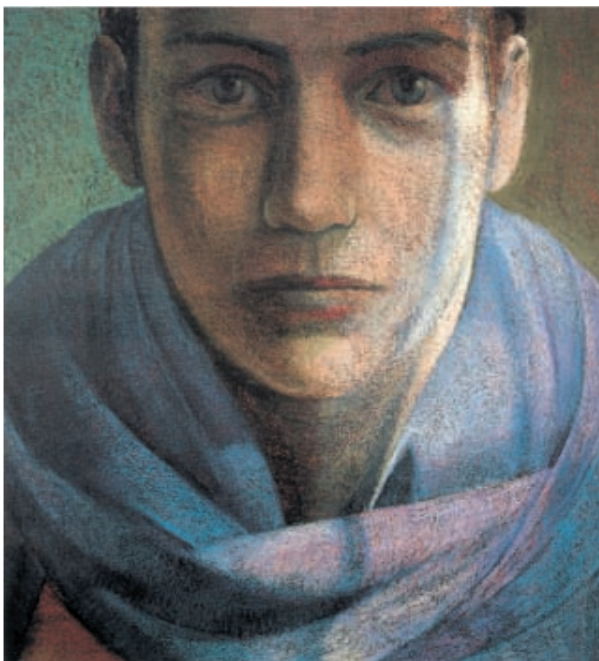
تصویر ۱۷-۳- اثر سوزان مور ۱ ، پاستل روغنی روی کاغذ، (۱۷۰/۲×۱۸۸ سانتی‌متر)