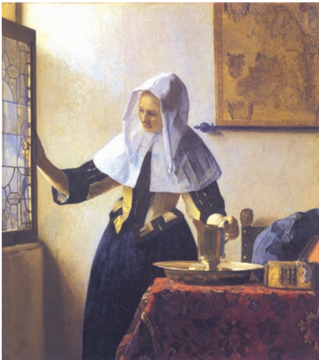
تصویر ۱-۳- اثر یان ورمیر ۱ ، رنگ روغن روی بوم، (۴۵/۷×۴۰/۶ سانتی متر)

سورا ۲ نقاش پست امپرسیونیست ۳ نیز، با استفاده از نورپردازی متمرکز در تصویر (۲-۳) توانسته است تیرگی و روشنیهای بسیار جذابی را در اثر خود ایجاد نماید. وی، استادانه، تغییر مایه سیاه و سفید را به منظور القای عمق فضایی اثرش به کار گرفته است. شما هم می‌توانید در این مرحله از تأکید بر جزئیات دوری کنید. با تار کردن چشمها، تفکیک نور و سایه کلی در کار میسر خواهد بود. این کار باعث می‌شود تا کمتر به جزئیات پردازید.