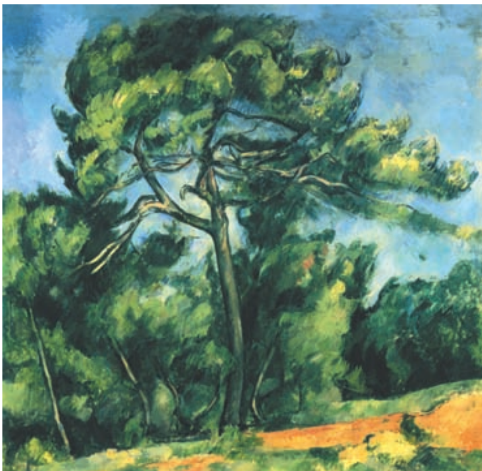
تصویر ۳۰-۲- اثر پل سزان، رنگ روغن روی بوم، (۸۵×۹۲ سانتی‌متر)

سزان نیز در تابلو نقاشی موسوم به «کاج بزرگ» تصویر (۲-۳۰) مجموعه‌ای از رنگهای سرد را به کار گرفته است و با وجود رنگهای گرم بخش پایین اثر و لکه‌های گرمی که در سطح نقاشی دیده می‌شود، حاکمیت با رنگهای سرد است و رنگهای گرم بخش پایین تابلو به عمق نمایی اثر کمک کرده است چرا که جلوتر از رنگهای دیگر دیده می‌شود، تصویر (۲-۳۱) نیز به گروه دیگری از رنگهای سرد اشاره دارد.