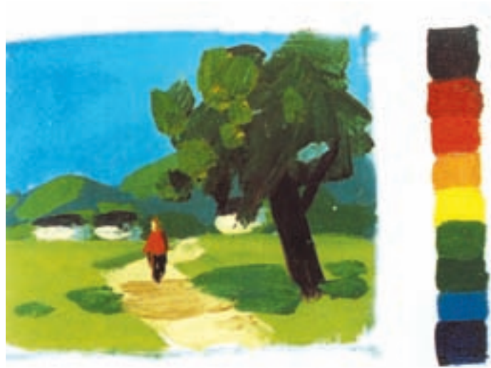
تصویر ۱۵-۲- رنگهای اصلی و ثانویه - سرد

در کار ملاحظه می‌کنید. نقاش، به سادگی به کمک درجات تیرگی و روشنی رنگ، سطوح عناصر تصویر نقاشی خود را از یکدیگر مجزا کرده است. شما درخت و کوهها و حتی پیکر انسان را در کار، با تفکیک ساده سطوح تیره روشن برای ایجاد حجم و نور و سایه می‌بینید.