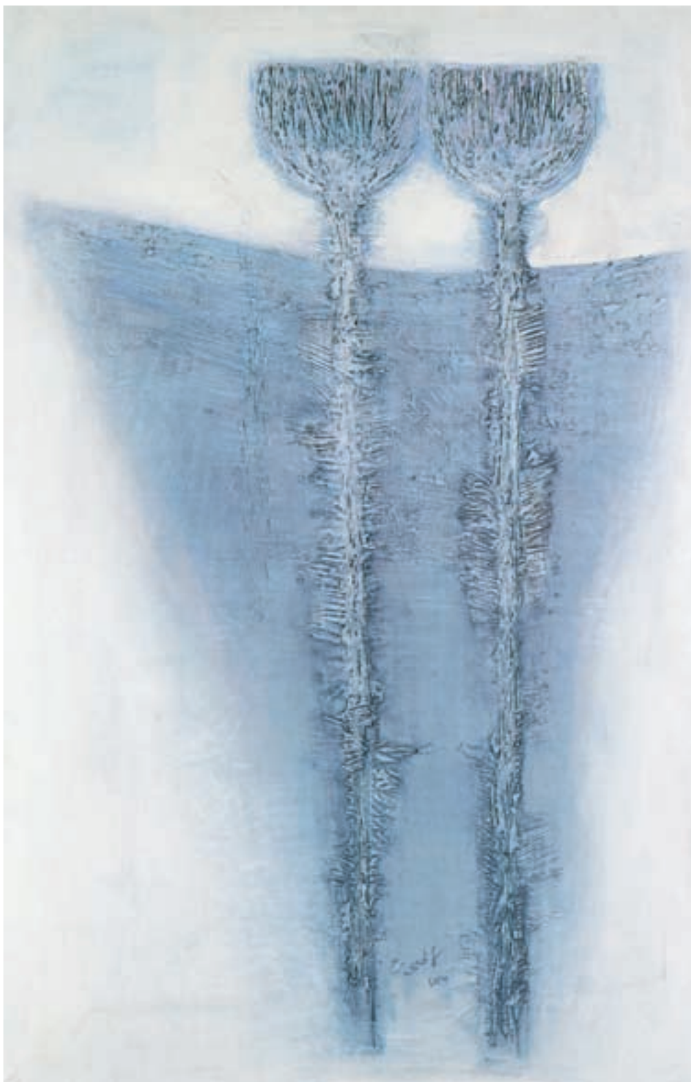
تصویر ۴۲-۲۔ انر حسین کاظمی، رنگ روغن روی بوم، (۹۰×۱۴۰ سانتی متر)