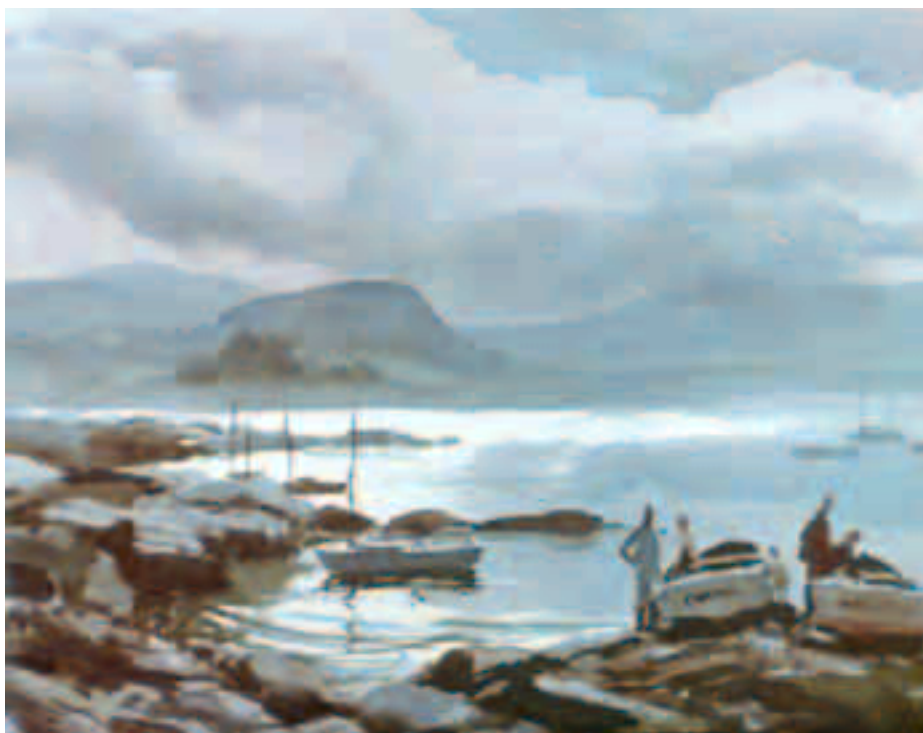
تصویر ۱۳-۲- اثر پایک ۱ ، ابرنگ، (۵۶×۷۶ سانتی‌متر)