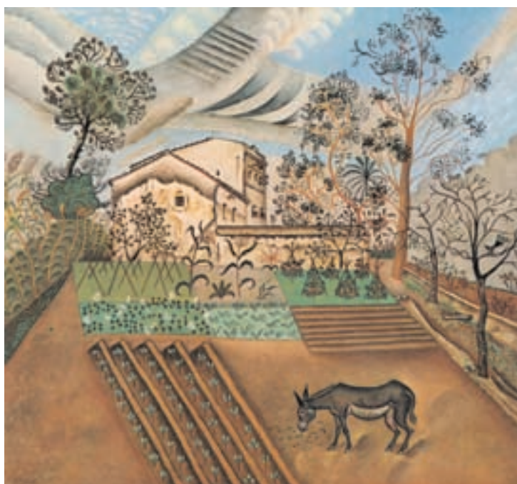
تصویر ۲-۲ اثر خوان میرو، رنگ روغن روی بوم، (۶۰×۷۰ سانتی متر)