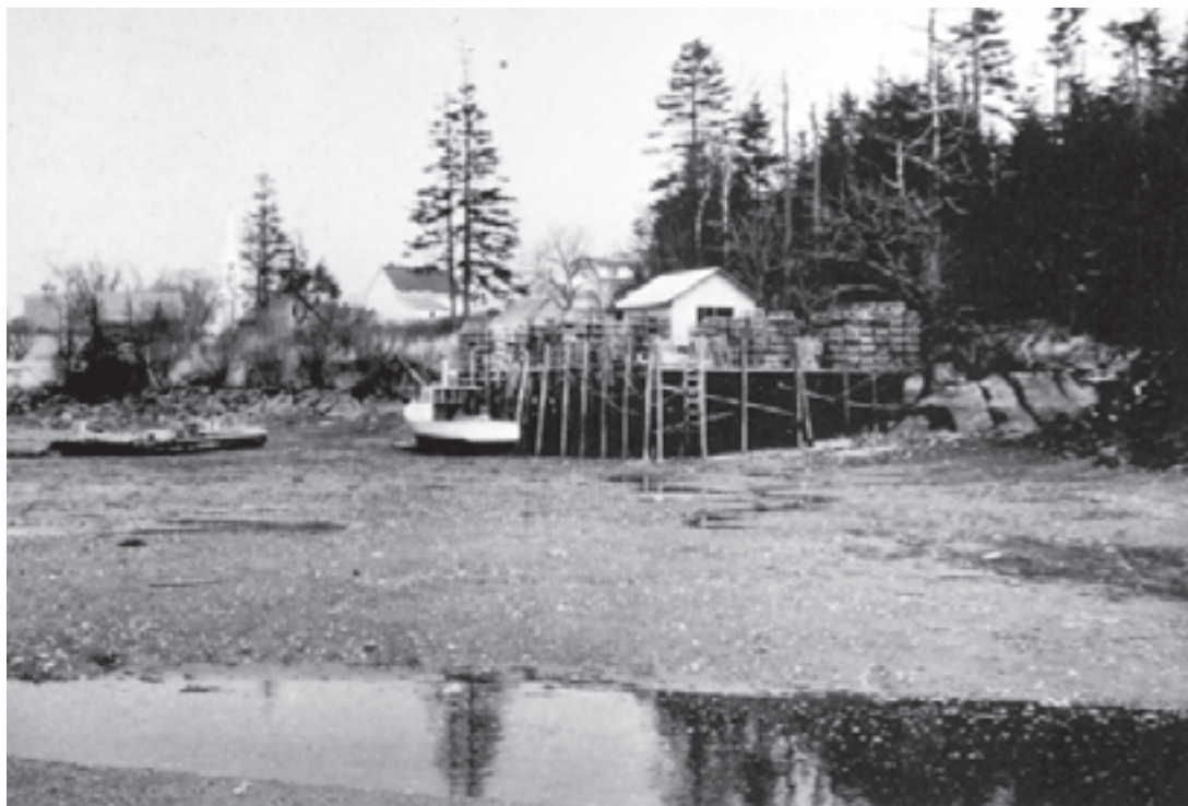
تصویر ۲-۹- عکس از منظره، اثر کادل ۱

تصاویر (۲-۹، ۲-۱۰، ۲-۱۱) نمونه دیگری از تهیه پیش طرح از منظره، نشان می‌دهند. ابزار شما در این مرحله می‌تواند، زغال، مداد و یا آب مرکب باشد.