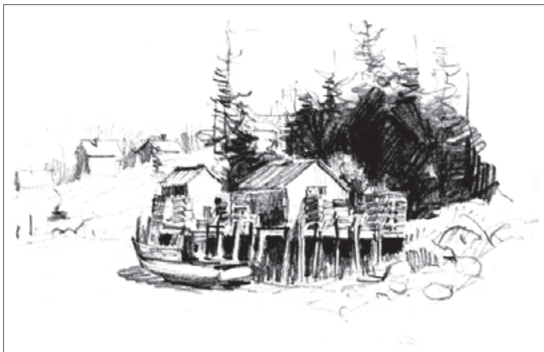
تصویر ۲-۱۰- پیش طرح از منظره با مداد، اثر کادل