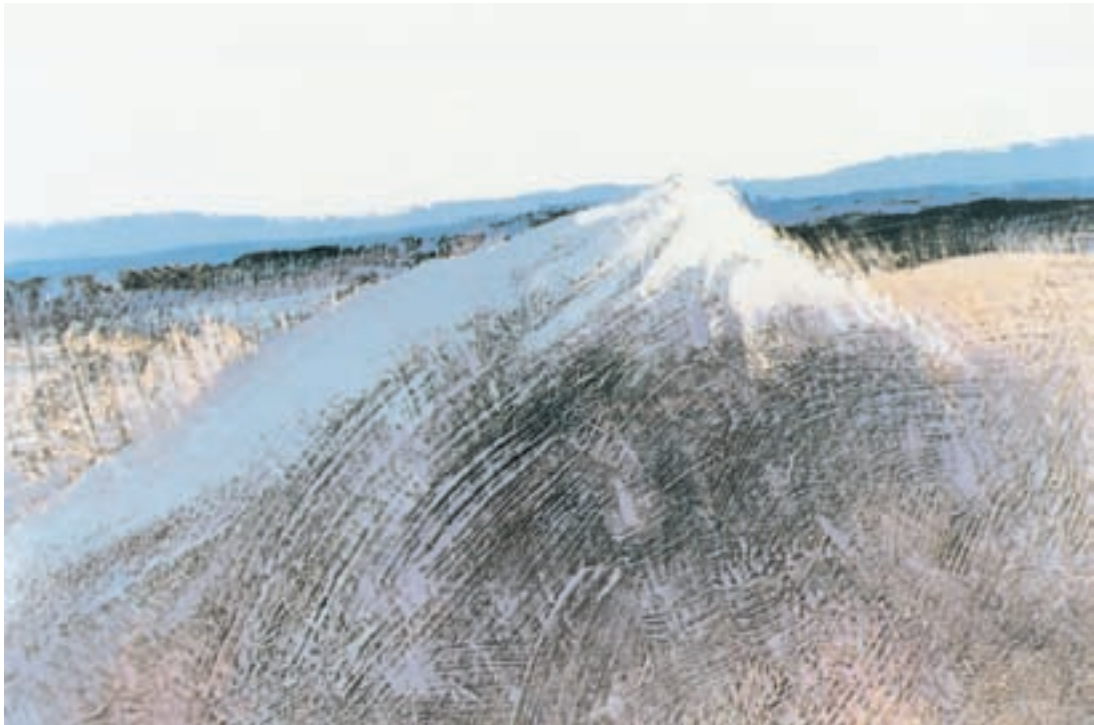
تصویر ۶-۲- اثر حسین کاظمی، رنگ روغن روی بوم، (۱۵۰×۱۰۰ سانتی‌متر)