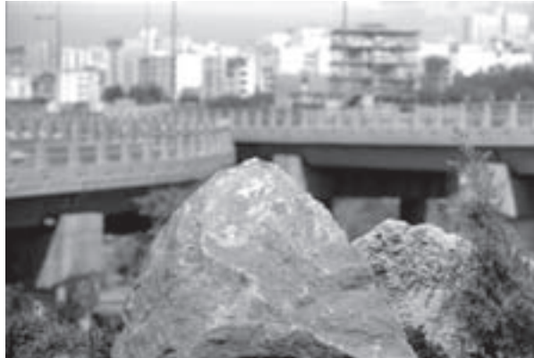
تصویر ۷-۵- لنز تله