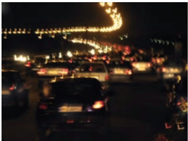
تصویر ۱۹-۵- تأثیر لرزش دست بر تصویر