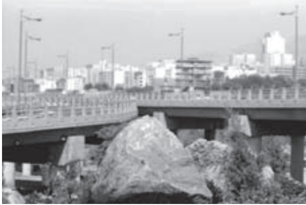
تصویر ۶-۵- لنز نرمال