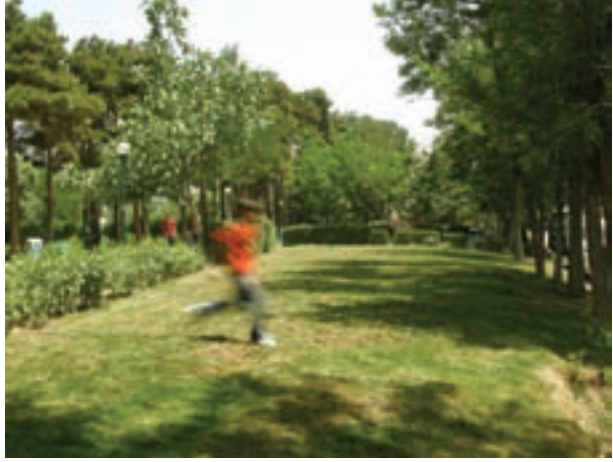
تصویر ۱۱-۵- حرکت موازی با دوربین