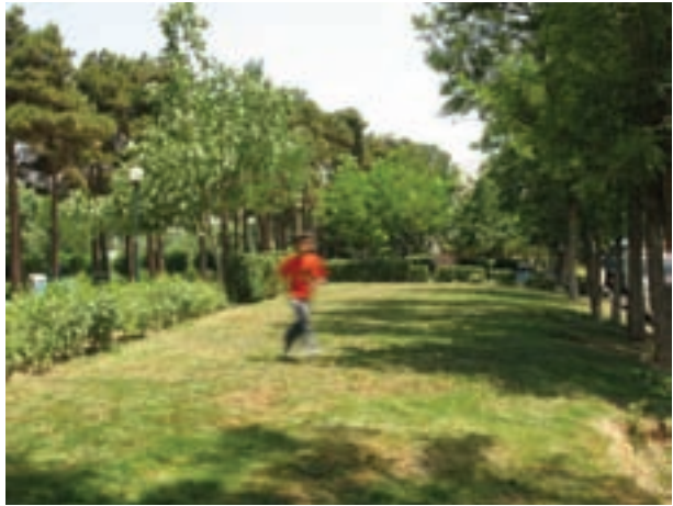
تصویر ۱۲-۵- حرکت مایل نسبت به دوربین