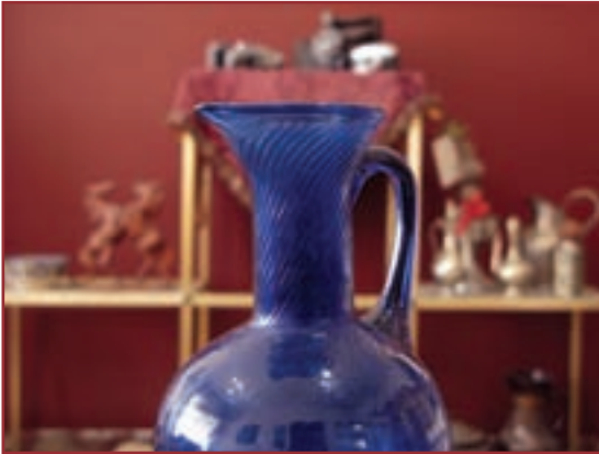
تصویر ۲-۵- عکسی که با f.16 گرفته شده است.