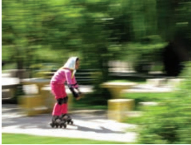
تصویر ۱۷-۵- روش پانینگ