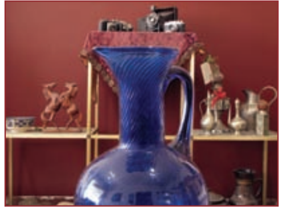
تصویر ۱-۵- عکسی که با f.2.8 گرفته شده است.

مثلاً اگر با یک دیافراگم ثابت مثل f.8 یک بار روی موضوعی در 5^\circ سانتی متری دوربین واضح سازی کنیم و بار دیگر روی فاصله 15^\circ سانتی متری، خواهیم دید که عمق میدان وضوح در عکس دوم بسیار بیشتر از عکس اول است با این که دیافراگم در هر دو عکس یکی بوده است (تصاویر ۳-۵ و ۴-۵).