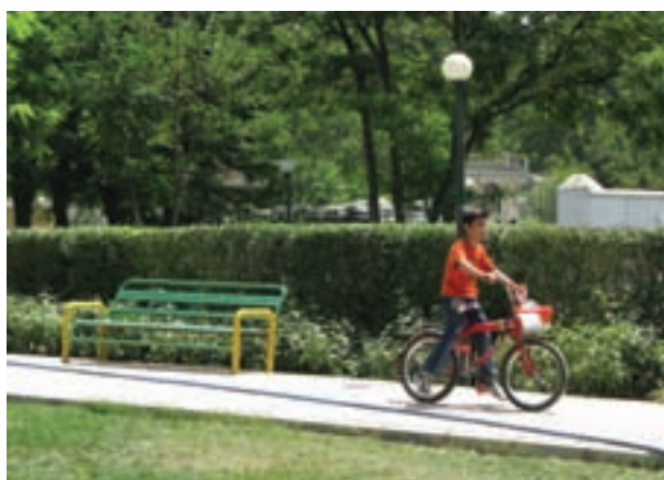
سرعت \frac{1}{125} ثانیه

تصویر ۹-۵- تأثیر سرعت‌های مختلف بر موضوعات متحرک