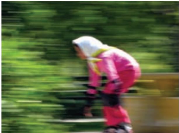
تصویر ۱۸-۵- اغراق در سرعت موضوع با انتخاب سرعت‌های پایین‌تر دوربین