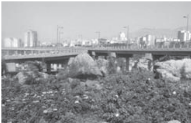
تصویر ۵-۵- لنز واید

سومین عاملی که در افزایش یا کاهش عمق میدان مؤثر است، فاصله کانونی لنزها است به این معنی که هر چه فاصله کانونی لنز کمتر باشد، عمق میدان وضوح بیشتر و هر چه فاصله کانونی بیشتر باشد عمق میدان وضوح کمتر خواهد شد، به عبارت ساده‌تر لنزهای واید دارای عمق میدان بیشتری نسبت به لنزهای تله هستند. (تصاویر ۵-۵ تا ۵-۷)