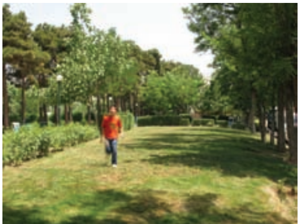
تصویر ۱۳-۵- حرکت عمود بر دوربین