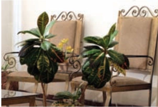
تصویر ۴-۵- فاصله از اولین موضوع 15^\circ سانتی متر