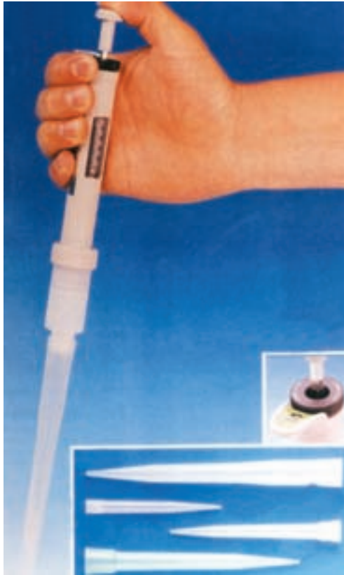
شکل ۱-۳- نمونه‌ای از میکروپیپت مخصوص نمونه برداری

عمیق که با وسایل دستی آب از آن می‌کشند نمونه برداری کنند. با رعایت نکات بهداشتی ریسمانی به گردن یک بطری بسته، پس از برداشتن در بطری آن را داخل چاه می‌کنند. وقتی که شیشه از آب پر شد آن را به کمک ریسمان بالا می‌کشند. پس از برداشت نمونه و بستن و مهر و موم کردن، ذکر مشخصات نمونه روی برجسب شیشه الزامی است و شیشه‌های حاوی نمونه را از آب پر نمی‌کنند بلکه \frac{3}{4} شیشه را از آب پر می‌کنند تا در موقع آزمایش بتوان آن را مخلوط کرد.